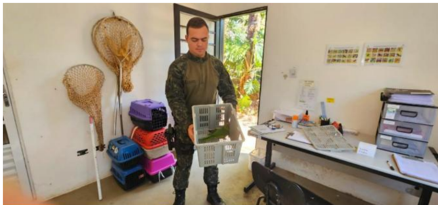
(57642) Maritaca, suspeita de colisão com algum objeto. Entregue pela Polícia Ambiental de Amparo no dia 05-10-2025