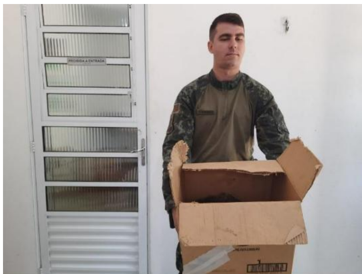
(58178 até 58180) Gambás-de-orelha-branca, filhotes, sem histórico. Entrega pela Polícia Ambiental de Amparo no dia 20-10-2025