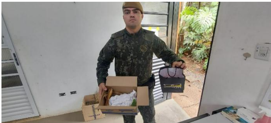
(58474) Periquito-de-encontro-amarelo, filhote, órfão, encontrado em via pública e (58475) Cuíca, animal também encontrado em via pública. Entregues pela Polícia Ambiental de Amparo no dia 29-10-2025