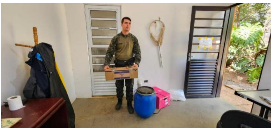
(58047) Paca, encontrada em via pública com lesão pela face e corpo e (58048) Gambá-de-orelha-preta, encontrado em via pública com lesões nas patas. Entregues pela Polícia Ambiental de Amparo no dia 16-10-2025