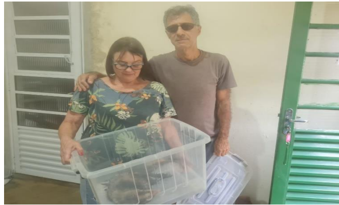
(49208)- Gambá, adulto, encontrado em condomínio machucado, trazido por munícipe, Cabreúva, 17-04-2024