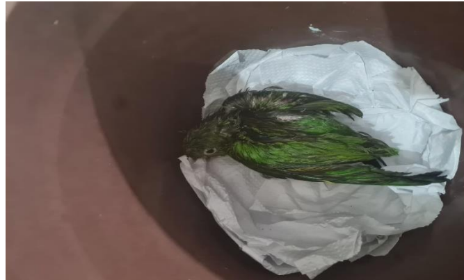
(49259) - Maritaca