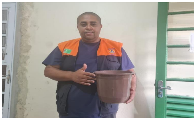
(49259) - Maritaca, jovem, ataque por cachorro, entregue por Defesa Civil de Cabreúva, 24-04-2024