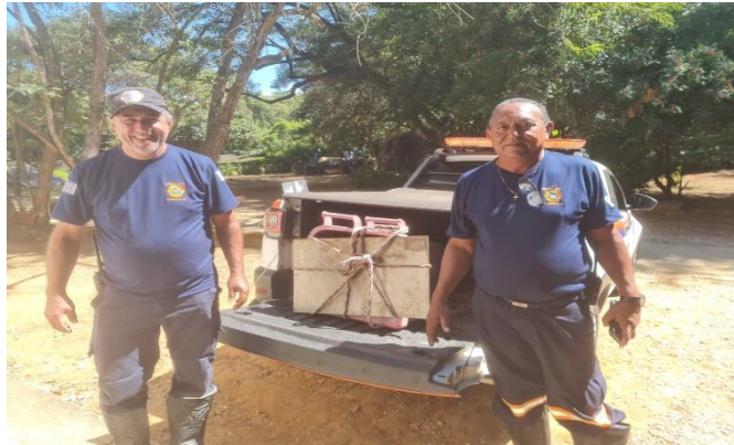
(49235)-Cachorro-do-mato, adulto, encontrado em empresa, trazido pela Defesa Civil, Cabreúva, 22-04-2024