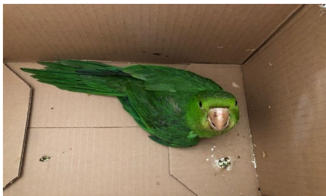
(49087) - Maritaca