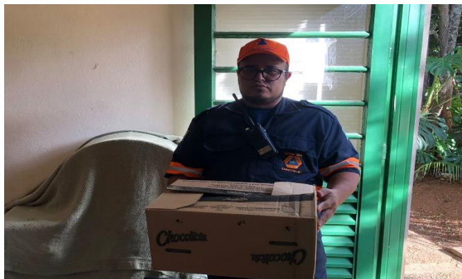
(49087) - Maritaca, jovem, animal encontrado em condomínio. Entregue pela defesa civil de Cabreúva no dia 01-04-2024