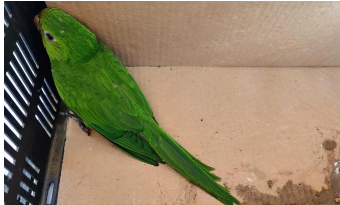
(49127)-Maritaca, adulta, colidiu com vidro de empresa. Entregue por munícipe de Cabreúva no dia 06-04-2024