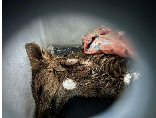
(53455) Cachorro do mato