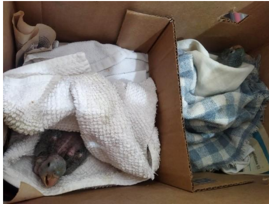
(53768 - 53769) Maritaca filhote