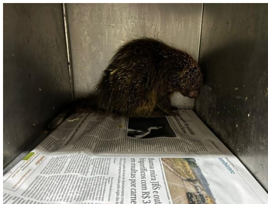
(53710) Ouriço cacheiro