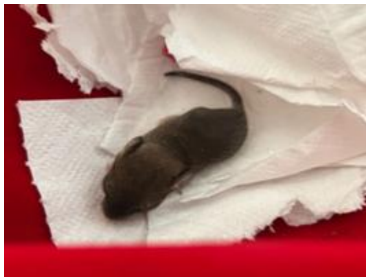
(53876) Camundongo do Campo