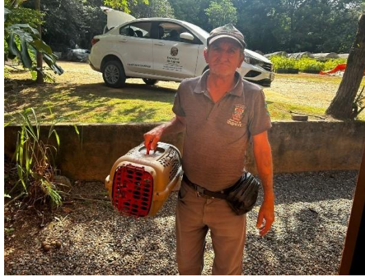
(53596) Ouriço cacheiro, animal encontrado enroscado em cerca, entregue por Departamento de fauna da prefeitura de Itupeva 13/01/2025