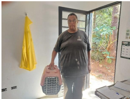
(53545) Ouriço, resgatado em chácara de munícipe com rabo machucada, entregue por funcionário da Prefeitura de Itupeva 10/01/2025