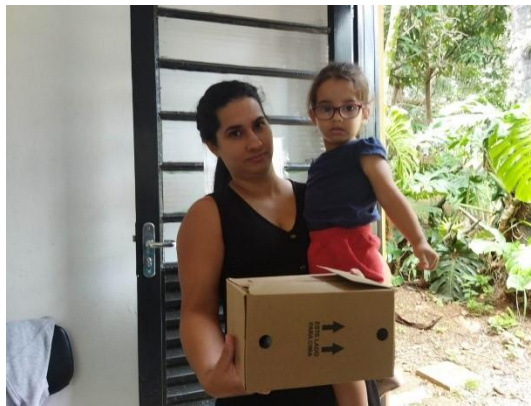
(53888) Asa Branca, sem histórico e entregue por munícipe de Itupeva 27/01/2025