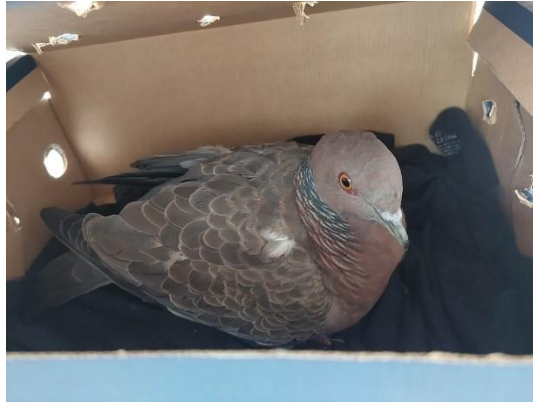
(53546) Asa Branca adulta