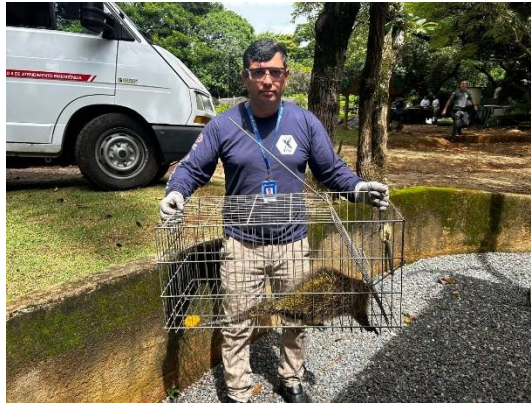
(53710) Ouriço cacheiro, encontrado em forro de empresa, entregue por município de Itupeva 18/01/2025