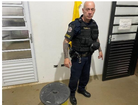
(53454) Ouriço Cacheiro, encontrado machucado de baixo de um carro, entregue pela GCM, Itupeva 06/01/2025