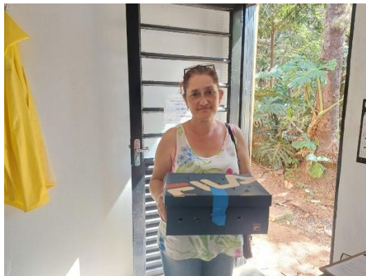
(53546) Asa Branca adulta, encontrada caída em condomínio por munícipe de Itupeva 10/01/2025