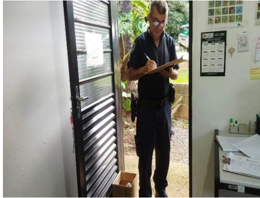
(53431) Pombo, chegou em óbito, entregue pela GM, na cidade de Itupeva, 05/01/2025