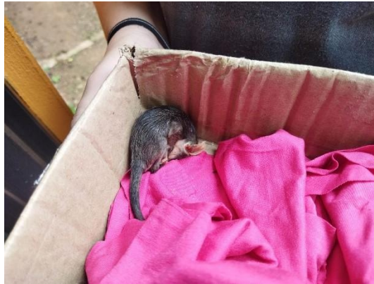
(53900) Gambá de Orelha Preta