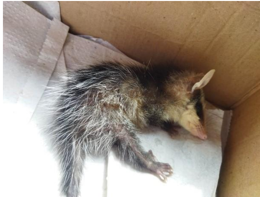
(53893) Gambá de Orelha Preta