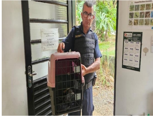
(53466) GOB, encontrado na calçada debilitado, entregue pela GM, na cidade de Itupeva 07/01/2025