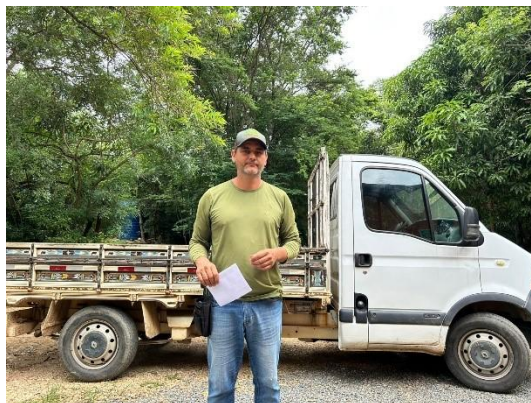
(53455) Cachorro do mato, encontrado estirado em via pública debilitado, entregue por munícipe, na cidade de Itupeva 07/01/2025