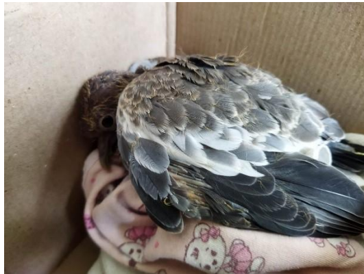
(53888) Asa Branca