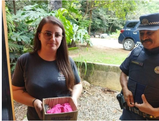
(53900) Gambá de Orelha Preta, entregue pela Guard Municipal de Itupeva 28/01/2025