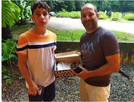
(53893) Gambá de Orelha Preta, encontrado machucado e entregue por munícipe de Itupeva 27/01/2025