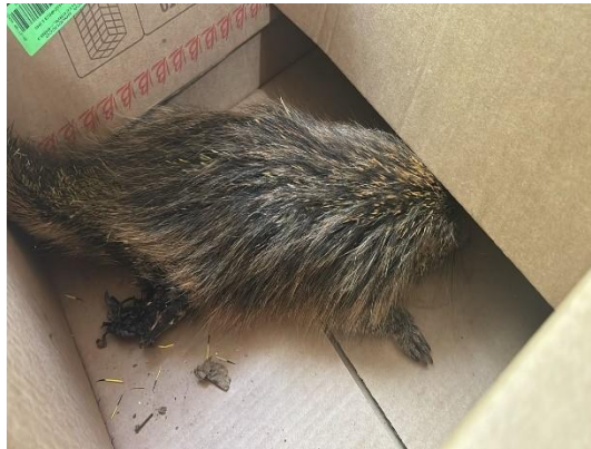
(53596) Ouriço cacheiro