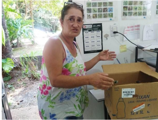
(53768 - 53769) Maritaca filhote, encontrado em forro de residência, entregue por município de Itupeva 20/01/2025