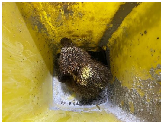
(53454) Ouriço Cacheiro