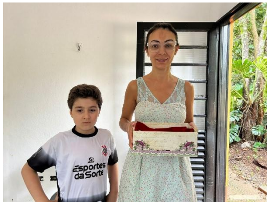
(53876) Camundongo do Campo, encontrado sozinho e entregue por munícipe de Itupeva 27/01/2025