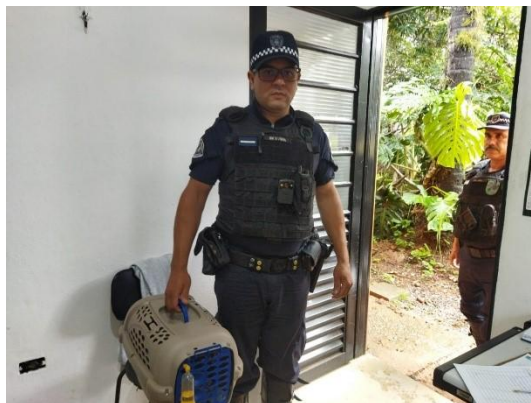
(53895) Maritaca, sem histórico e entregue pela Guarda Municipal de Itupeva 27/01/2025