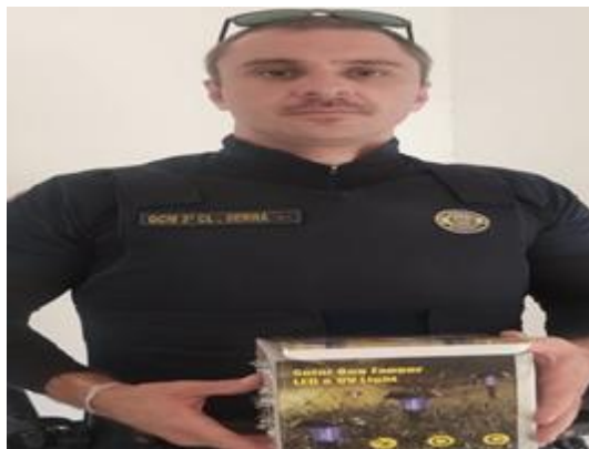
(53814) Canário, encontrado por municípe, entregue pela Guarda Civil Municipal de Itupeva 22/01/20