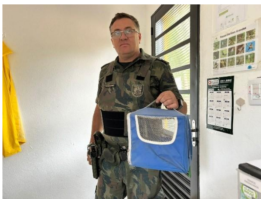
(53593) Quiri-quiri adulto, caiu em quintal e foi atacado por cão, entregue pela Guarda Ambiental de Cajamar 13/01/2025