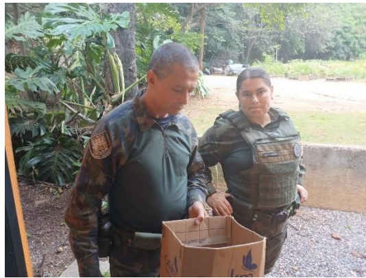
(53737 - 53738) Bem te vi, ataque de gato e filhotes órfãos, entregue pela Guarda Municipal Ambiental de Cajamar 19/01/2025