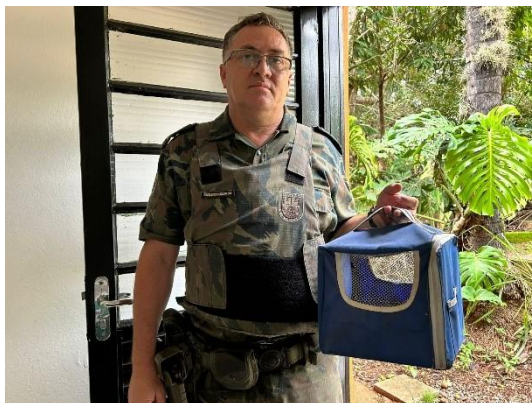
(53919) Beija-flor-tesoura-verde adulto, encontrado com fatura na asa, após chegar veio a óbito, entregue pela Guarda Civil Municipal de Cajamar 29/01/2025