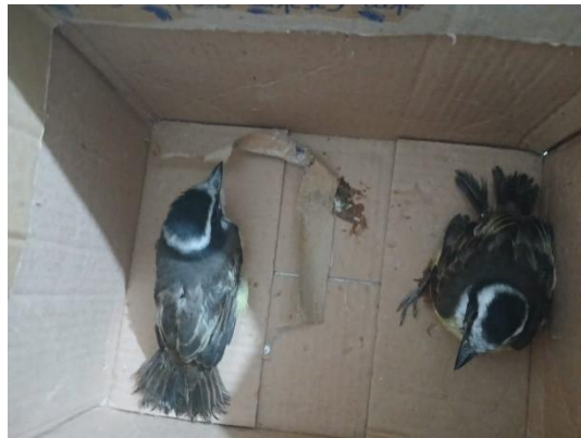
(53737 - 53738) Bem te vi