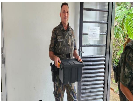
(53940) Saracura, vítima de atropelamento e entregue pela Guarda Civil Municipal de Cajamar 30/01/2025