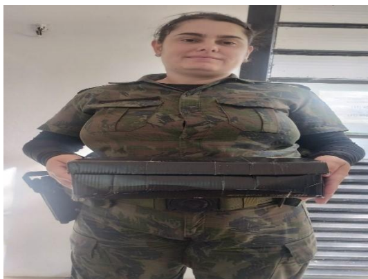
(53818-53819) Maritacas, encontradas por munícipes com um óbito, entregue pela Guarda Civil Municipal de Cajamar 22/01/2025