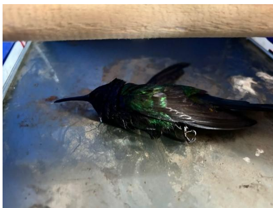
(53919) Beija-flor-tesoura-verde adulto