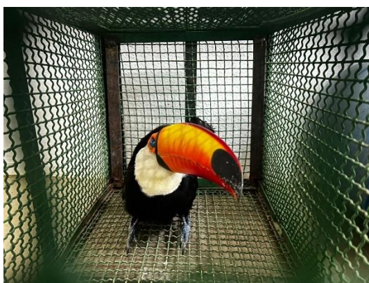
(53711) Tucano Toco