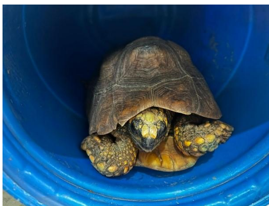
(51712) Jabuti Tinga

(53711) Tucano Toco, encontrado na rua sem conseguir voar, (51712) Jabuti Tinga, encontrado em quintal de munícipe, entregue pela Guarda Civil Municipal de Cajamar 18/01/2025