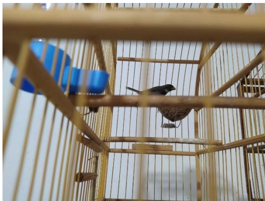
(53412) Coleirinho, entrega voluntária, entregue pela Guarda Civil Municipal, na cidade de Cajamar, 04/01/2025