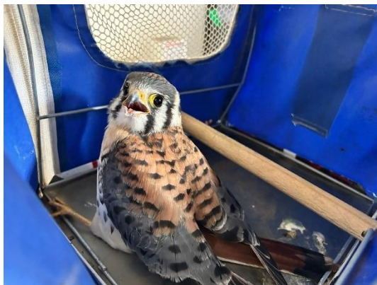
(53593) Quiri-quiri adulto