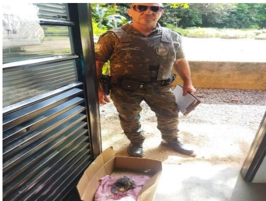
(53785) Gambá de Orelha Branca, ataque de cão, entregue por Guarda Municipal de Cajamar 20/01/2025