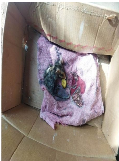
(53785) Gambá de Orelha Branca