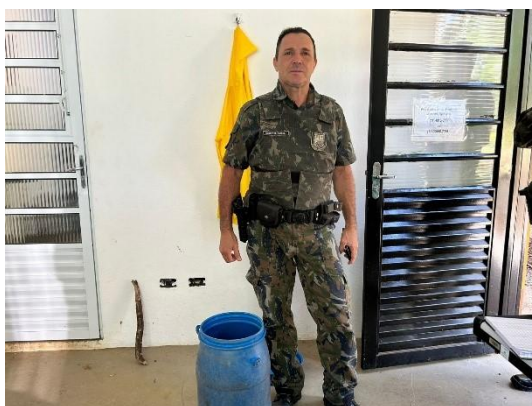
(53492) Sagui Tufo Preto adulto, possível eletrocussão, entregue pela Guarda Civil Municipal, na cidade de Cajamar 08/01/2025