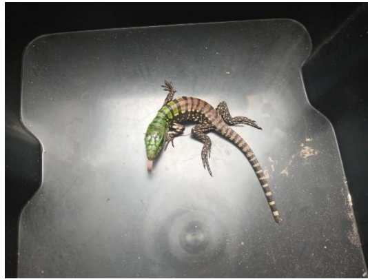
(53739) Teiú filhote