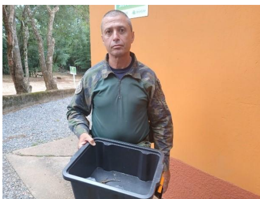
(53739) Teiú filhote, encontrado em residência, sem movimento dos membros posteriores, entregue pela Guarda Municipal Ambiental Cajamar 19/01/2025