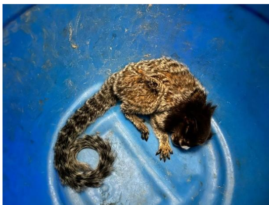
(53492) Sagui Tufo Preto adulto