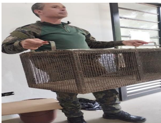
(53809) Gambá de Orelha Preta, animal encontrado em beira de estrada com lesão em coluna, entregue por Guarda Civil Municipal de Cajamar 22/01/2025