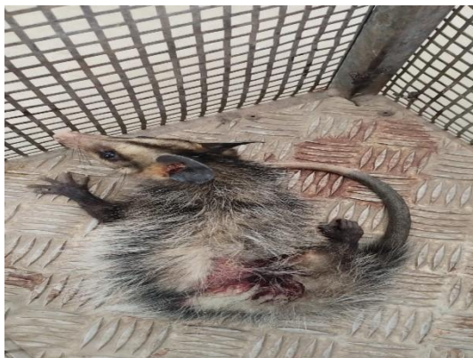
(53809) Gambá de Orelha Preta