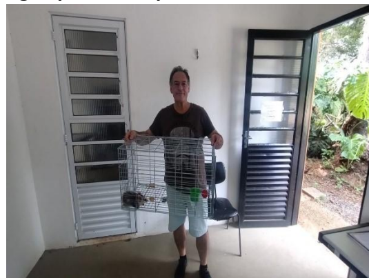
(53870) Gambá de Orelha Branca, resgate residencial e entregue por munícipe de Cabreúva 26/01/2025