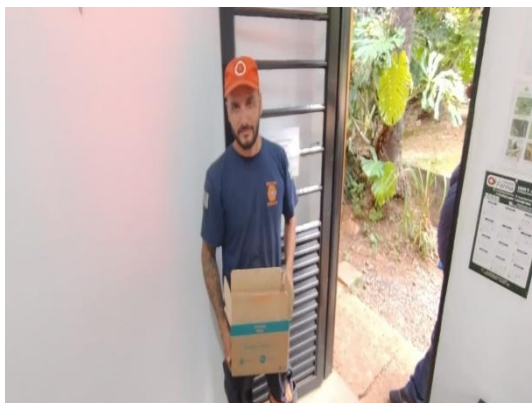
(53805-53806) Maritacas, encontrados na câmara municipal, trazidos pela Defesa Civil de Cabreúva sem lesões evidentes 21/01/2025