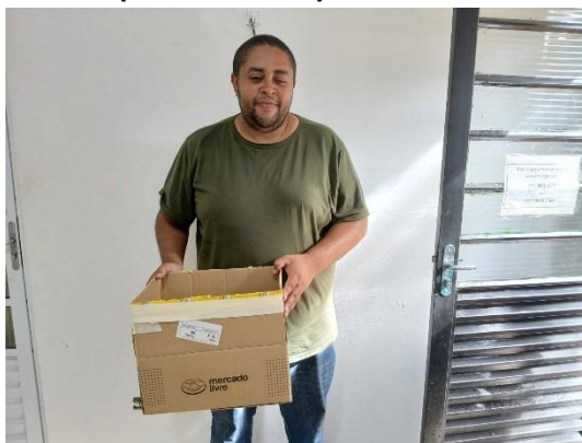
(53657) Coruja do mato, atacado por cão, entregue pela Defesa Covil, cidade de Cabreúva 17/01/2025