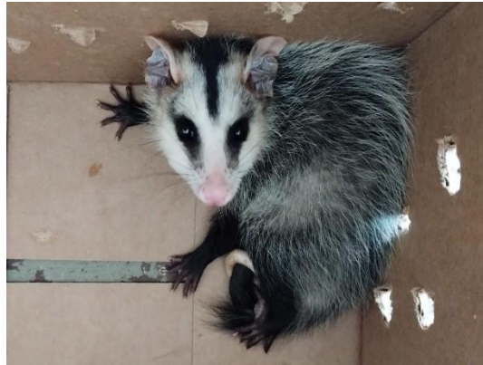
(53870) Gambá de Orelha Branca