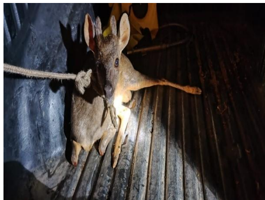
(53807) Veado catingueiro