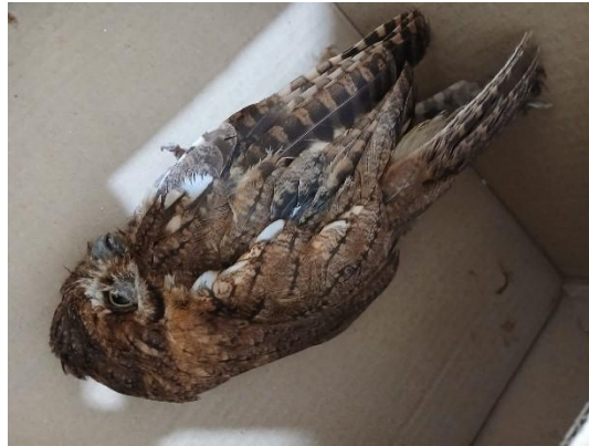
(53657) Coruja do mato