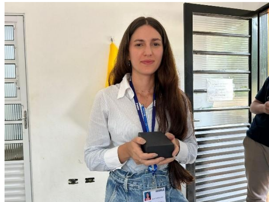
(53590) Maritaca filhote subdesenvolvido, encontrado em residência em sítio, entregue por munícipe de Cabreúva 13/01/2025