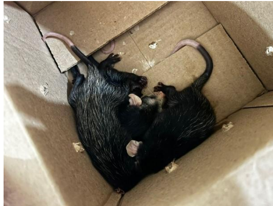
(53721-53727) Gamba de orelha Branca filhote. Proveniente de Bragança Paulista e entregue para Associação Mata Ciliar 18/01/2025