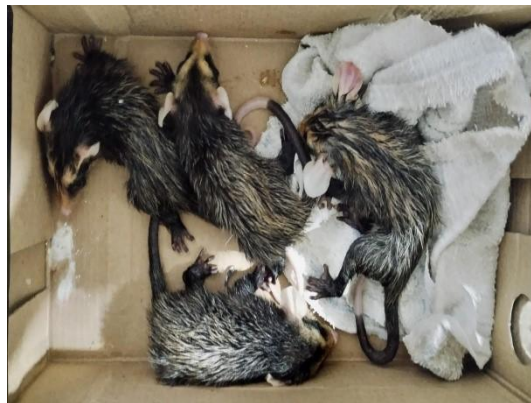
(53945-53948) Gambá Orelha Preta, resgatados dentro de máquina, entregues por SMMA de Bragança Paulista 30/01/2025