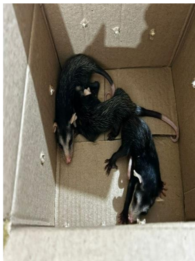
(53721-53727) Gamba de orelha Branca filhote. Proveniente de Bragança Paulista e entregue para Associação Mata Ciliar 18/01/2025