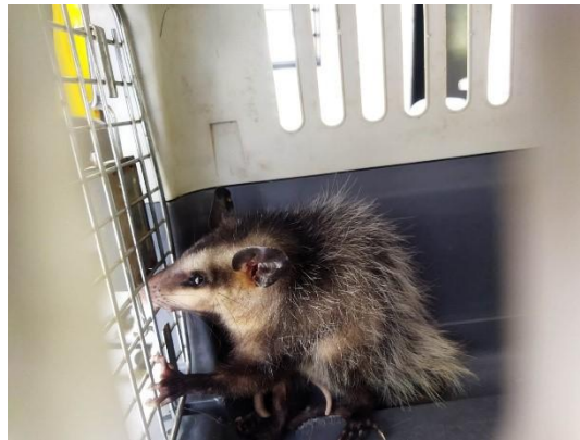
(53890) Gambá de Orelha Preta. Proveniente de Bragança Paulista e entregue pela Associação Mata Ciliar 27/01/2025