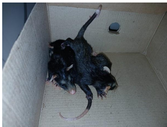
(53539) GOB, (53555-53557) GOB, sem histórico. Proveniente de Bragança Paulista no dia 10/01/2025