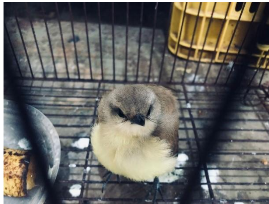
(53800) Suiriri, sem histórico. Proveniente pela Secretaria Municipal do Meio Ambiente de Bragança Paulista 21/01/2025