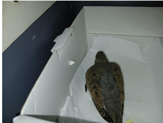
(53538) Avoante, sem histórico. Proveniente de Bragança Paulista no dia 10/01/2025