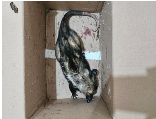
(53925) Gambá de Orelha Preta, sem histórico e da cidade de Bragança 29/01/2025