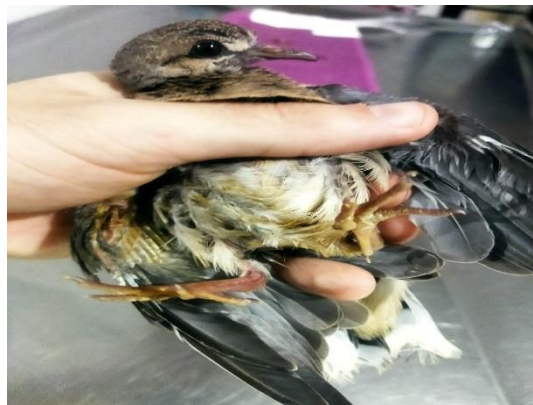
(53415) Rolinha, asa quebrada. Proveniente de Bragança Paulista 04/01/2025