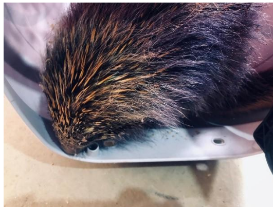
(53507) Ouriço cacheiro, ferido em propriedade. Proveniente de Bragança Paulista no dia 08/01/2025