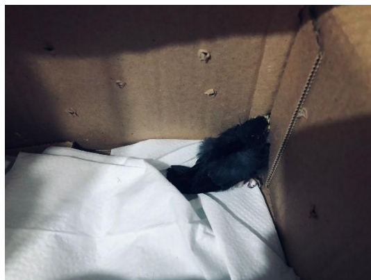
(53801) Andorinha, sem histórico. Proveniente pela Secretaria Municipal do Meio Ambiente de Bragança Paulista 21/01/2025