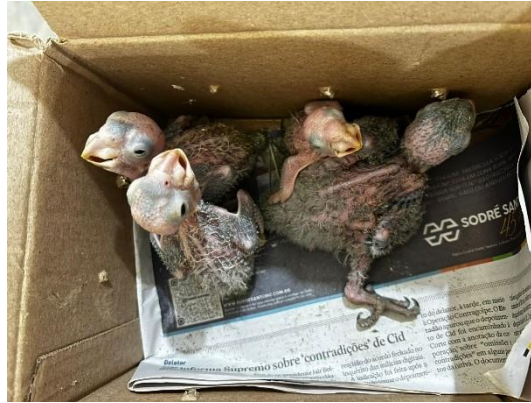
(53717 a 53720) Maritacas filhotes. Proveniente de Bragança Paulista e entregue para Associação Mata Ciliar de Bragança Paulista 18/01/2025