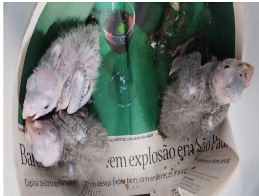
(53949-53950) Maritaca filhotes, caídas do ninho e entregue por SMMA de Bragança Paulista 30/01/2025