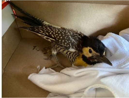
(53451) Pica pau do Campo, colisão com vidro. Proveniente de Bragança Paulista 06/01/2025