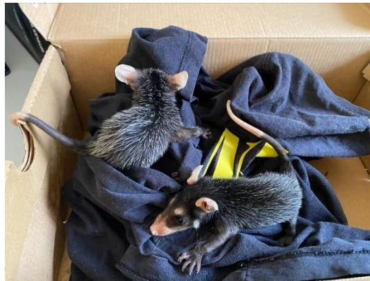
(53452 e 53452) GOB, encontrado em garagem. Proveniente de Bragança Paulista 06/01/2025