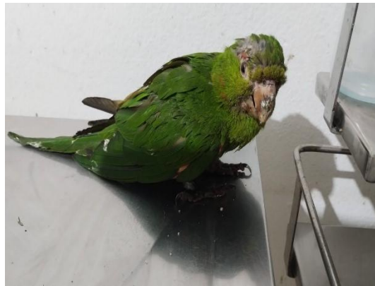
(53966) Maritacas, encontrada miíase em membros pélvicos e asa, trazidos de Bragança Paulista pela Associação Mata Ciliar 31/01/2025