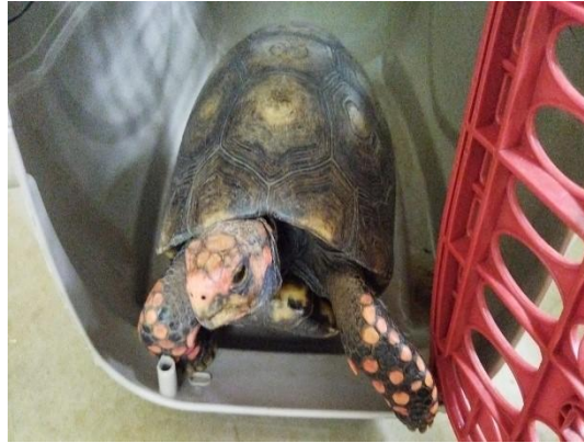
(53906) Jaboti Piranga, sem histórico. Proveniente da Secretaria do Meio Ambiente de Bragança Paulista 28/01/2025