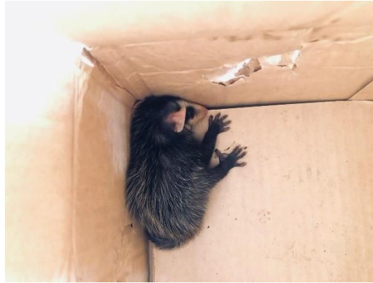
(53506) Gambá de orelha branca, encontrado caído no chão. Proveniente de Bragança Paulista no sai 08/01/2025