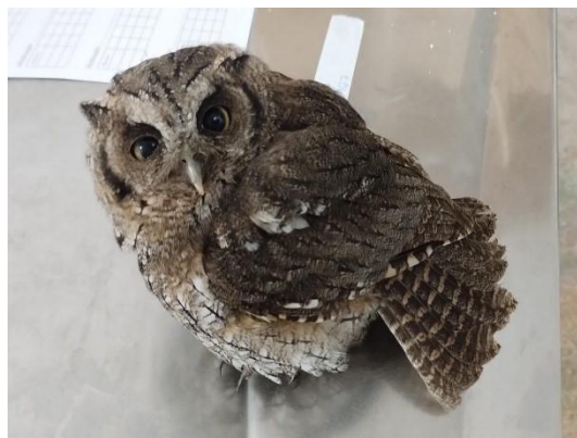
(53967) Coruja-do-mato, encontrada com fratura em asa, trazidos de Bragança Paulista pela Associação Mata Ciliar 31/01/2025