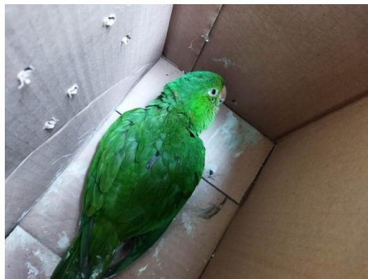
(53889) Maritaca debilitada. Proveniente de Bragança Paulista e entregue pela Associação Mata Ciliar 27/01/2025