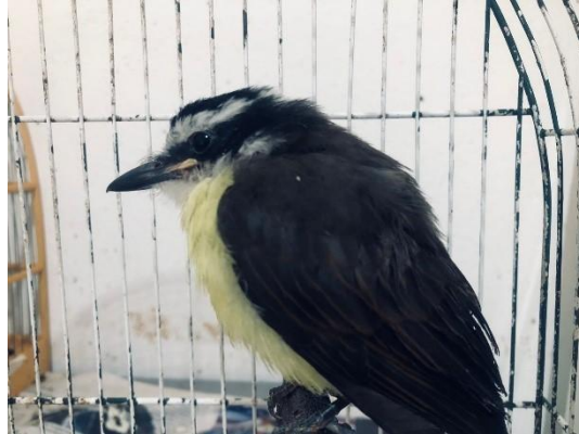
(53802) Bem-te-vi, nenhum com histórico. Proveniente pela Secretaria Municipal do Meio Ambiente de Bragança Paulista 21/01/2025