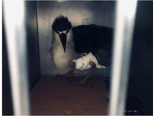
(53799) Socó, sem histórico. Proveniente pela Secretaria Municipal do Meio Ambiente de Bragança Paulista 21/01/2025