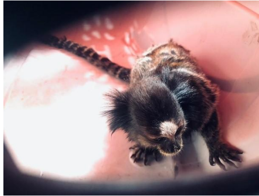
(53508) Sagui, encontrado ferido embaixo de veículo. Proveniente de Bragança Paulista no dia 08/01/2025