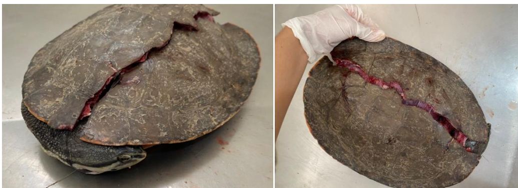
Chegada do Cágado-de-barbicha RG 1986 após atropelamento em Araçatuba.