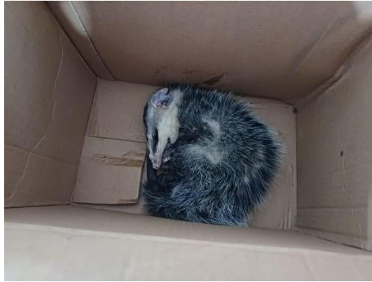
(49743) Gambá de orelha branca