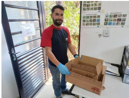
(49743) Gambá de orelha branca, encontrado se arrastando em empresa, entregue por munícipe de Itupeva no dia 18/07/2024