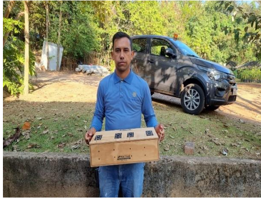
(49708) Cascavel, encontrada em condomínio, entregue por munícipe de Itupeva no dia 16/07/24