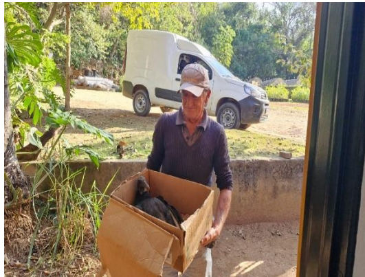
(49705) Urubu, atropelado em estrada, entregue por Prefeitura de Itupeva no dia 15/07/2024