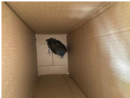
(52788) Sabiá, jovens, encontrados em escola, entregue por munícipe de Itupeva em 02-12-2024