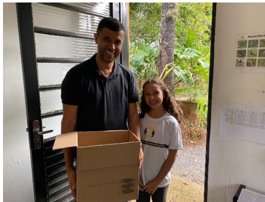
(52846 ao 52848) Quatis, filhotes encontrados em rodovia com mãe atropelada em óbito, entregues por munícipe de Itupeva, no dia 04-12-24