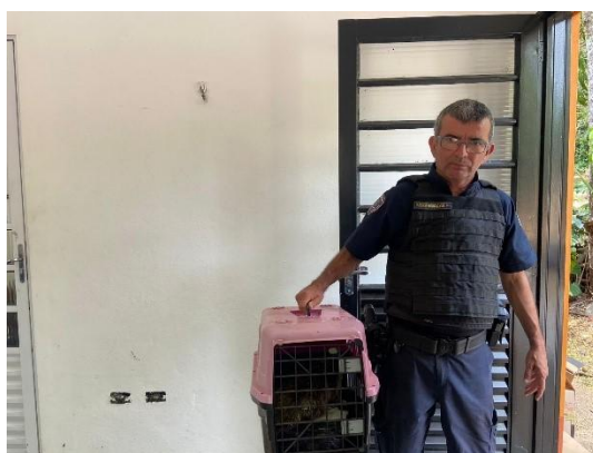
(52784) Ouriço-cacheiro, atropelado, entregue por Guarda Municipal Itupeva em 02-12-2024