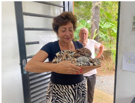
(52855) Coruja-do-mato, animal filhote encontrado em quintal, entregue por município de Itupeva, no dia 05-12-24