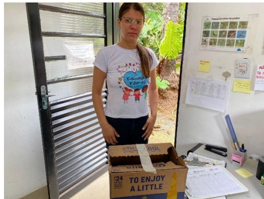
(52918) Asa-branca, animal encontrado machucado e foi levado pra atendimento veterinário, trazido por munícipe de Itupeva, no dia 09-12-24