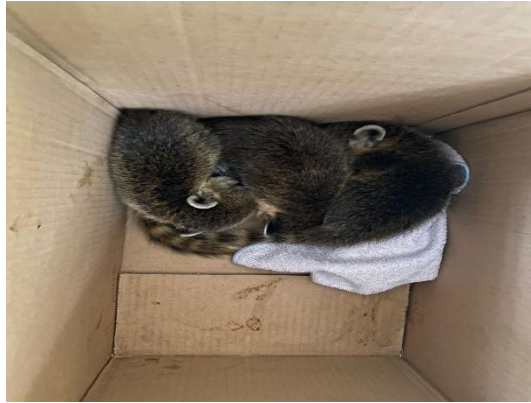
(52846 ao 52848) Quatis