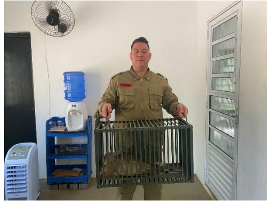
(52893) Seriema, animal atropelado, entregue por Guarda Municipal de Itupeva, no dia 07-12-24