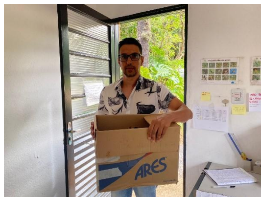
(52899) Gambá-de-orelha-branca, filhote encontrado em residência sozinho, entregue por munícipe de Itupeva, no dia 07-12-24