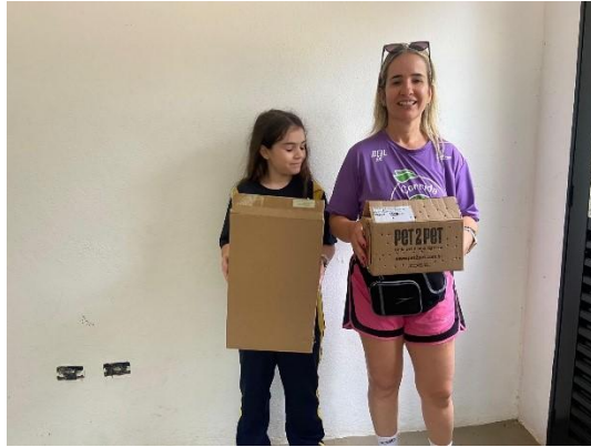
(52787) Andorinha, jovens encontradas em escola, entregue por munícipe de Itupeva em 02-12-2024