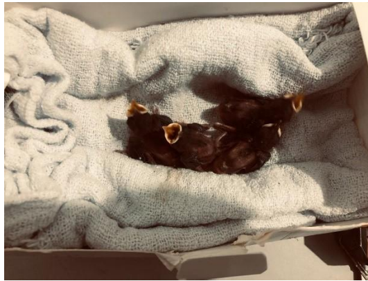
(52586 ao 52589) Passeriforme