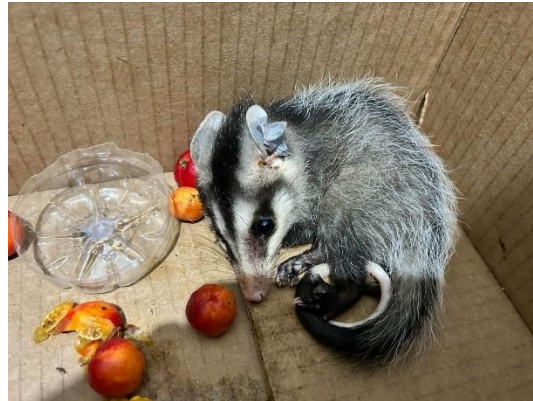
(52368) Gambá de orelha branca