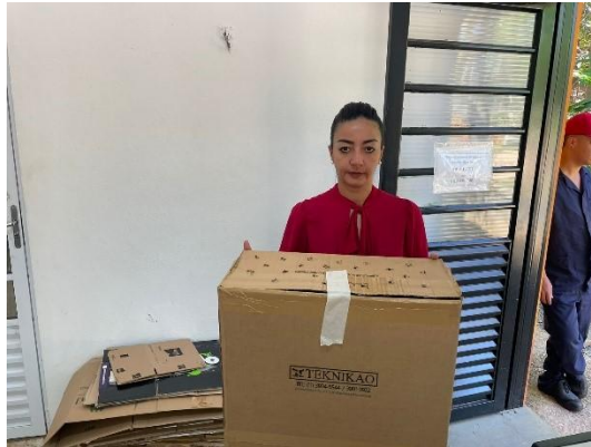
(52265) Papagaio, encontrado dentro de empresa, entregue por munícipe de Itupeva em 12-11-2024