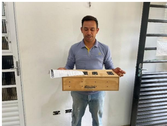
(52130) Jiboia, encontrado em condomínio, entregue por município de Itupeva em 05-11- 2024