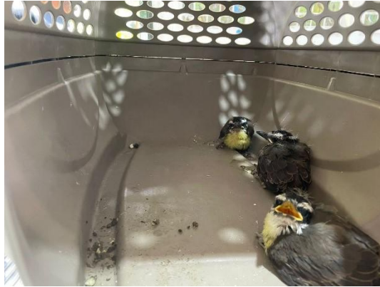
(52650-52652) Bem te vi