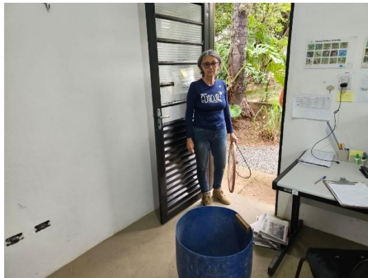
(52731) Gambá de orelha preta, atropelado, entregue por município de Itupeva em 29-11-2024