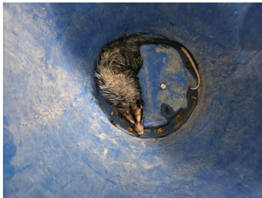
(52731) Gambá de orelha preta