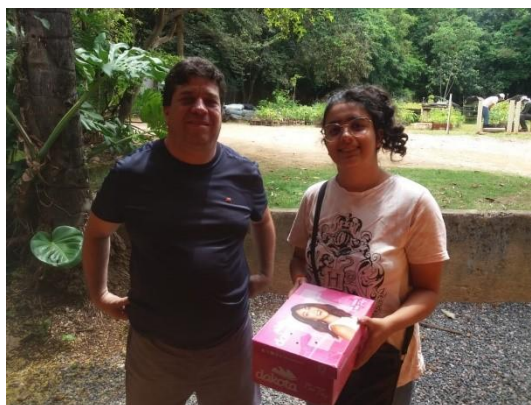
(52756) Bem te vi, encontrado caído sem agredido por outras aves, entregue por município de Itupeva em 30-11-2024