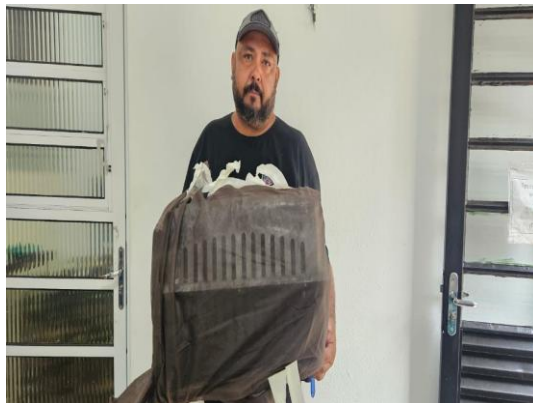
(52466) Macaco prego, abandonado em escola pública, animal domesticado, entregue por município de Itupeva em 21-11-2024