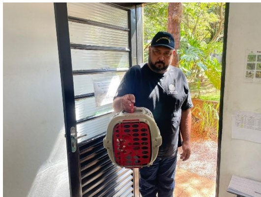
(52650-52652) Bem te vi, caíram do ninho, entregues pela prefeitura de Itupeva em 26-11-2024