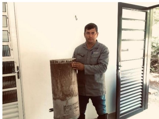
(52397) Jararaca, encontrada após ser ferida por roçadeira, entregue por munícipe de Itupeva em 18-11-2024