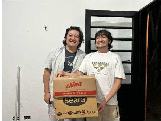
(52368) Gambá de orelha branca, filhote, atacado por gato, entregue por munícipe de Itupeva em 15-11-2024