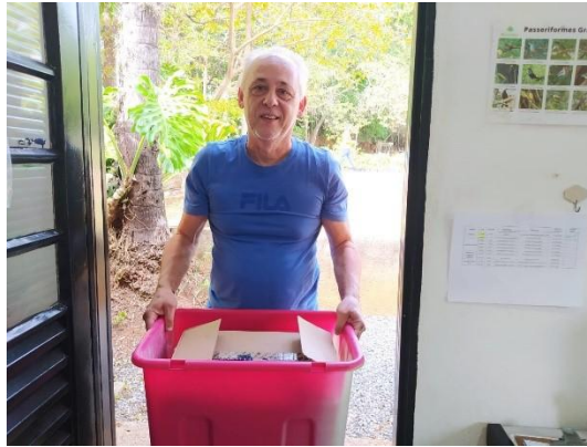
(52054) Ouriço-cacheiro, encontrado em via pública com ferida na pata, entregue por município de Itupeva em 02-11-2024