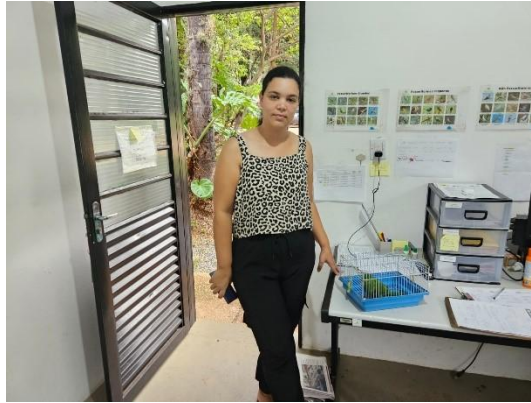
(52732) Maritaca, entregue por município de Itupeva em 29-11-2024