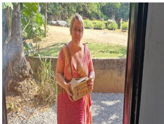
(49963) Rolinha, filhote, encontrada em rodoviária, entregue por munícipe de Itupeva em 20-08-2024