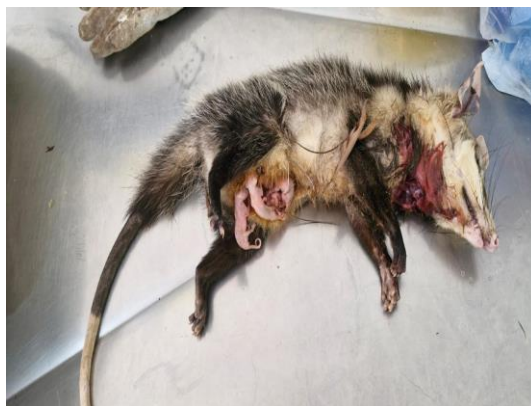
(50011) Gambá-de-orelha-branca e neonatos (50012 a 50020)