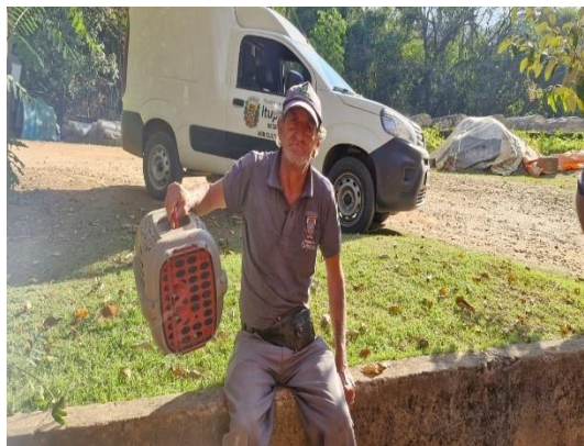
(50011) Gambá-de-orelha-branca, fêmea, atacada por cão e em óbito, com neonatos (50012 a 50020) em marsúpio. Entregue pela Prefeitura de Itupeva em 22-08-2024