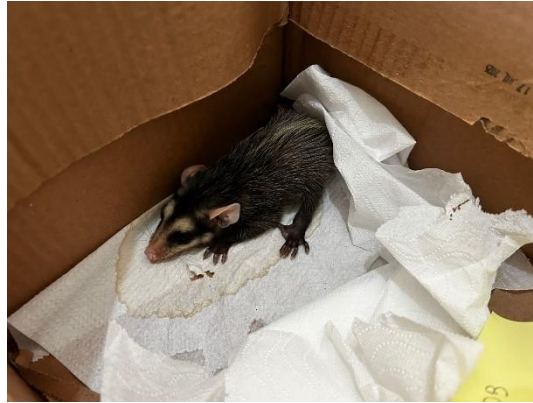
(50907) - gambá de orelha branca