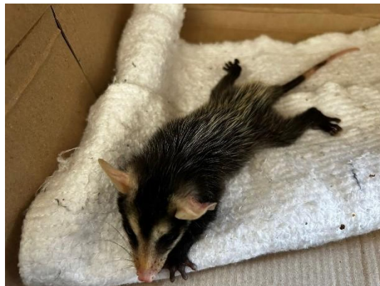
(51514) Gambá de orelha branca.