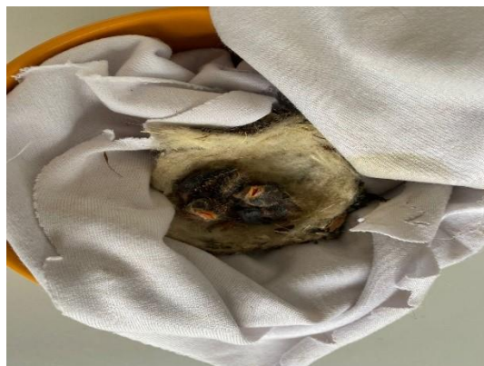
(51716 e 51717) Passariformes, filhotes.