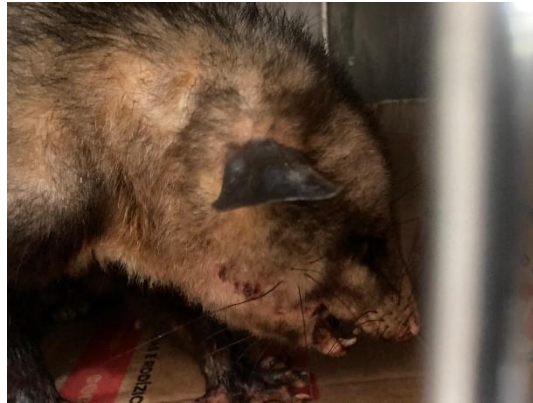
(50941) Gamba de orelha preta.

(50941) Gamba de orelha preta, eletrocutado e (50942) Jacu, encontrado em quintal de residência entregues pela GCMA de Itatiba no dia 02-10-2024.