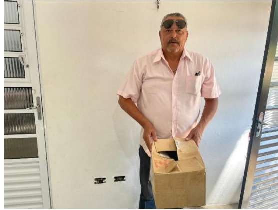
(51981) Pica-pau, animal encontrado caído no chão e entregue por representante da GMA de Itatiba, no dia 30-10-24