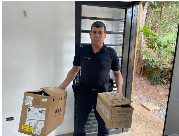
(52011) Pica-pau-verde-barrado, animal chegou em óbito e (52012) Gambá-de-orelha-branca, animal sofreu ataque de cão, entregues por GM de Itatiba, no dia 31-10-24