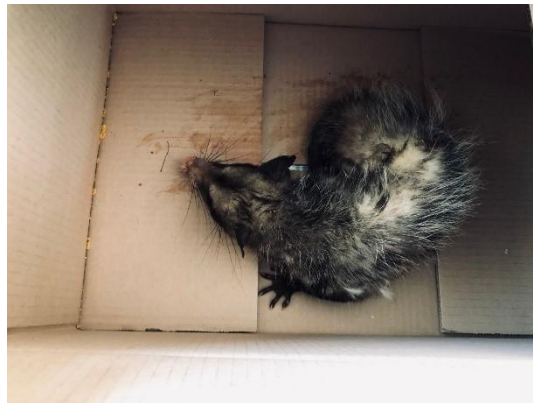
(51118) Gambá de orelha preta.