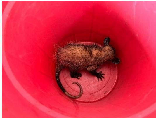
(51356) Gambá de orelha preta.