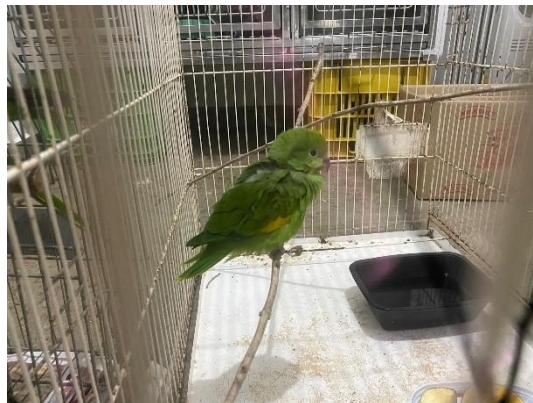
(51467) Periquito de encontro amarelo.