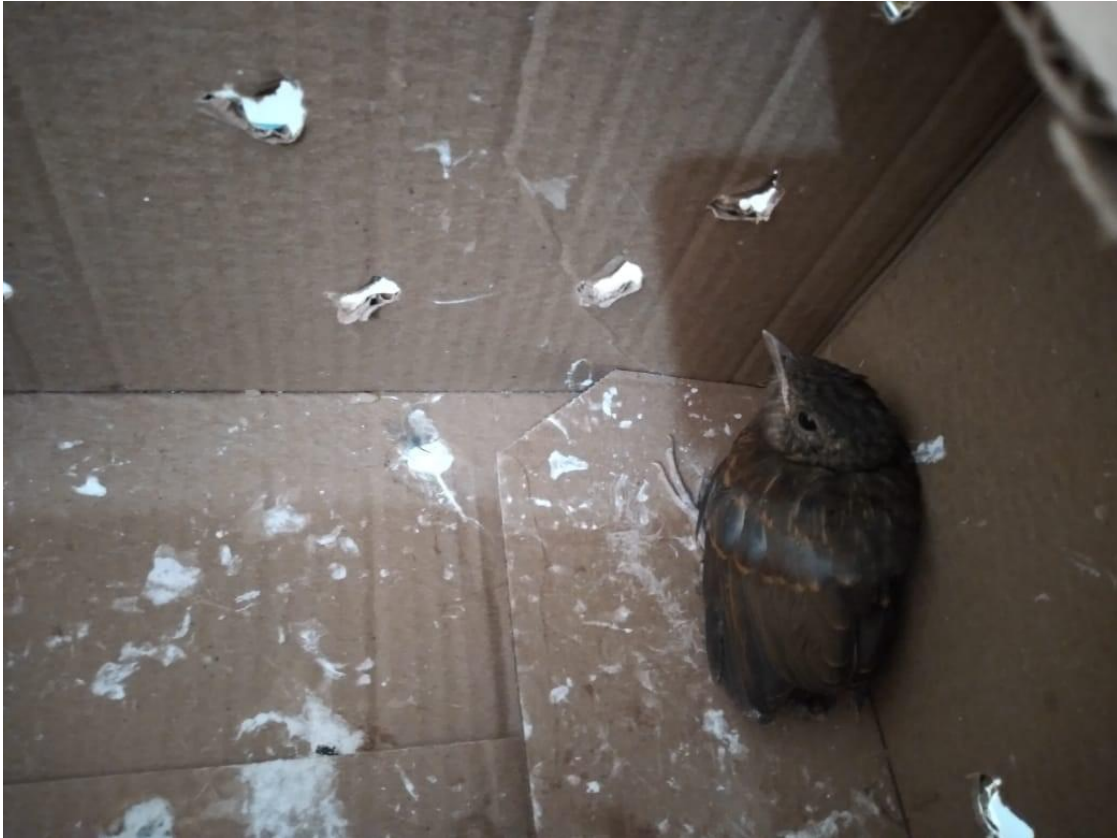
(51069) Sabiá, filhote.