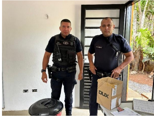
(51356) Gambá de orelha preta, adulto, vítima de atropelamento e (51356) Gambá de orelha preta. Entregues pela GCM de Itatiba no dia 12-10-2024.