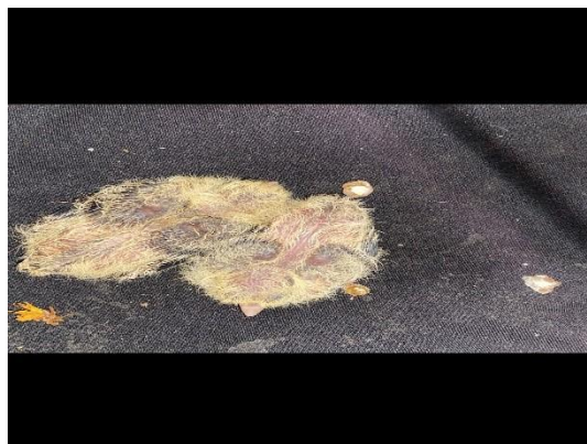
(51422 e 51423) Columbiformes, filhotes.