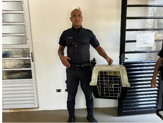
(51507) Gato do mato pequeno, sofreu ataque de cão. Entregue pela GCM de Itatiba no dia 15-10-2024.