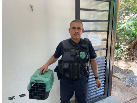
(51950) Sagui, animal caído em beira de calçada. Entregue pela GM de Itatiba, no dia 29-10-2024.