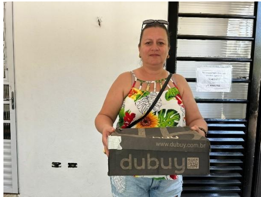
(51514) Gambá de orelha branca, encontrado na sala de casa. Entregue por munícipe de Itatiba no dia 15-10-2024.