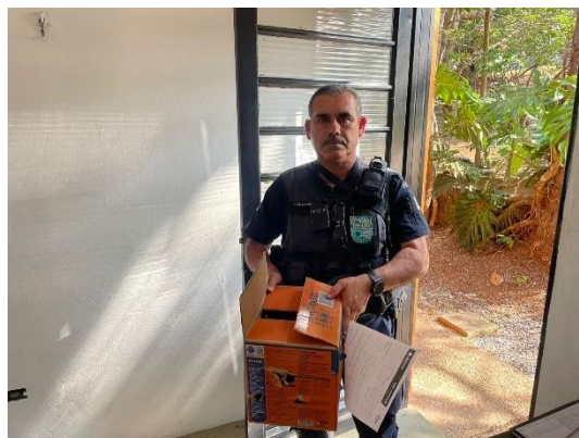
(51963) Pica-pau-verde, encontrado caído na rua. Entregue pela GM de Itatiba no dia. 29-10-2024.