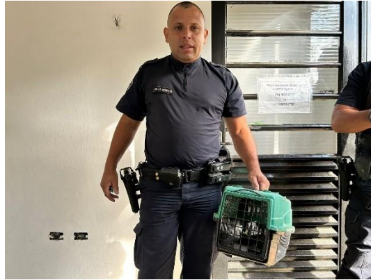
(51397) Maritaca, adulta, encontrado em residência sendo atacada por gatos. Entregues pela GCM de Itatiba no dia 12-10-2024.