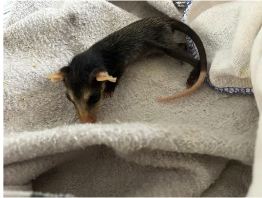
(51000) Gambá, filhote.