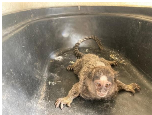
(50915) sagui de tufo preto.