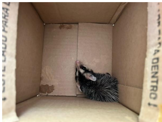
(51357) Gambá de orelha branca.