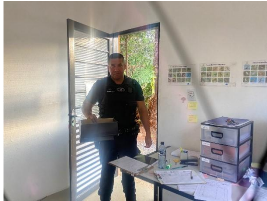
(51422 e 51423) Columbiformes, filhotes, encontrados em quintal de residência. Entregues pela GCM de Itatiba no dia 13-10-2024.