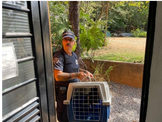
(51582) Carcará, animal encontrado em quintal. Entregue pela GM de Itatiba no dia 16-10-2024.