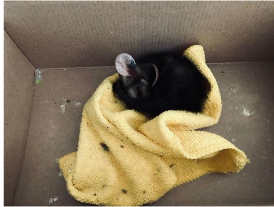
(51117) Gambá de orelha branca.