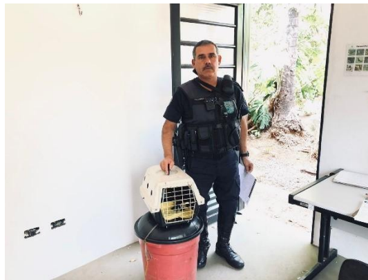
(51117) Gambá de orelha branca, animal encontrado sozinho e (51118) Gambá de orelha preta, sofreu ataque de cão. Entregues pela GM de Itatiba no dia 07-10-2024.