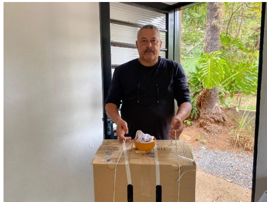
(51716 e 51717) Passariformes, filhotes, caíram do ninho e (51718) Socó, encontrado machucado próximo a lago. Entregues pela GMA de Itatiba, no dia 21-10-2024.