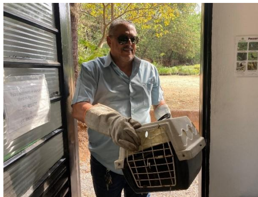
(50915) sagui de tufo preto, caído na rua. Entregue pela GMA de Itatiba no dia 01-10-24.