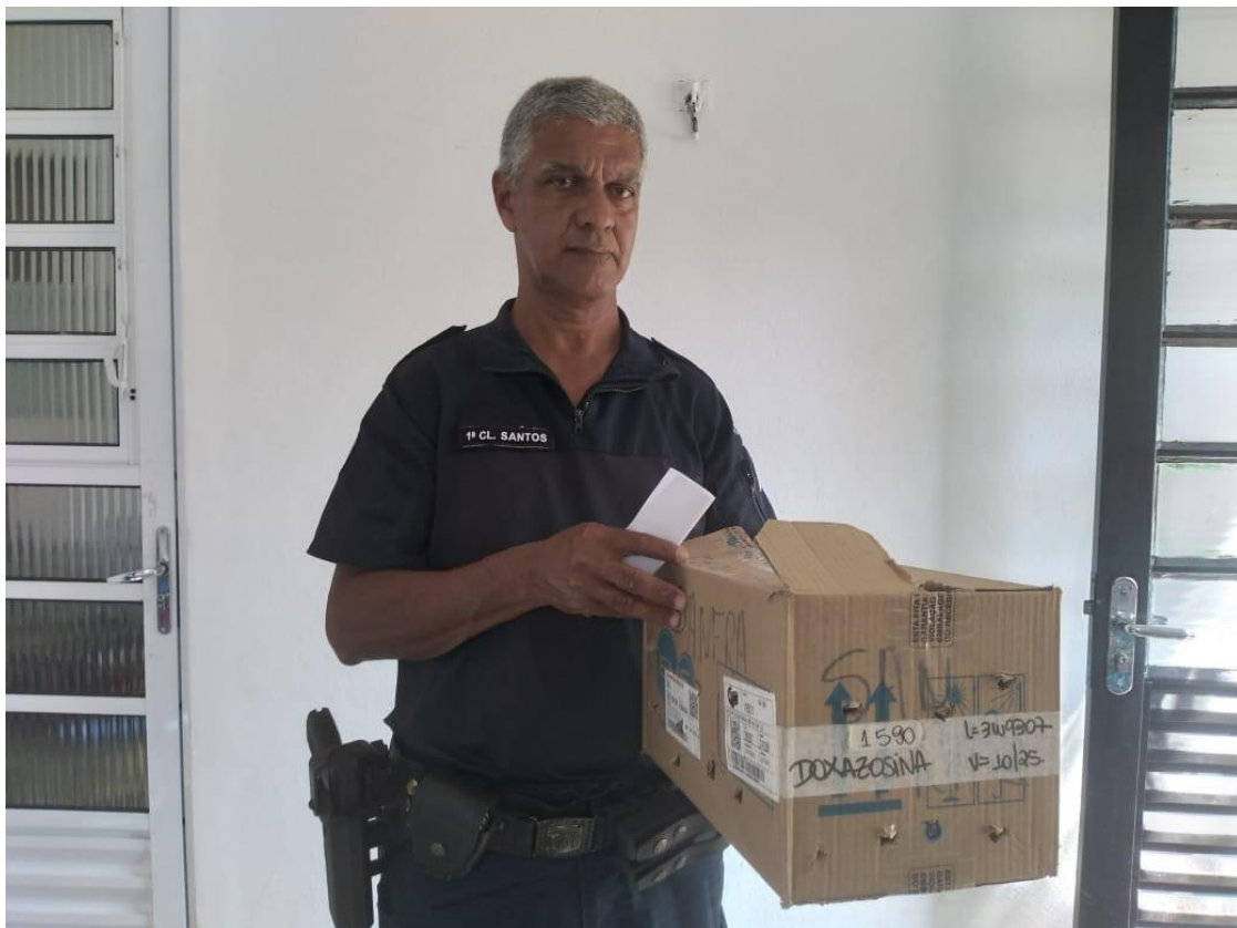
(51069) Sabiá, filhote, encontrado em via pública – entregue pela GM de Itatiba no dia 05-10-2024.