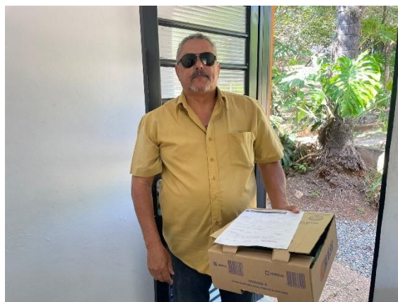
(52001) Avoante, animal encontrado em residência e entregue por GMA de Itatiba, no dia 21-10-24