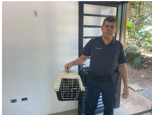
(51974) Gambá de orelha preta, encontrado na calçada debilitado. Entregue pela GMA de Itatiba, no dia 30-10-2024.