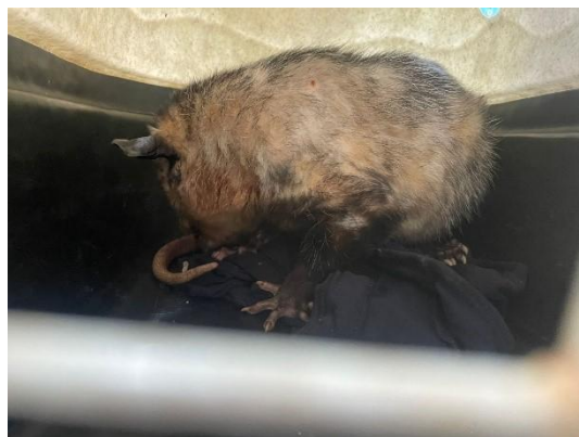
(51974) Gambá de orelha preta.