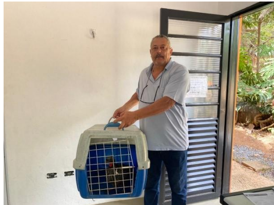
(51755) Jacu, suspeita de atropelamento, entregue pela GMA de Itatiba, no dia 22-10-2024.