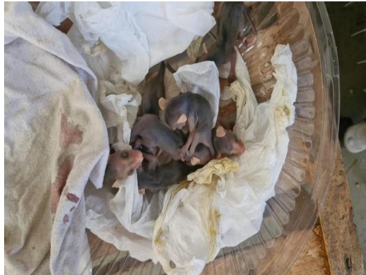
(49822 a 49832) – Gambás