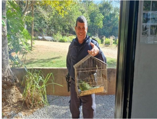
(49900) Maritaca, adulta, encontrada sem voar, entregue pela Guarda Civil Municipal de Itatiba em 13-08-2024