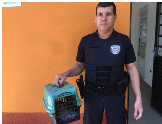
(49925) Sagui, filhote, encontrado dentro de empresa. Entregue pela Guarda Municipal Ambiental de Itatiba em 15-08-2024