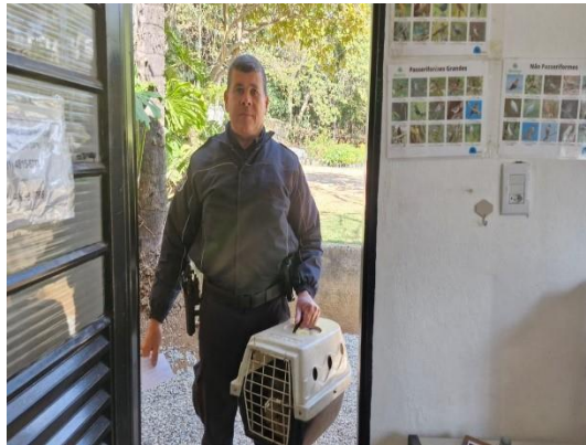
(49898) Gambá-de-orelha-preta observado há dois dias, apático. Entregue pela Guarda Civil Municipal de Itatiba em 13-08-2024