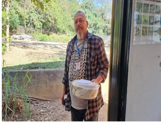
(49822 a 49832) - Gambás, filhotes, encontrados em marsúpio de mãe morta por atropelamento, entregues pela Prefeitura de Itatiba em 02-08-2024