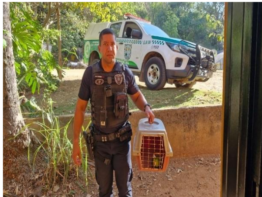
(49839) Maritaca encontrada apática e sem voar, entregue pela Guarda Civil Municipal de Itatiba em 05-08-2024