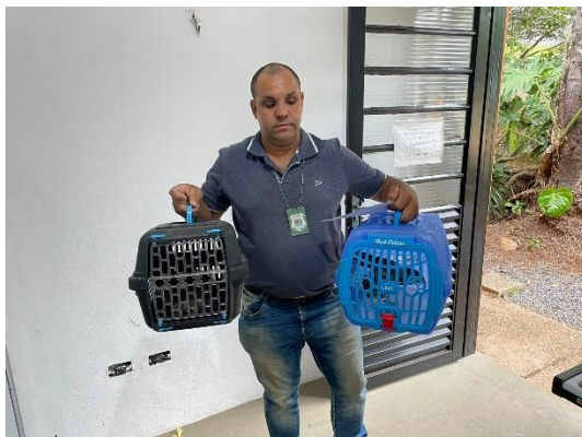
(52483) Gavião peregrino, sem histórico e (52484) Jabuti piranga, animal encontrado em trilho, animais entregues pela prefeitura de Indaiatuba em 22-11-2024