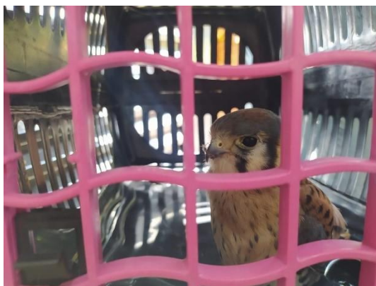
(52618) Quiri- quiri