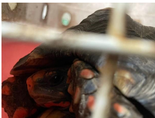
(52484) Jabuti piranga