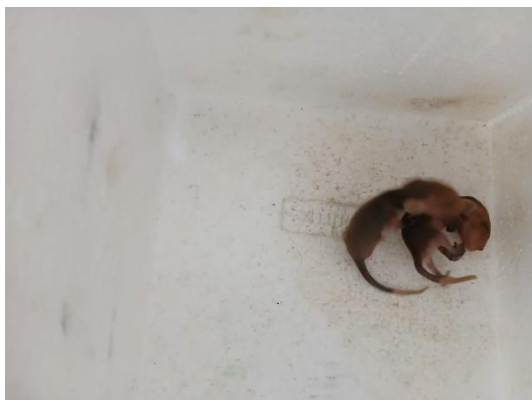
(52644-52645) Gambás de orelha branca