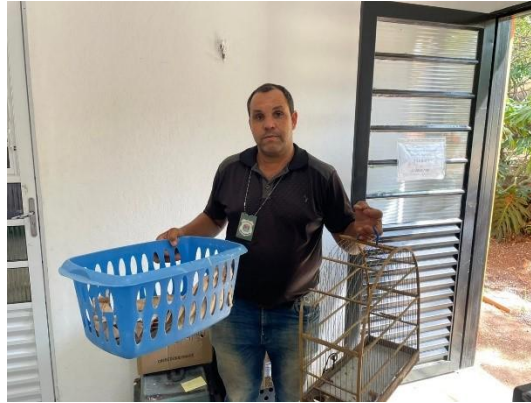
(52040) Tatu, animal atropelado e (52041) Sabiá, atacado por gato, animais entregues pela prefeitura de Indaiatuba em 01-11-2024