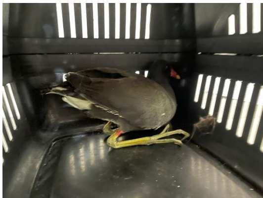
(52268) Galinha d'água