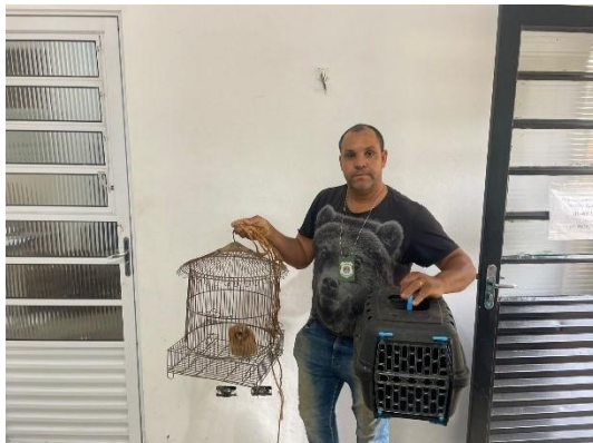
(52743) Coruja buraqueira, encontrado na rua e (52744) Passeriforme, sem histórico, entregue pela prefeitura de Indaiatuba em 30-11-2024