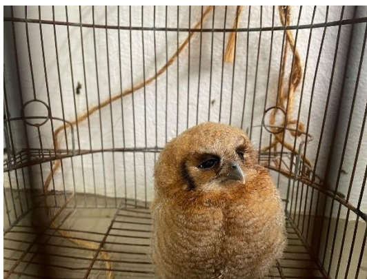
(52743) Coruja buraqueira