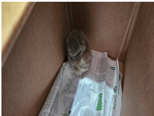
(52647) Coruja do mato