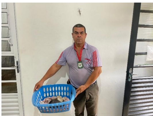
(52369) Tatu-galinha, encontrado ferido na avenida, entregue pela Secretaria de Meio Ambiente de Indaiatuba em 16-11-2024