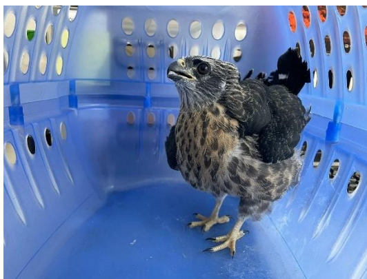
(52483) Gavião peregrino