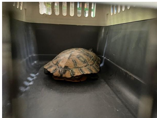
(52161) Tigre d'água