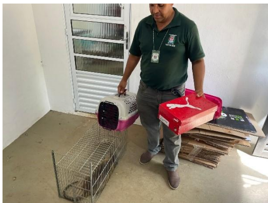
(52278) Gambá de orelha branca, (52280) Ratão do banhado e (52279) Bacarau, animais sem histórico, entregues pela Prefeitura de Indaiatuba em 12-11-2024