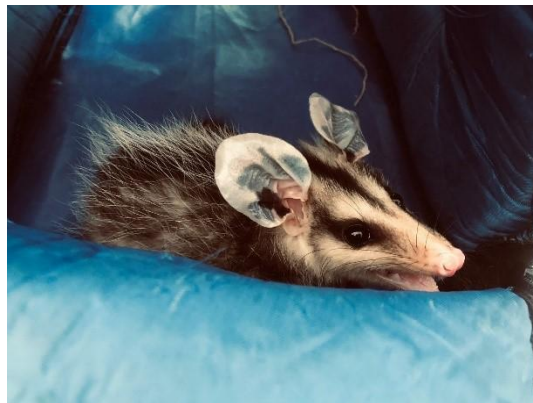
(52398) Gambá de orelha branca