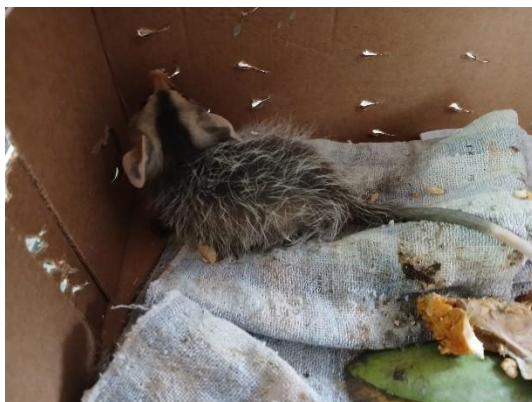
(52648) Gambá de orelha branca