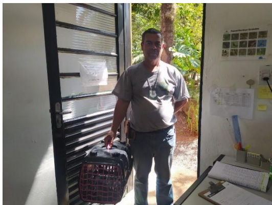
(52618) Quiri- quiri, animal encontrado em via pública, entregue pela MA Indaiatuba em 25-11-2024