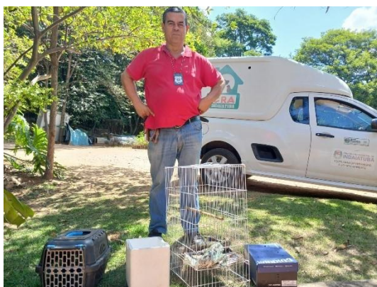
(52643) Teiú, provavelmente atropelado, (52644-52645) Gambás de orelha branca, encontrados no chão, (52646) Andorinha, encontrado em empresa, (52647) Coruja do mato, encontrado sem voar na rua, (52648) Gambá de orelha branca, encontrado na rua e (52649) Pardal, encontrado na rua sem voar, entregues pela Gestão Ambiental de Indaiatuba em 26-11-2024