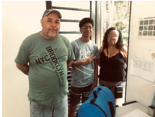
(52398) Gambá de orelha branca, filhote, encontrado em residência, entregue por município de Indaiatuba em 18-11-2024