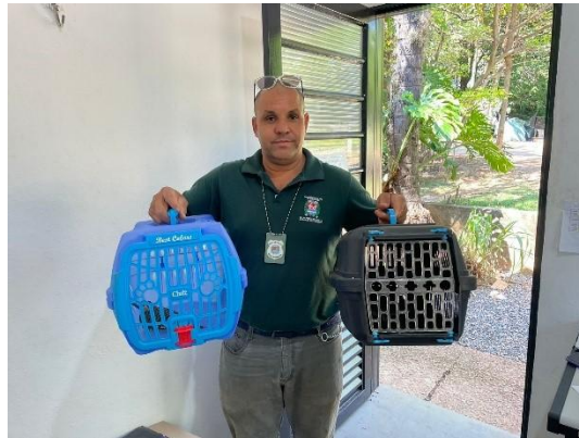
(52267) Pica-pau, animal encontrado em tronco de árvore queimada e (52268) Galinha d'água, encontrado ferido em condomínio, animais entregues por Prefeitura de Indaiatuba em 12-11-2024