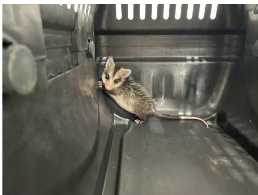
(51302) Gambá de orelha branca