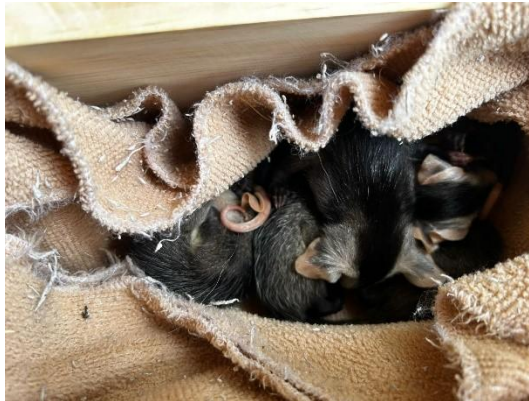
(51648-51652) Gambá de orelha branca