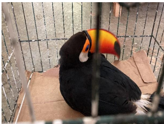
(50917) Tucano toco