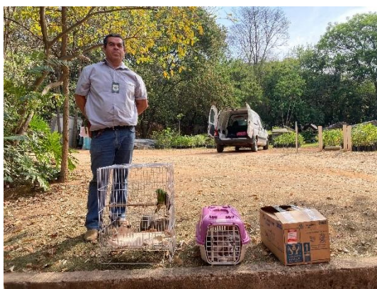
(50916) Maritaca, encontrada com lesão em asa esquerda e (50917) Tucano toco, encontrado em rodovia. Entregues pela Secretaria do Meio Ambiente de Indaiatuba no dia 01-10-24