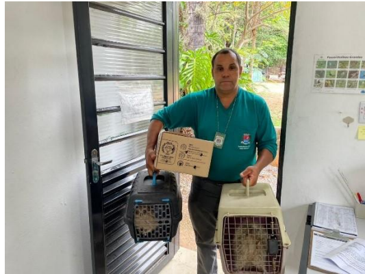
(51863-51864) Corujas-do-mato, (51865) Ouriço-cacheiro e (51866) Maritaca, animais sem histórico e entregues pela prefeitura de Indaiatuba, no dia 25-10-24