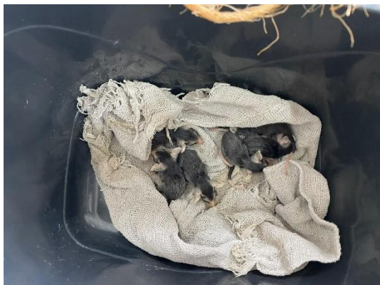
(51296-51301) Gambás de orelha branca