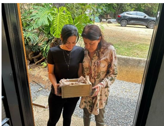
(51648-51652) Gambá de orelha branca, animais órfãos. Entregues por município de Indaiatuba no dia 18-10-2024