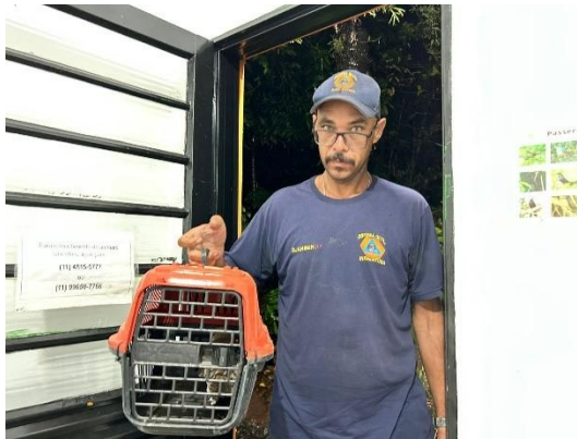
(51847) Quero-quero, adulto, encontrado em pátio de faculdade de medicina veterinária com histórico de fratura exposta. Entregue pela Defesa Civil de Indaiatuba no dia 24-10-2024