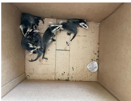
(51614-51620) Gambá de orelha branca