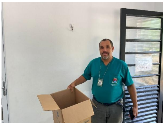
(51614-51620) Gambá de orelha branca, animais órfãos encontrados em distrito industrial. Entregues pela prefeitura de Indaiatuba no dia 17-10-2024