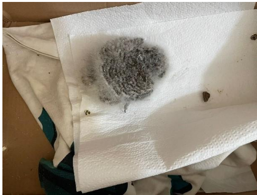
(51957) Coruja, animal sofreu ataques de gato. Entregue pela Prefeitura de Indaiatuba no dia 29-10-2024