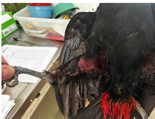
(50917) Tucano toco