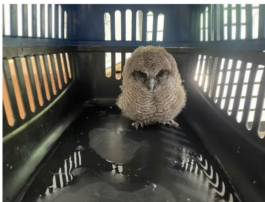
(51959) Coruja, animal sofreu ataques de gato. Entregue pela Prefeitura de Indaiatuba no dia 29-10-2024