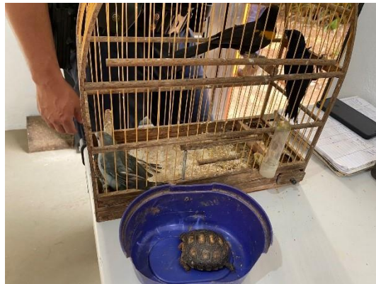
(49662) Chopim, (49663) Sanhaço Cinzento, (49664) Encontro, (49665) Jabuti Piranga