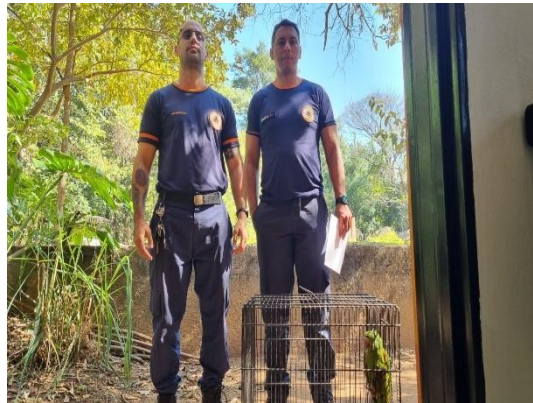
(49748) Maritaca, encontrada em residência com dorso sem penas e machucado, entregue por Defesa Civil de Campo Limpo Paulista no dia 19/07/2024