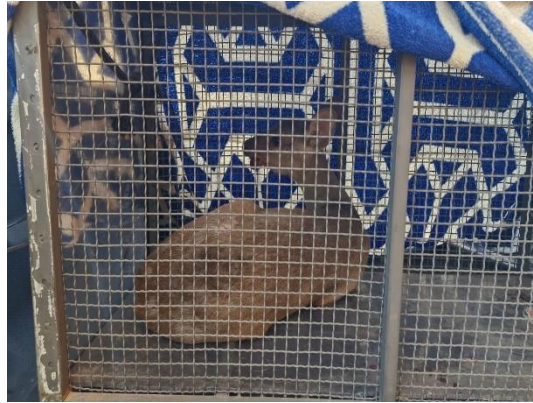
(49741) Veado catingueiro