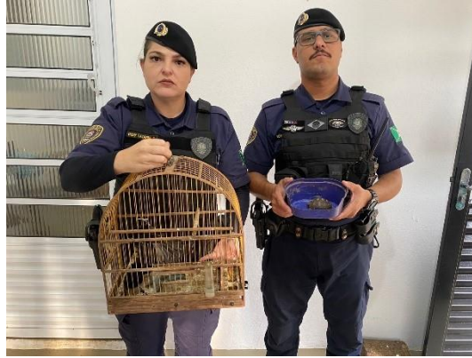
(49662) Chopim, (49663) Sanhaço Cinzento, (49664) Encontro, (49665) Jabuti Piranga, animais de apreensão, entregues por GCM Campo Limpo no dia 05/07/2024