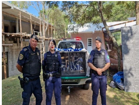
(49741) Veado catingueiro, encontrado na garagem da prefeitura, enroscado em alambrado, resgatado por GCM de Campo Limpo Paulista no dia 18/07/2024