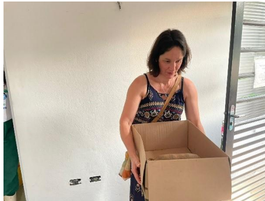
(50713) - Jabuti, animal encontrado na beira de rodovia, entregue por Munícipe de Campo Limpo Paulista em 24/09/2024