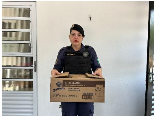
(50395), maritaca adulta, animal extremamente dócil encontrado em residência sem conseguir voar. Entregue pela GCM de Campo Limpo Paulista em 15/09/2024