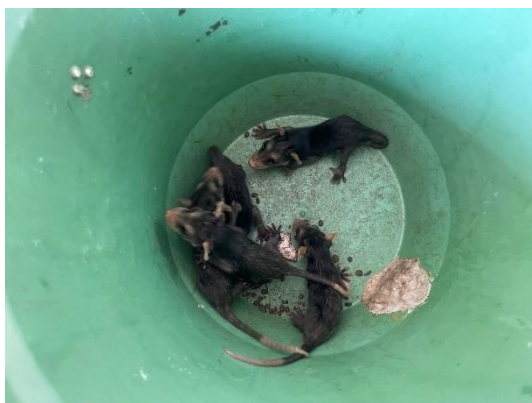
(50727-50731) – Gamba-de-orelha-branca