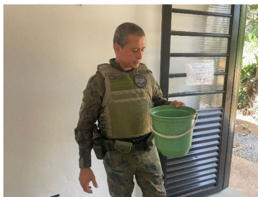
(50727-50731) – Gamba-de-orelha-branca, sem histórico entregue por GCM de Campo Limpo Paulista em 25/09/2024