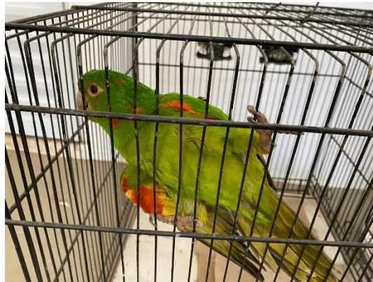
(50469) – Maritaca