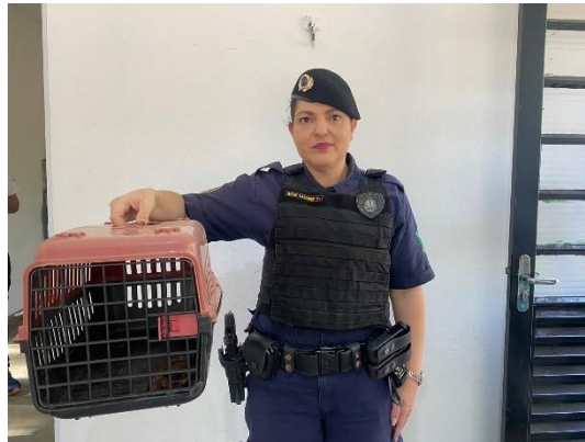
(50327) Bacarau, encontrado dentro da prefeitura. Entregue pela GCM de Campo Limpo Paulista em 11/09/2024