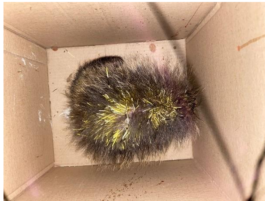
(50482) - Ouriço-cacheiro