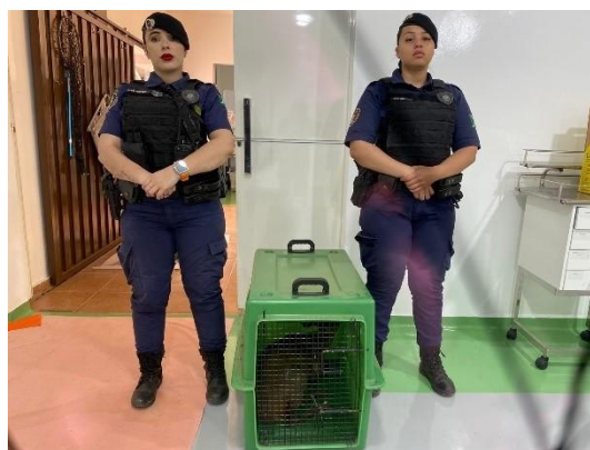
(50293) Veado-catingueiro, adulto, encontrado sendo atacado por cães, possível prenhez. Entregue pela GCM de Campo Limpo Paulista em 10/09/2024