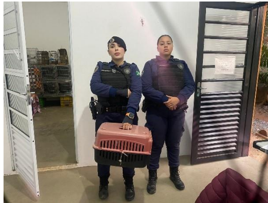
(50482) - Ouriço-cacheiro, encontrado em ponte com olho esquerdo saltado para fora. entregue pela GCM de Campo Limpo Paulista em 18/09/2024