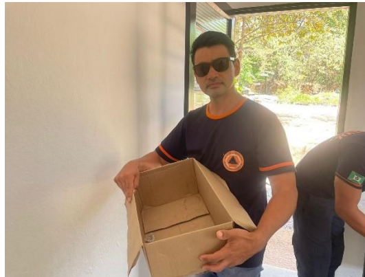
(50726) – Gamba -de-orelha-branca, animal órfão sem histórico, entregue por DC Campo Limpo Paulista em 25/09/2024