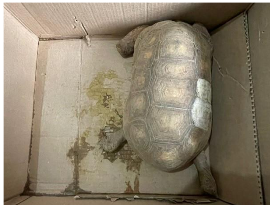
(50713) – Jabuti