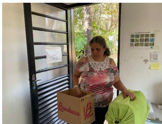
(50660-50672) – filhotes de Gambá-de-orelha-branca, animais encontrados em via pública, entregue por Município de Campo Limpo Paulista em 24/09/2024