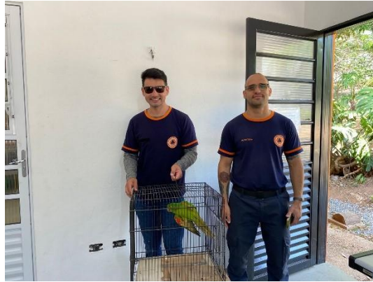
(50469) - Maritaca encontrada em residência caída com a asa sangrando, trazida pela Defesa Civil de Campo Limpo Paulista em 18/09/2024