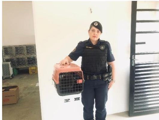
(50245) Ouriço-cacheiro, encontrado em chácara. Entregue pela GCM de Campo Limpo Paulista em 07/09/2024