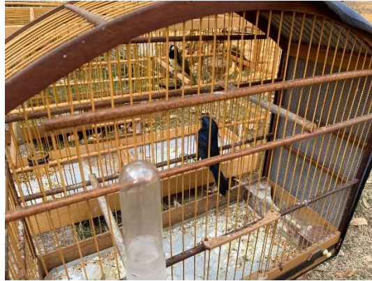
(50359) Azulão macho