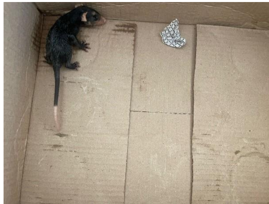
(50726) – Gamba -de-orelha-branca