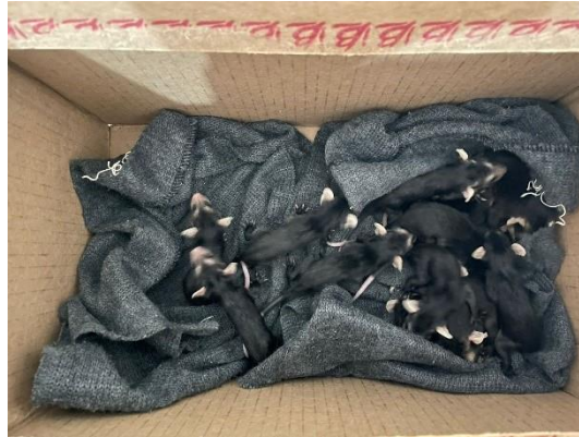
(50660-50672) – filhotes de Gambá-de-orelha-branca