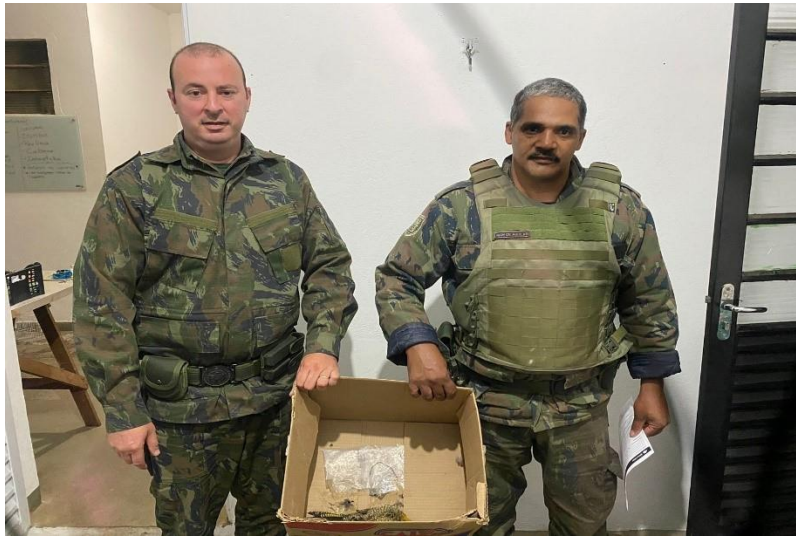
(49675) Pica pau do campo, animal encontrado na rua com plástico e arame enrolado, chegou em óbito, entregue por GCM de Cajamar no dia 08/07/24