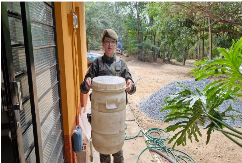
(49660) Jararaca, animal apresenta ferida no corpo, entregue por GCM de Cajamar no dia 05/07/2024