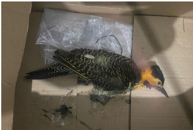
(49675) Pica Pau do campo