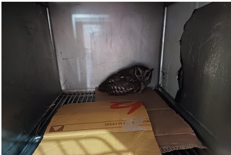
(49762) Corujinha do mato