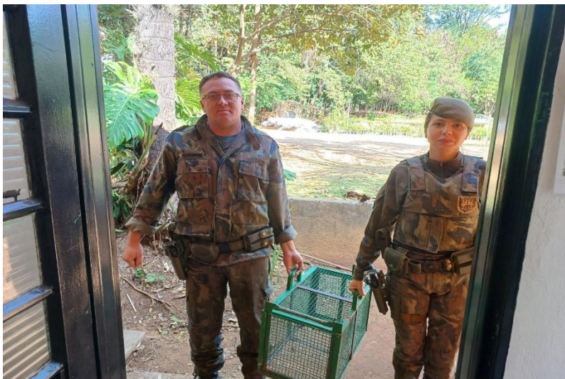
(49703) Carcará adulto, animal encontrado na avenida andando e sem voar, entregue por GM de Cajamar no dia 15/07/2024