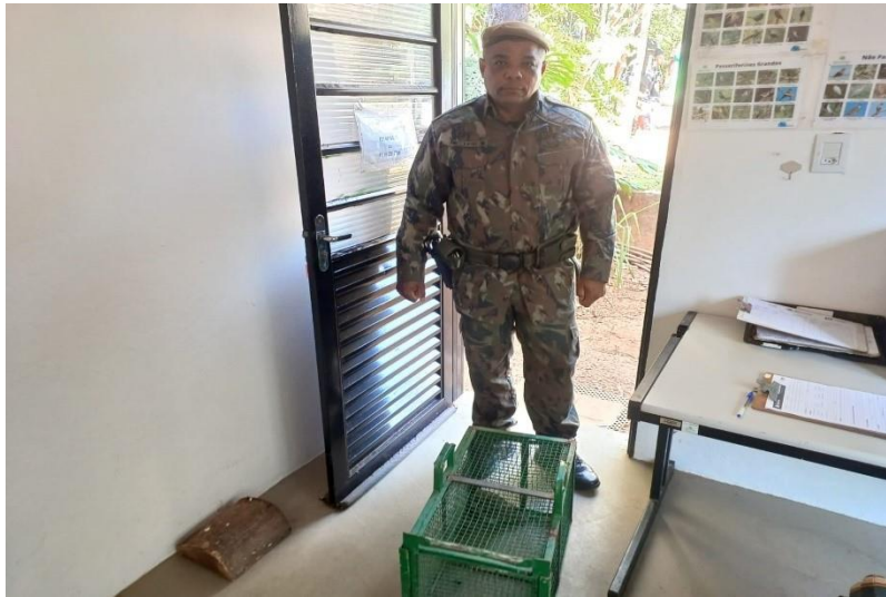
(49762) Corujinha do mato, encontrado por munícipe com asa machucada e sem voar, entregue por GM de Cajamar no dia 22/07/2024