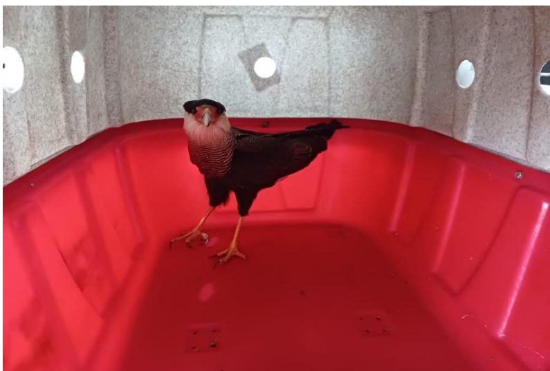
(49703) Carcará adulto