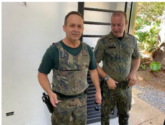
(52593) Pardal, encontrado preso em armadilha de cola, entregue pela GCM Cajamar em 25-11-2024