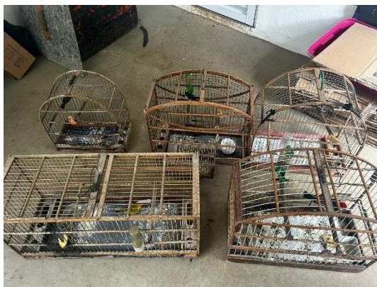
Canário da terra (52359), bigodinho (52360), coleirinhos (52361 e 52362) e cardeal do nordeste (52363)