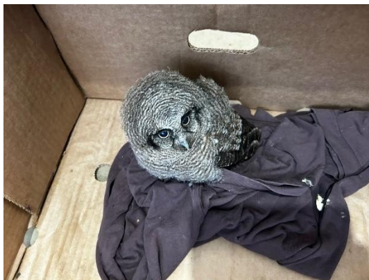
(52367) Corujinha do mato