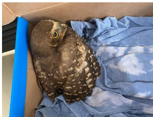
(52469) Coruja buraqueira