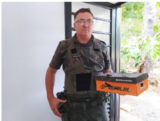
(52057) Asa-branca, animal encontrado com lesão na asa, entregue por GM Cajamar em 02-11-2024