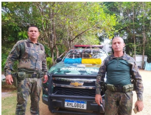
(52059) Coleirinho e (52060 e 52061) Canários da terra, apreensão da GCM Cajamar em 02-11-2024