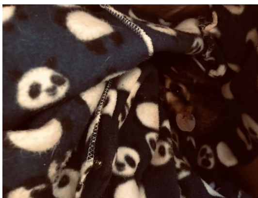
(52419) Gambá de orelha branca