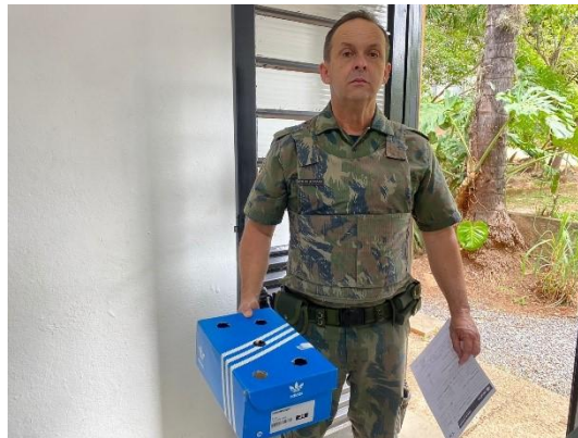
(52469) Coruja buraqueira, animal encontrado caído no chão, entregue por GM Cajamar em 21-11-2024