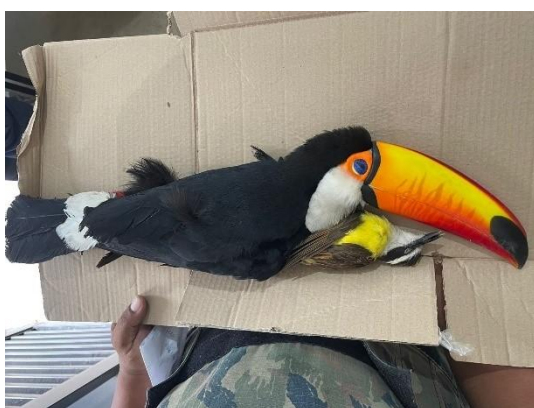
(52147) Tucano-toco e (52148) bem te vi