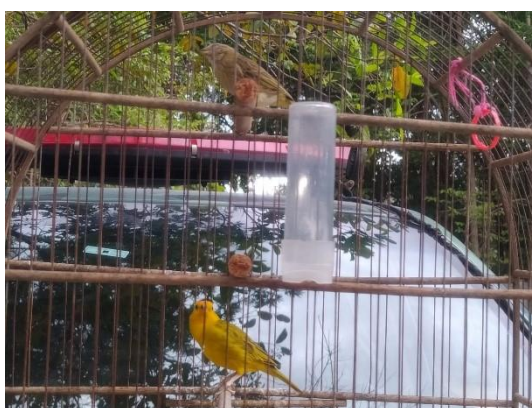
(52060 e 52061) Canários da terra