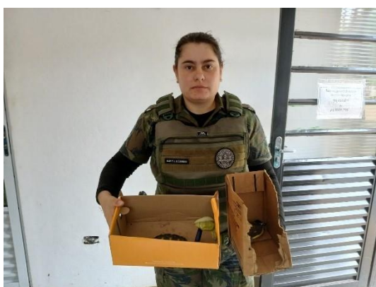
(52691) Bem-te-vi, jovem, encontrado em residência sem voar e (52692) Jabuti, entrega voluntária para a GM, animais entregues por GM Cajamar em 28-11-2024