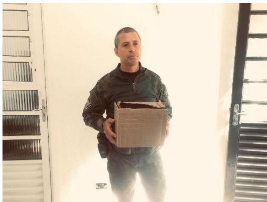
(52404) Gambá de orelha branca, filhote, encontrado por munícipe e cuidado por 1 mês, entregue por GCM Cajamar em 18-11-2024