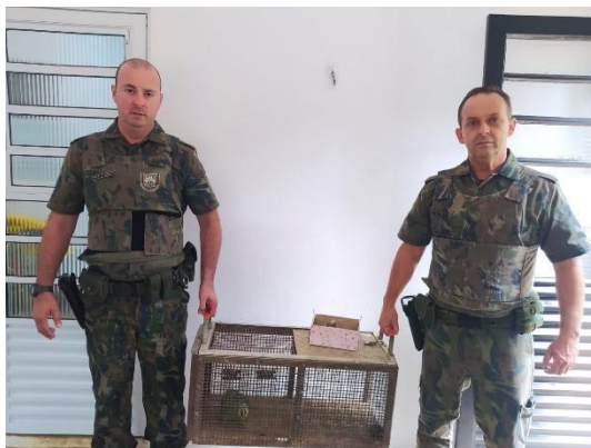
(52090) Papagaio-do-mangue, encontrado em residência, entregue por GCM Cajamar em 03-11-2024