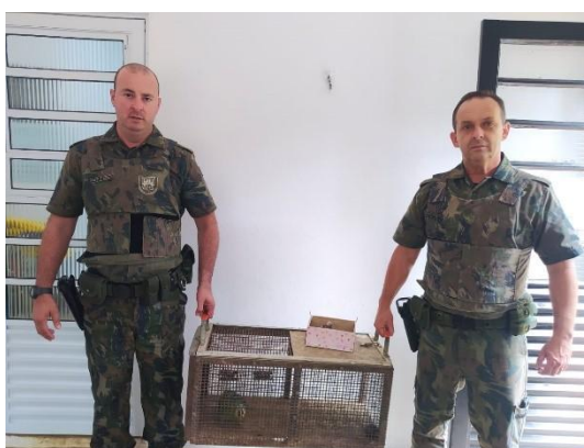
(52091) Gambá-de-orelha-branca, filhote, encontrado em residência, entregue por GCM Cajamar 03-11-2024