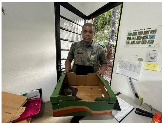
(52367) Corujinha do mato, filhote, atacada por gato, entregue por GCM Cajamar 15-11-2024