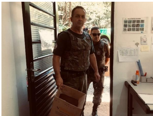
(52419) Gambá de orelha branca, encontrado em quintal ao lado da mãe morta que sofreu ataques de cão, entregue pela GCM Cajamar em 19-11-2024