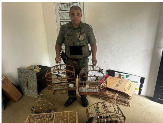
Canário da terra (52359), bigodinho (52360), coleirinhos (52361 e 52362) e cardeal do nordeste (52363) entrega voluntária de munícipe, entregues por GCM de Cajamar em 15-11-2024