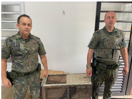
(52183) Carcará, encontrado sem voar em residência, entregue pela GM Cajamar 07-11-2024