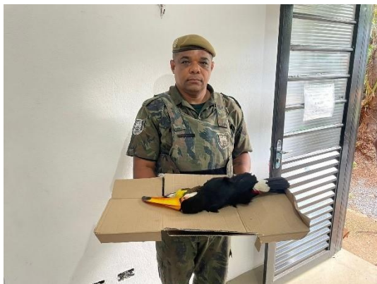
(52147) Tucano-toco e (52148) bem te vi, animais eletrocutados e entregues em óbito pela GM Cajamar 05-11-2024