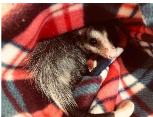
(52404) Gambá de orelha branca