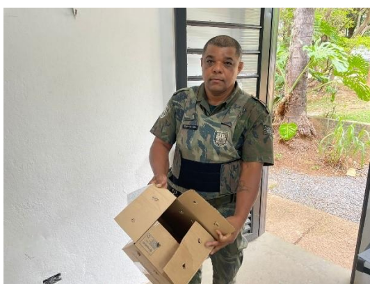
(52456) Maitaca, encontrado sem voar, dentro de residência, entregue pela GM Cajamar em 21-11-2024