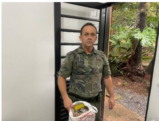
(52186) Bem-te-vi, encontrado dentro de estabelecimento, entregue pela GM Cajamar em 07-11-2024