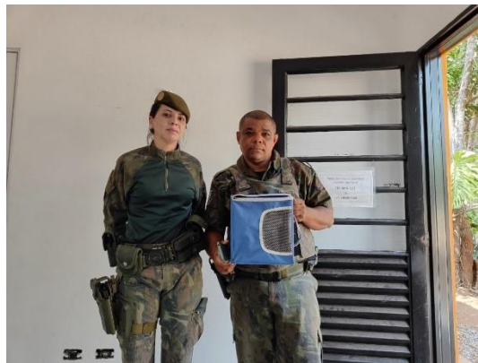
(51121) Sagui, encontrado em condomínio. Entrega pela GCM Cajamar no dia 07-10-2024