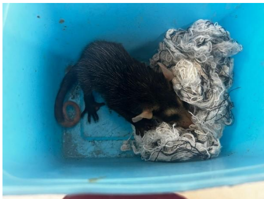
(51151) Gambá de orelha branca