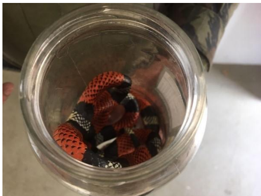
(51185) - Cobra-coral falsa