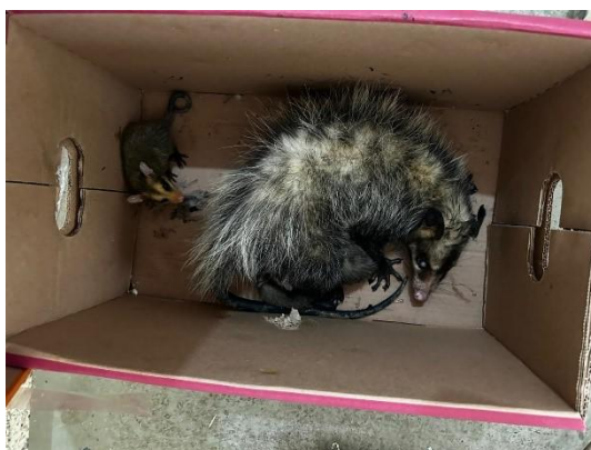
(50975) Gambá de orelha preta

(50975) Gambá de orelha preta, adulta e filhotes (50976 a 50982) encontrados em quintal de chácara. Entregues pela GCM Cajamar no dia 03-10-2024.