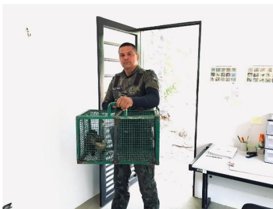
(51120) Carcará, sem histórico com lesão em pata. Entrega pela GM Cajamar no dia 07-10-2024