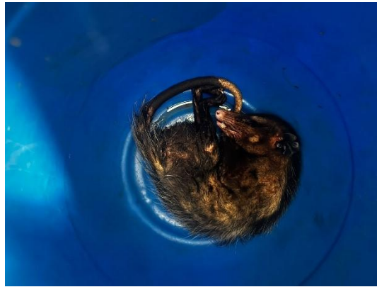
(51190) Gambá de orelha preta