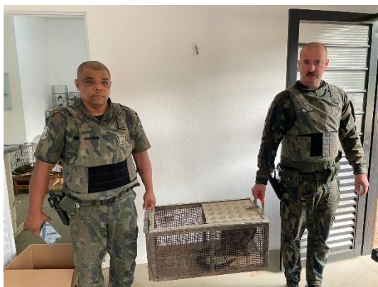
(51032) Quati, encontrado dentro de residência com feridas. Entregue pela GMA Cajamar no dia 04-10-2024