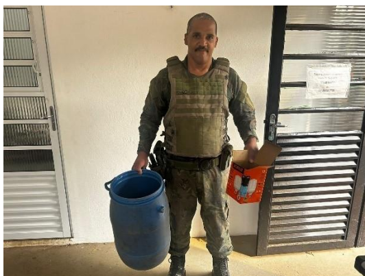
(51189) Coruja Buraqueira, encontrados em área urbana e (51190) Gambá de orelha preta, encontrado em área urbana. Entregue pela GCM Cajamar no dia 08-10-2024