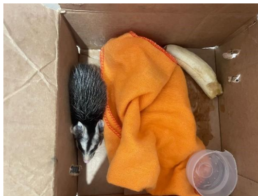
(51252 - 51257) Gambás-de-orelha-branca