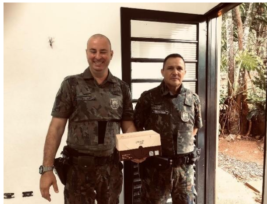
(51819) Gambá-de-orelha-branca, animal encontrado sozinho em quintal, suspeita-se de ataque de cão, entregue por GCM de Cajamar no dia 24-10-2024