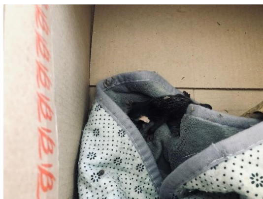
(51463) Gambá de orelha branca