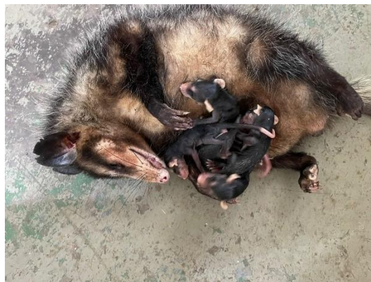
(51201) Gambá de orelha branca, adulto, encontrado em óbito com filhotes (51202 até 51207) no marsúpio