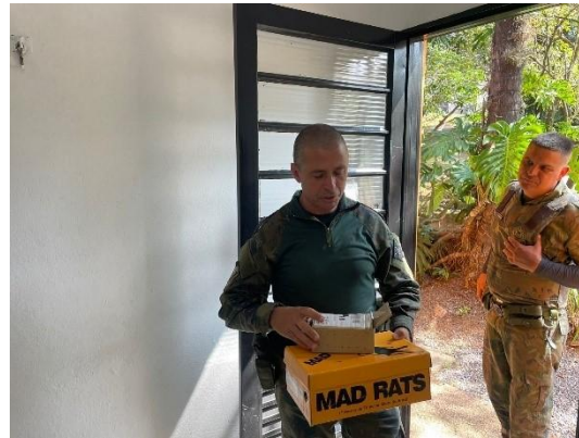
(51962) Avoante, encontrado em escola. Entregue pela GM Cajamar no dia 29-10-2024