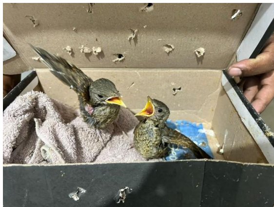
(51994 e 51995) Sabiás