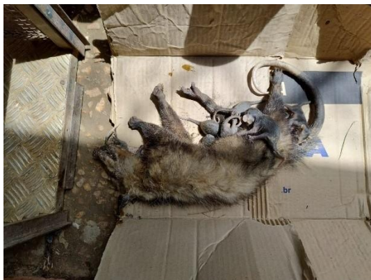
(51386) Gambá de orelha preta