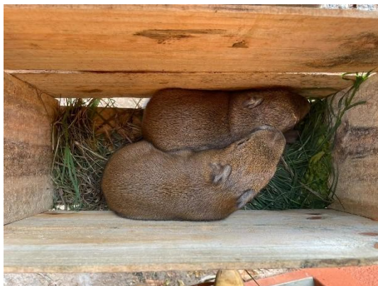
(51025-51026) – capivaras