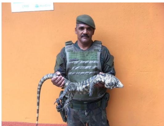
(51274) - Teiú, atropelado, entregue em óbito. Entregue pela GMA Cajamar no dia 10-10-2024