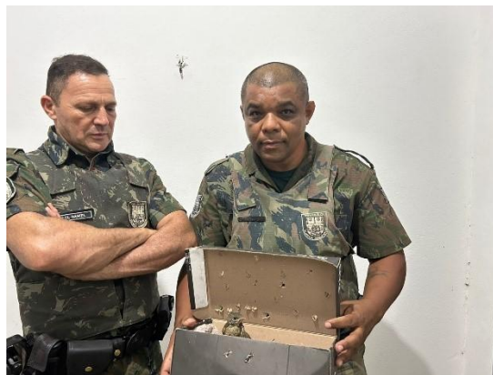
(51994 e 51995) Sabiás, filhotes, animais encontrados em quintal de residência, entregues pela GCM de Cajamar, no dia 30-10-24