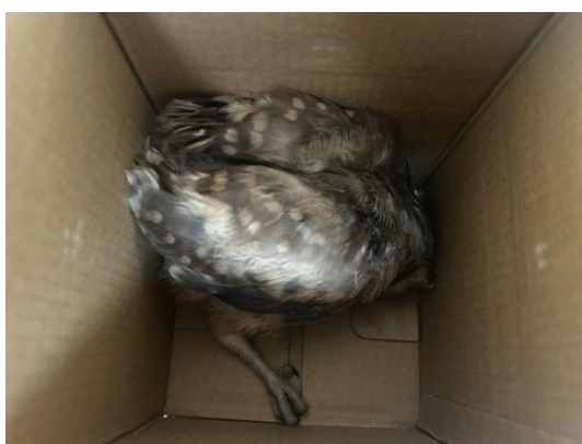
(51189) Coruja Buraqueira