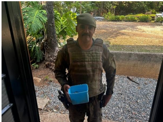
(51151) Gambá de orelha branca, encontrado no pátio da prefeitura. Entregue pela GCM Cajamar no dia 08-10-2024