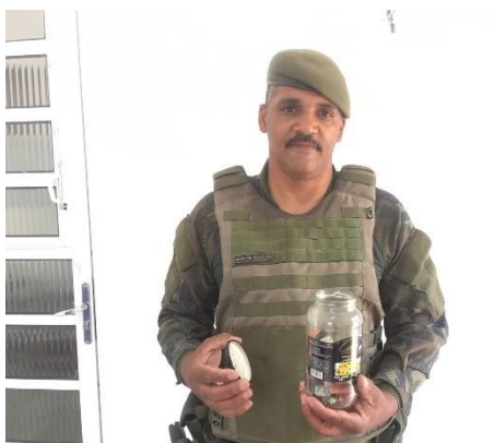
(51185) - Cobra-coral falsa, encontrada debilitada em quintal de residência. Entregue pela GMA Cajamar no dia 08-10-2024