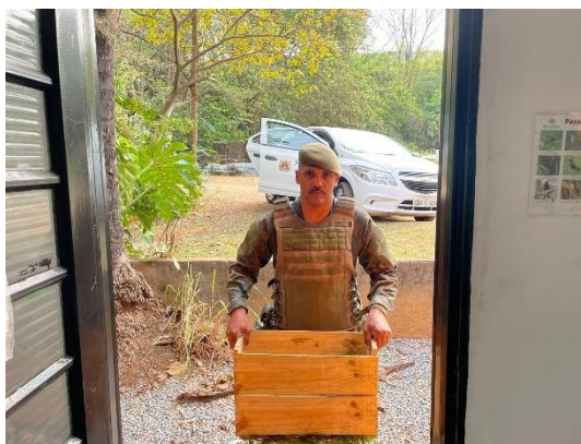
(51025-51026) - Capivaras, filhotes órfãos, encontrados na rodovia. Entregues pela GCM de Cajamar no dia 04-10-2024