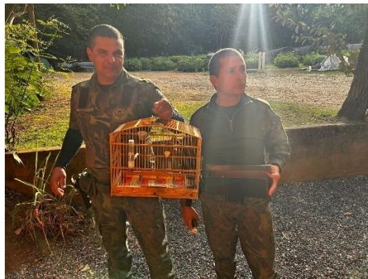
(51540) Gambá de orelha branca, encontrado em área urbana sozinho e (51541) Coleirinho, apreendido em flagrante. Entregues pela GCM Cajamar no dia 15-10-2024