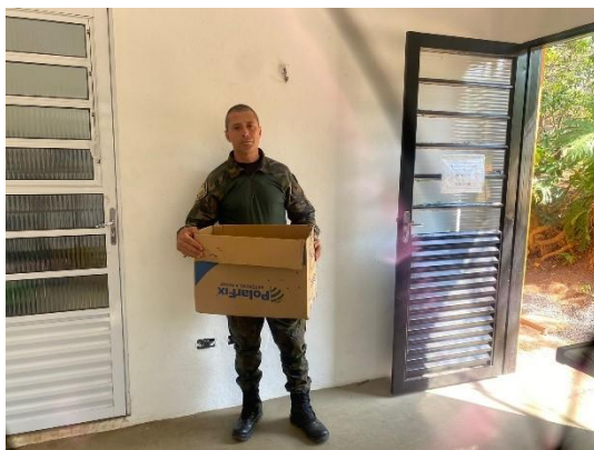
(51411) Bem te vi, encontrado em quintal de residência com linha de pipa enroscada. Entregue pela GMA Cajamar no dia 13-10-2024