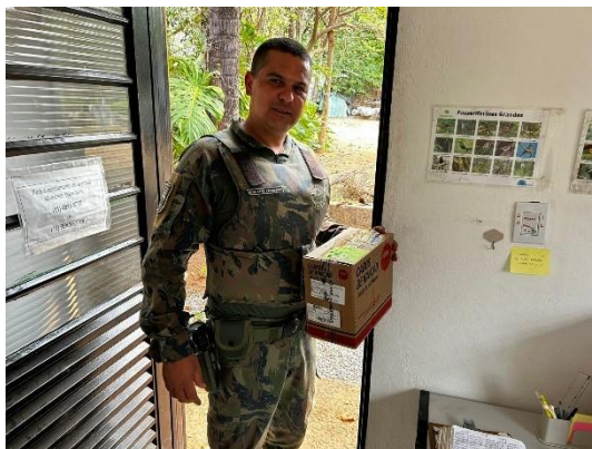
(50995) Bem-te-vi, encontrado caído do ninho. Entregue pela GCM Cajamar no dia 03-10-2024