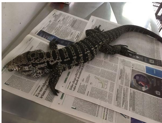
(51274) – Teiú