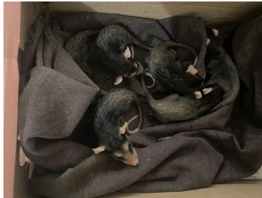
(51208) Gambá de orelha branca

(51208) Gambá de orelha branca, filhote, encontrado em residência e (51252 - 51257) Gambás-de-orelha-branca, animais encontrados ao lado de lixeira. Entregues pela GCM Cajamar no dia 09-10-2024