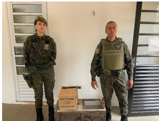
(51201) Gambá de orelha branca, adulto, encontrado em óbito com filhotes (51202 até 51207) no marsúpio. Entregue pela GCM Cajamar no dia 09-10-2024