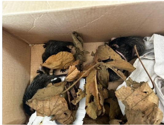
(51531 a 51535) - Gambá de orelha branca