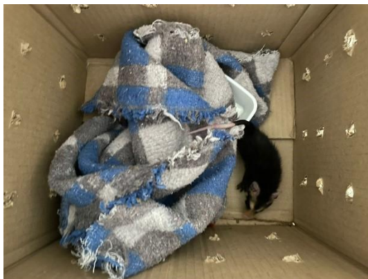
(51251) Gambá de orelha branca, encontrado sozinho na rua. Entregue pela GCM Cajamar no dia 09-10-2024