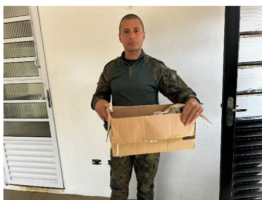
(51531 a 51535) - Gambá de orelha branca, encontrados em residência. Entregue pela GCM Cajamar no dia 15-10-2024