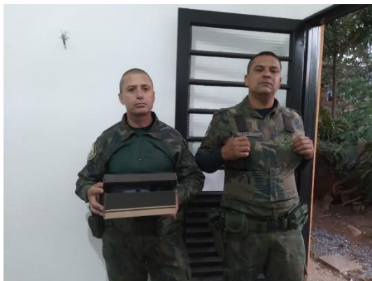
(51081-51083) Gambás, encontrados em quintal de residência. Entregues pela GM Cajamar no dia 05-10-2024