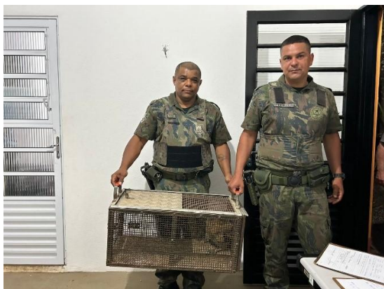
(52029) Urubu, filhote, animal encontrado em estacionamento de empresa sem conseguir voar. Entregue pela Divisão Ambiental de Cajamar, no dia 31-10-24