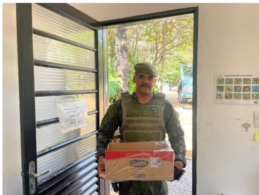
(50724) - Gambá-de-orelha-branca, animal encontrado em rua, entregue pela GMA de Cajamar em 25/09/24