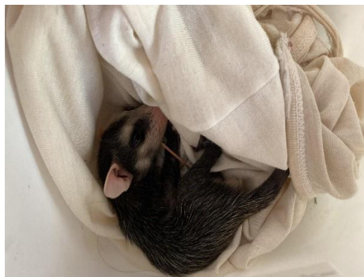
(50787) – Gambá-de-orelha-branca