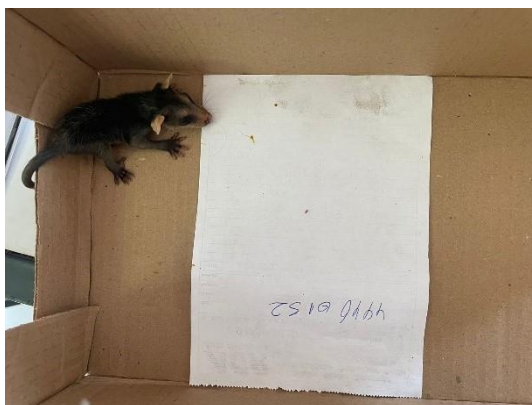
(50724) – Gambá-de-orelha-branca