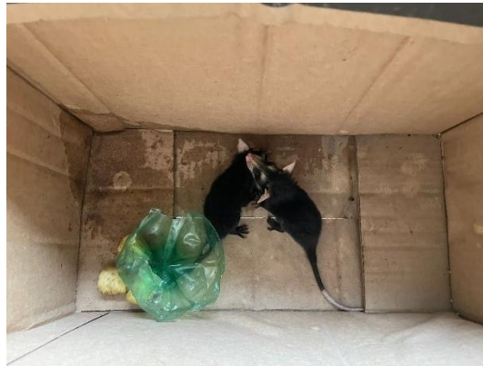
(50779;50779) – Gambás-de-orelha-branca