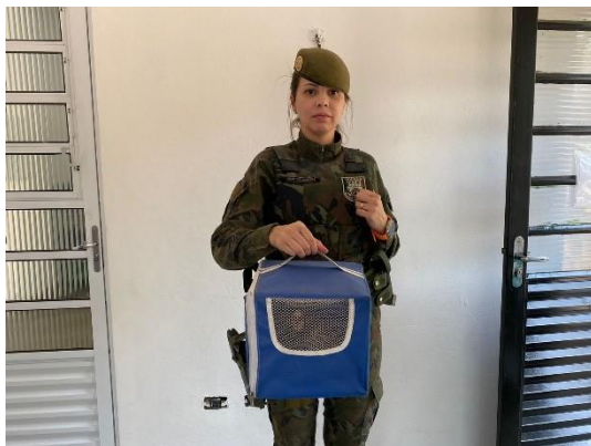
(50194) Sagui híbrido, jovem, encontrado em residência. Muito dócil. Entregue pela GCM de Cajamar em 05/09/2024