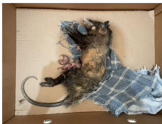
(50495; 50496-50506) – Gambús-de-orelha-branca