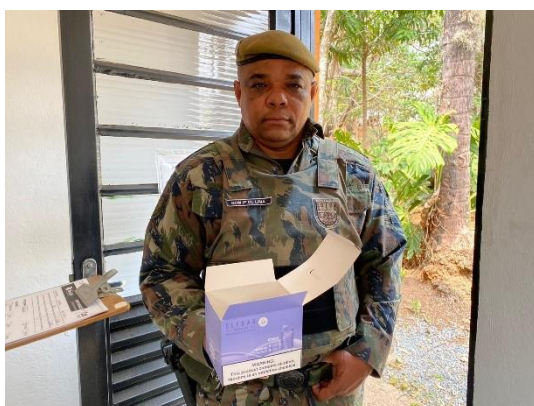
(50214 e 50215) Gambás, filhotes. Mãe foi morta por ataque de cão. Entregues pela GCM de Cajamar em 06/09/24