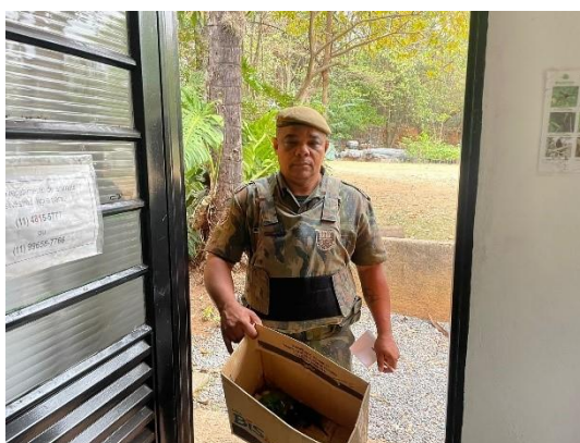
(50779;50779) - Gambás-de-orelha-branca, encontrados em residência, entregue pela GA de Cajamar em 17/09/24