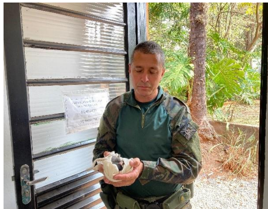
(50787) - Gambás-de-orelha-branca, encontrado em residência, entregue pela GA de Cajamar em 27/09/24