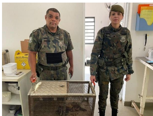
(50495; 50496-50506) - Gambús-de-orelha-branca, encontrados em residência, entregues pela GA de Cajamar em 19/09/24