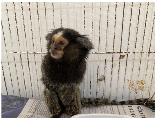
(50194) Sagui híbrido