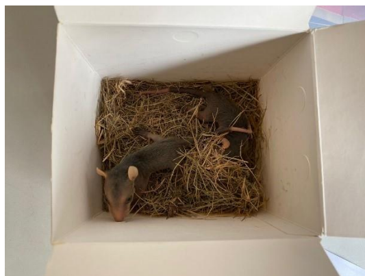
(50214 e 50215) Gambús, filhotes