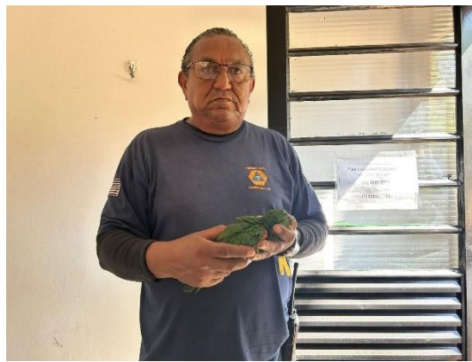
(52582) Maritaca, encontrada caída em via pública, entregue pela defesa civil de Cabreúva em 24-11-2024