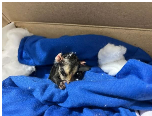
(52294) Gambá de orelha branca