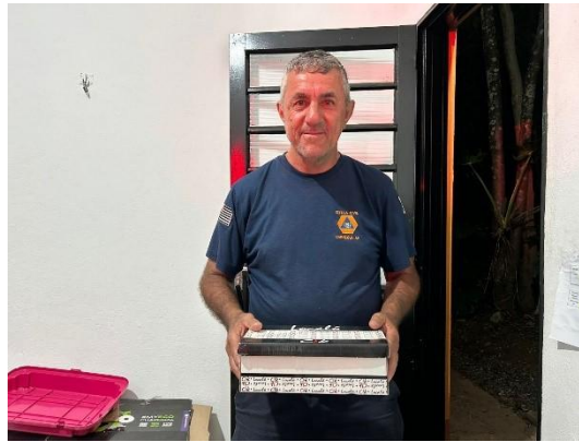
(52294) Gambá de orelha branca, filhote, animal sofreu ataques de gato, entregue pela defesa civil de Cabreúva em 12-11-2024