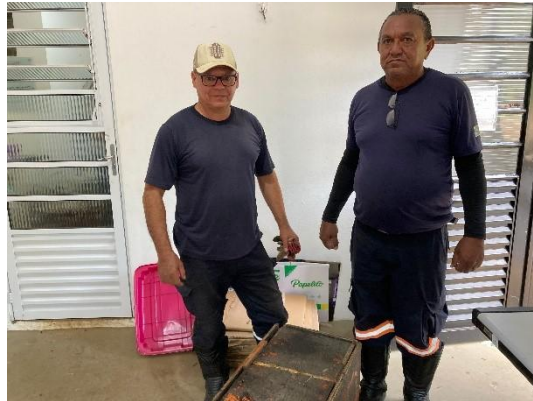
(52337) Irara, animal atropelado, entregue pela Defesa Civil de Cabreúva em 14-11-2024