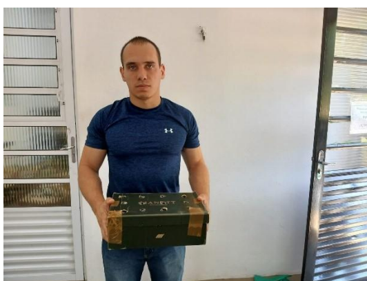
(52401) Maritaca, sem histórico, entregue por corpo de bombeiros de Cabreúva em 18-11-2024