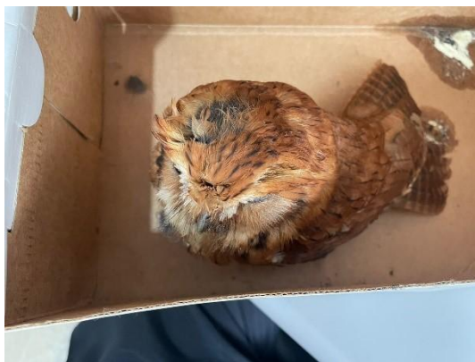
(52371) Coruja do mato