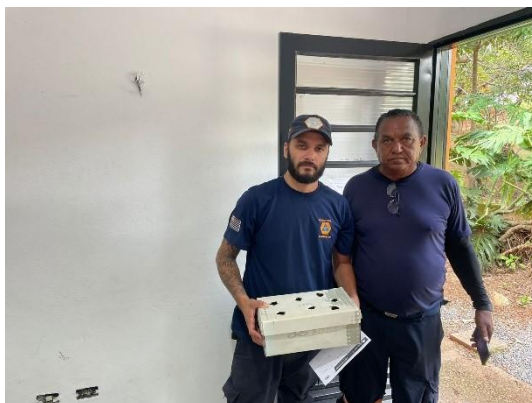
(52371) Coruja do mato, encontrado caído na rua, entregue por defesa civil de Cabreúva em 16-11-2024