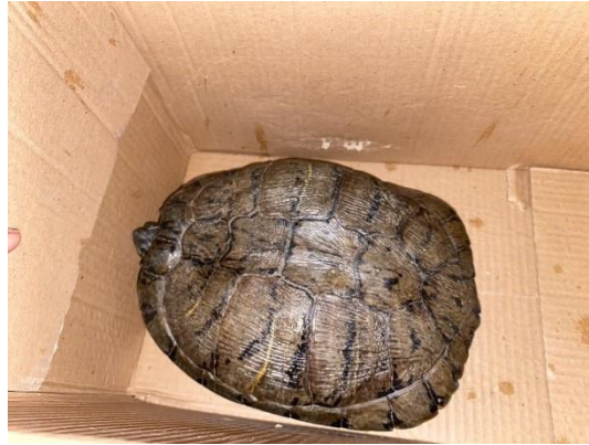
(49881, 49882, 49883 e 49884) Tigres d'água de orelha amarela sem histórico, trazidos de Bragança Paulista em 09-08-2024