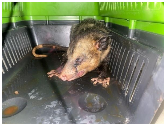
(49866) Gambá-de-orelha-preta trazido de Bragança Paulista em 07-08-24