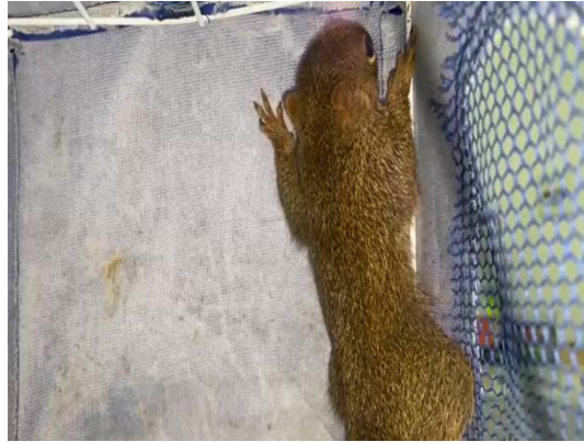
(49902) Caxinguelê trazido de Bragança Paulista em 13-08-2024