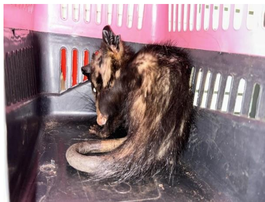
(49932) Gambá-de-orelha-preta encontrado em área urbana, vindo de Bragança Paulista em 16-08-2024