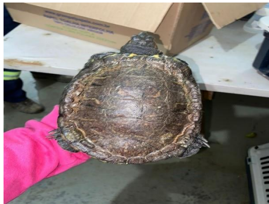
(49881, 49882, 49883 e 49884) Tigres d'água de orelha amarela sem histórico, trazidos de Bragança Paulista em 09-08-2024