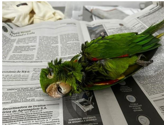
(50117) Maritaca encontrada em área urbana, trazida por AMC de Bragança Paulista em 31-08-2024