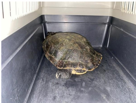
(49881, 49882, 49883 e 49884) Tigres d'água de orelha amarela sem histórico, trazidos de Bragança Paulista em 09-08-2024