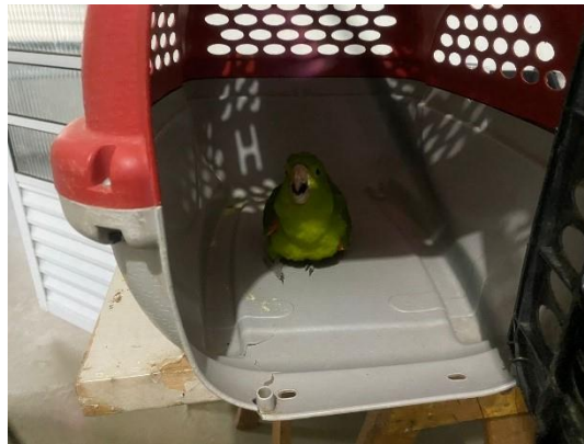
(49853) Maritaca adulta trazida de Bragança Paulista em 06-08-2024