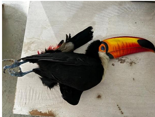
(49933) Tucano-toco em óbito, resgatado em Secretaria Municipal do Meio Ambiente de Bragança Paulista em 16-08-2024