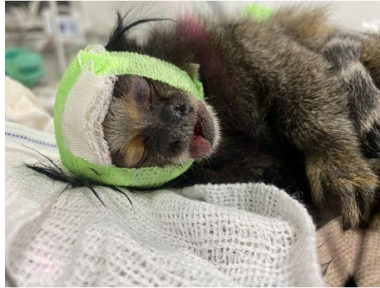
(50117) Sagui-de-tufo-preto encontrado em área urbana, trazido por AMC de Bragança Paulista em 31-08-2024