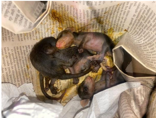
(49868 a 49872) Gambás neonatos trazidos de Bragança Paulista em 07-08-2024