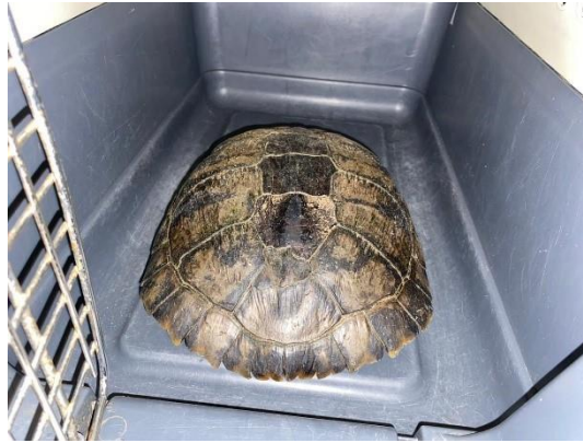
(49881, 49882, 49883 e 49884) Tigres d'água de orelha amarela sem histórico, trazidos de Bragança Paulista em 09-08-2024