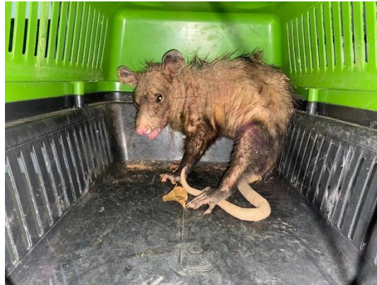
(50060) Gambá-de-orelha-preta trazido de Bragança Paulista em 26-08-2024