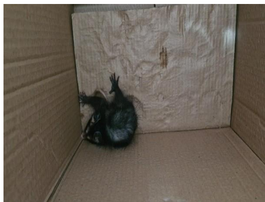
(50059) Gambá-de-orelha-preta resgatado em Bragança Paulista, trazido por AMC em 26-08-2024