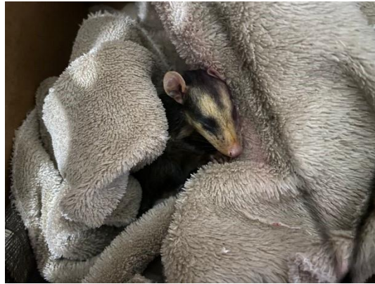
(49852) Gambá filhote trazido de Bragança Paulista em 06-08-2024