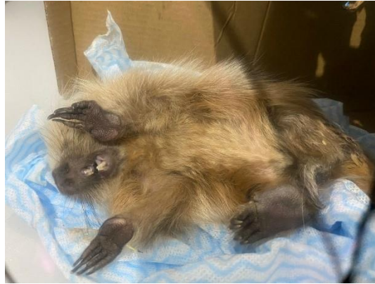
(50022) Ouriço-cacheiro filhote, atacado por cão, chegou em óbito de Bragança Paulista, trazido por AMC em 22-08-2024