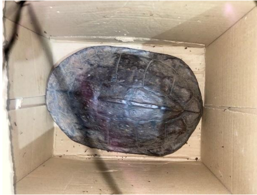
(49867) Cágado trazido de Bragança Paulista em 07-08-2024