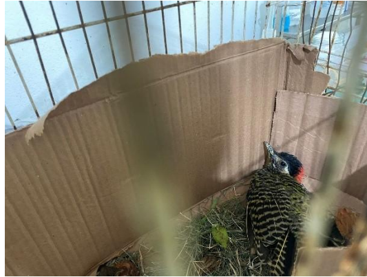
(53003) Pica-pau, animal encontrado caído em via publico, entregue pela Associação Mata Ciliar (SEMA de Bragança), no dia 12-12-24