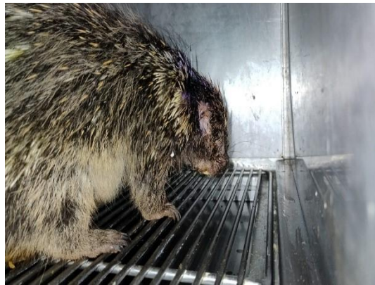
(53241) Ouriço-cacheiro, trazido de Bragança Paulista com ferida na cabeça, no dia 24-12-2024