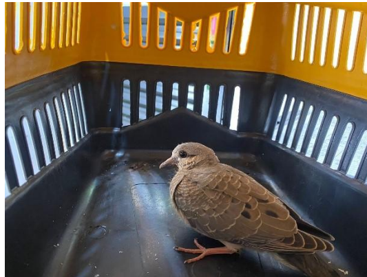
(53299) Avoante, animal sem histórico, trazido pela Associação Mata Ciliar de Bragança Paulista, no dia 30-12-2024