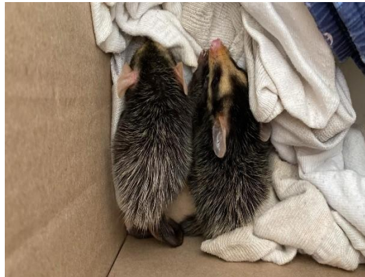
(52837-38) Gambá-de-orelha-preta, filhotes órfãos trazidos da Secretaria do Meio Ambiente de Bragança Paulista, no dia 04-12-24