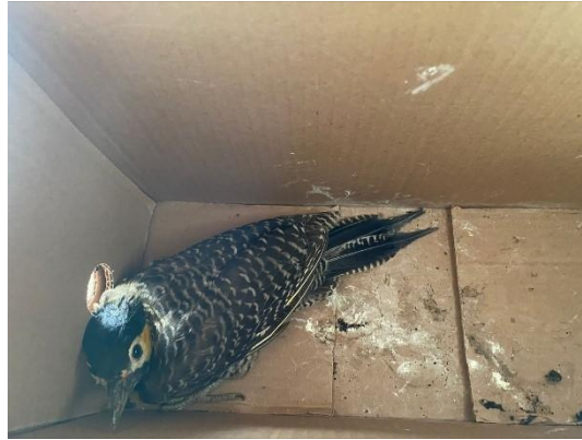
(53297) Pica-pau-do-campo, animal sem histórico, trazido pela Associação Mata Ciliar de Bragança Paulista, no dia 30-12-2024