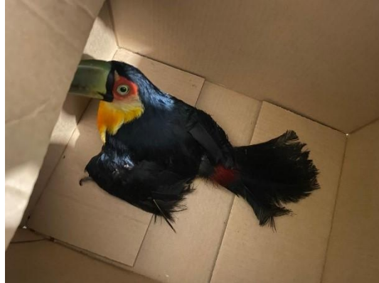
(52875) Tucano-de-bico-verde, entregue pela Faros D'ajuda de Bragança Paulista, no dia 05-12-24