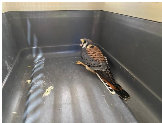
Quiri-Quiri (53298), animal sem histórico, trazido pela Associação Mata Ciliar de Bragança Paulista, no dia 30-12-2024