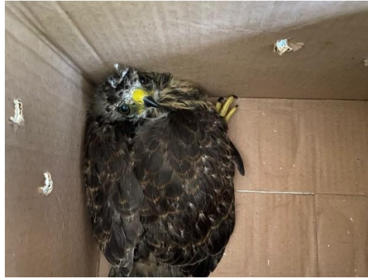
(53190) Gavião-carijó, animal sem histórico, entregue pela Faros D'ajuda de Bragança Paulista, no dia 22-12-2024