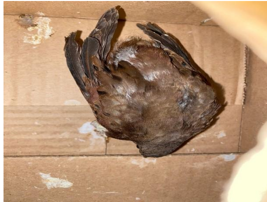
(53025) Rolinha, animal adulto, animal da Faros de Bragança Paulista entregues pela AMC, no dia 13-12-24