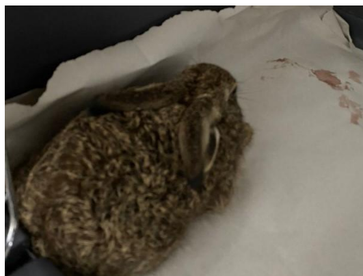
(52803) Tapiti, sem histórico, provenientes de Bragança Paulista em 02-12-2024