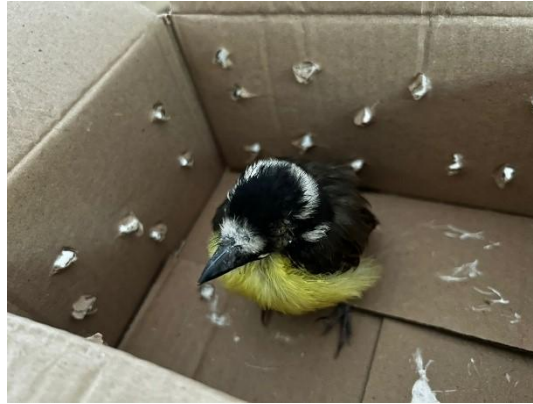
(52907) Bem-te-vis, entregues pela Faros D'ajuda de Bragança Paulista, no dia 08-12-24