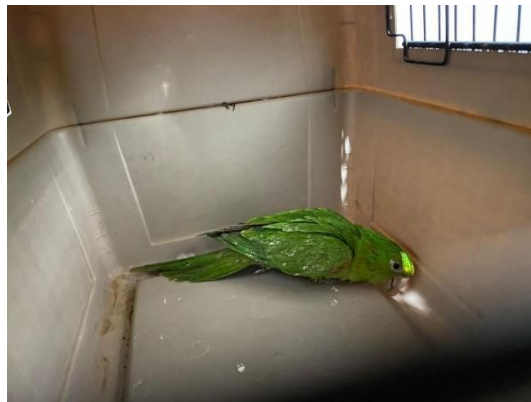
(52802) Maritaca, sem histórico. Provenientes de Bragança Paulista em 02-12-2024