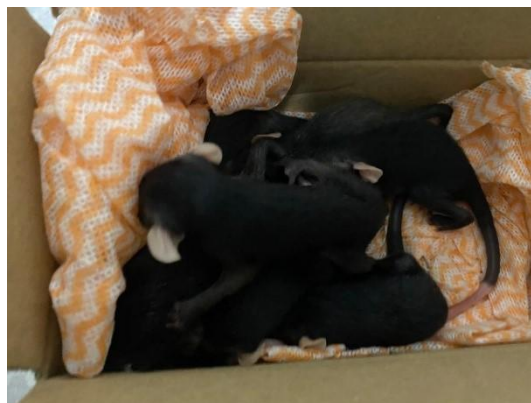
(52866-52874) Gambás-de-orelha-preta, animais filhotes entregues pela Secretaria Municipal do Meio Ambiente de Bragança Paulista, no dia 05-12-24