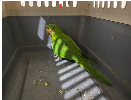
(53226) Maritaca, sem histórico, trazido pela Associação Mata Ciliar de Bragança Paulista, no dia 23-12-2024