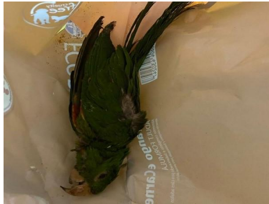
(52801) Maritaca, recebida em óbito, provenientes de Bragança Paulista em 02-12-2024