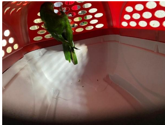
(53189) Maritaca, adulta, em histórico, porém com anilha falsa e penas das asas e retriz cortadas, entregue pela Faros D'ajuda de Bragança Paulista, no dia 22-12-2024