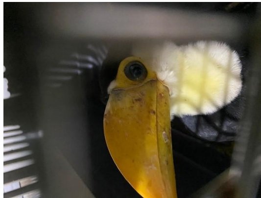
(52889) Tucano-toco, animal filhote caiu do ninho, entregue por Secretaria Municipal do Meio Ambiente de Bragança Paulista, no dia 06-12-24