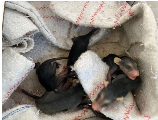
(53191 a 53199) Gambás-de-orelha-preta, animais órfãos, sem histórico, entregues pela Faros D'ajuda de Bragança Paulista, no dia 22-12-2024