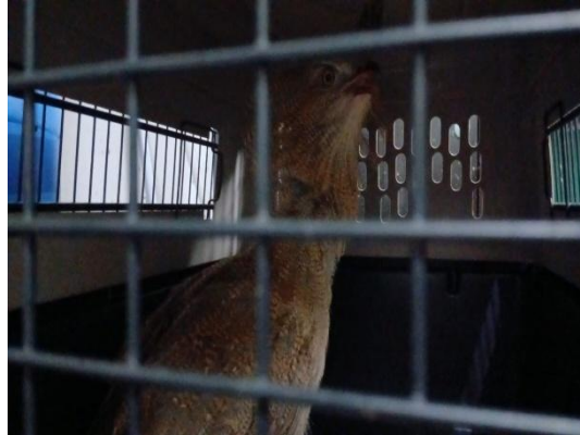
(53054) Seriema, sem histórico. Proveniente de Bragança Paulista, entregue pela Associação Mata Ciliar, no dia 14-12-24