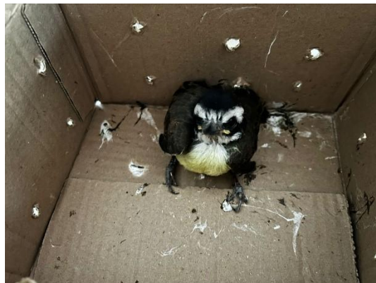
(52906) Bem-te-vis, entregues pela Faros D'ajuda de Bragança Paulista, no dia 08-12-24