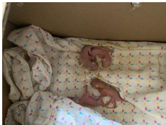
(52923 a 52926) neonatos, animais sem históricos, entregues de Bragança Paulista, no dia 09-12-24