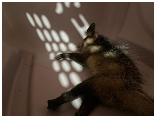
Gamba de Orelha Preta (53026) filhote, animal da Faros de Bragança Paulista entregues pela AMC, no dia 13-12-24