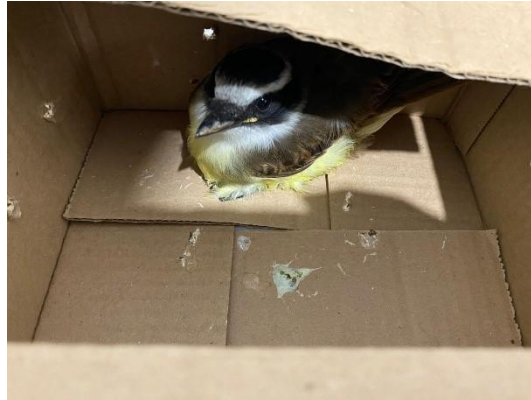
(52804) Bem-te-vi, sem histórico, provenientes de Bragança Paulista em 02-12-2024