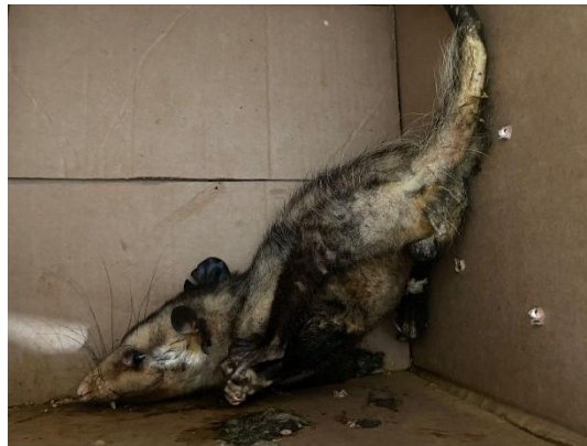
(52922) Gambá-de-orelha-preta, animais sem históricos, entregues de Bragança Paulista, no dia 09-12-24