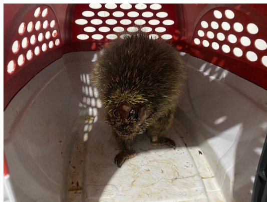
(53225) Ouriço-cacheiro, sem histórico, trazido pela Associação Mata Ciliar de Bragança Paulista, no dia 23-12-2024