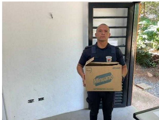
(52433 - 52438) Andorinhão, filhotes, sem histórico, entregue pela GM de Bragança Paulista em 19-11-2024