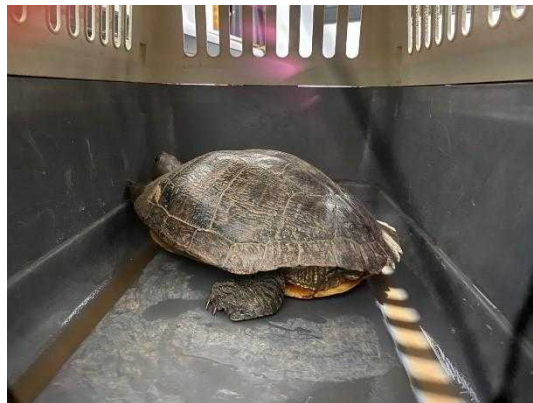
(52389) Tigre d'água, sem histórico. Proveniente de Bragança Paulista 17-11-2024