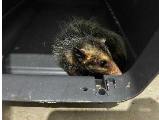
(52480) Gambá de orelha preta, sem histórico. Proveniente de Bragança Paulista em 21-11-2024