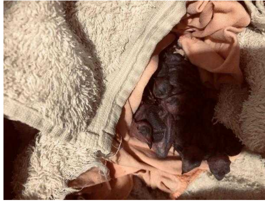
(52433 - 52438) Andorinhão