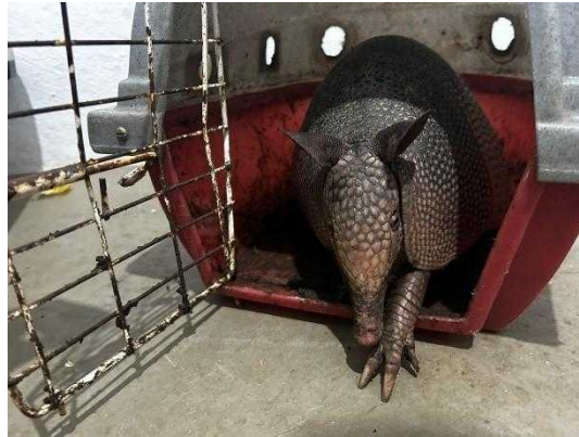
(52481) Tatu, sem histórico. Proveniente de Bragança Paulista em 21-11-2024