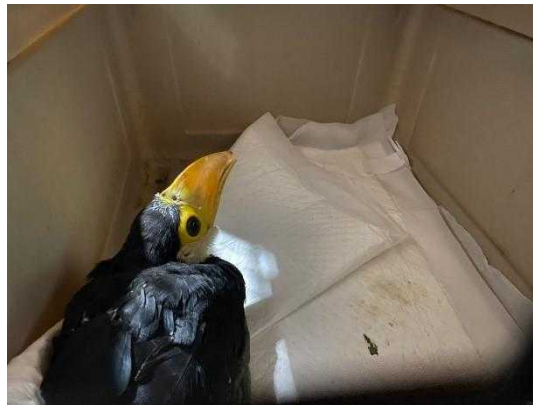
(52733) Tucano-toco, filhote, sem histórico, entregue pela Secretaria do Meio Ambiente de Bragança Paulista em 29-11-2024