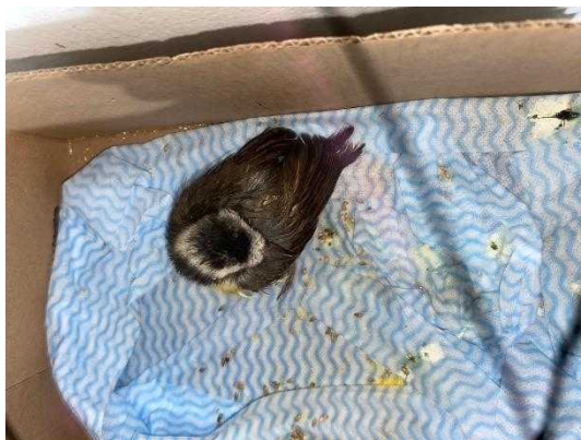
(52261) Bem-te-vi, animal sem histórico. Proveniente de Bragança Paulista em 11-11-2024