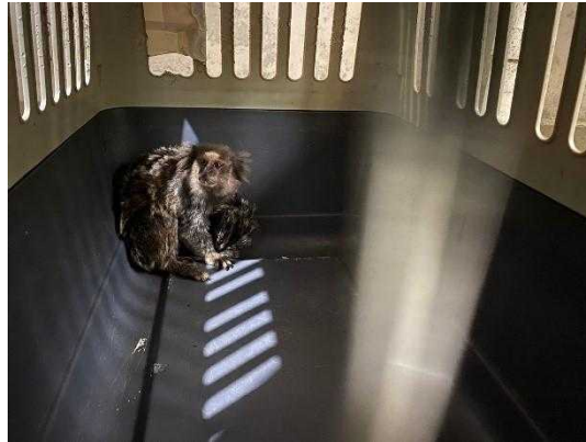
(52740) Sagui de tufo preto, sem histórico. Provenientes de Bragança Paulista em 29-11-2024