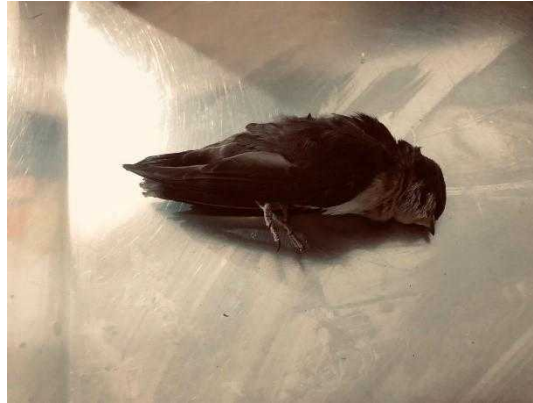
(52408) Andorinha, sem histórico. Proveniente de Bragança Paulista em 18-11-2024