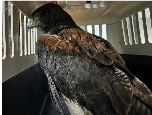
(52188) Gavião de cauda branca, sem histórico. Proveniente de Bragança Paulista em 07-11-2024