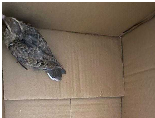
(52734) Avoante, filhote, sem histórico. Proveniente de Bragança Paulista em 29-11-2024