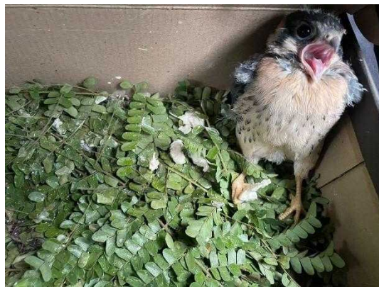
(52203) Quiri-quiri, encontrado caído na via. Proveniente de Bragança Paulista 08-11-2024