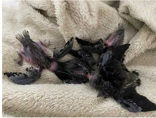
(52735 ao 52738) Andorinhão do temporal, filhotes, sem histórico. Provenientes de Bragança Paulista em 29-11-2024