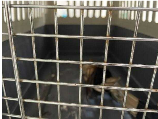
(52451) Anu, sem histórico. Proveniente de Bragança Paulista em 20-11-2024