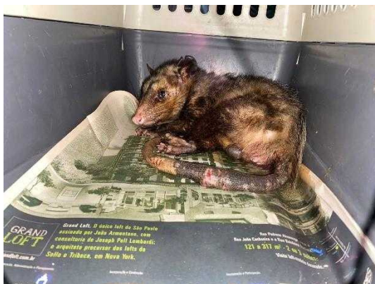
(52262) Gambá-de-orelha-preta, animal sem histórico. Proveniente de Bragança Paulista em 11-11-2024