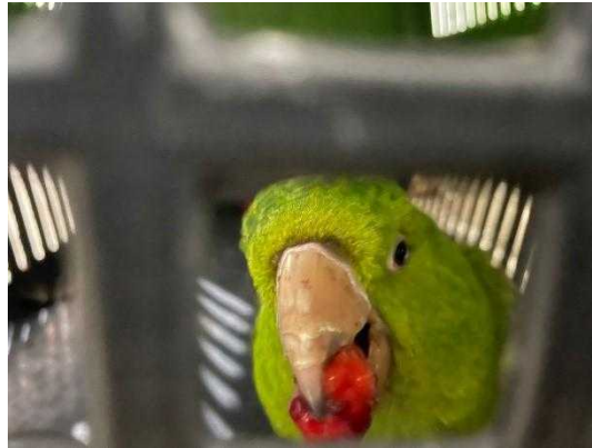
(52322) Maritaca, sem histórico. Proveniente de Bragança Paulista em 13-11-2024