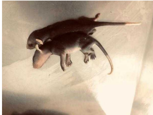
(52409 e 52410) Gambás, sem histórico. Entregues por Bragança Paulista em 18-11-2024