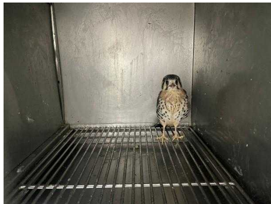
(52452) Quiri-quiri, sem histórico. Proveniente de Bragança Paulista em 20-11-2024