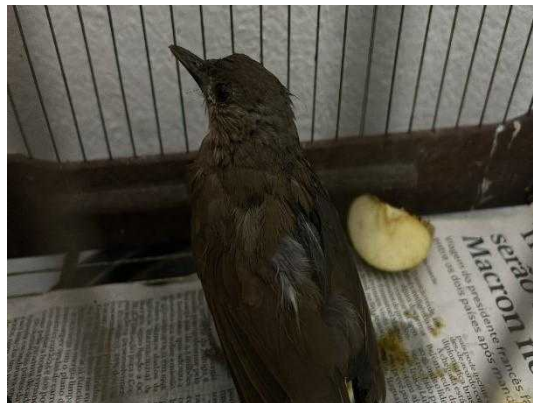
(52290) Sabiá, sem histórico. Proveniente de Bragança Paulista em 12-11-2024