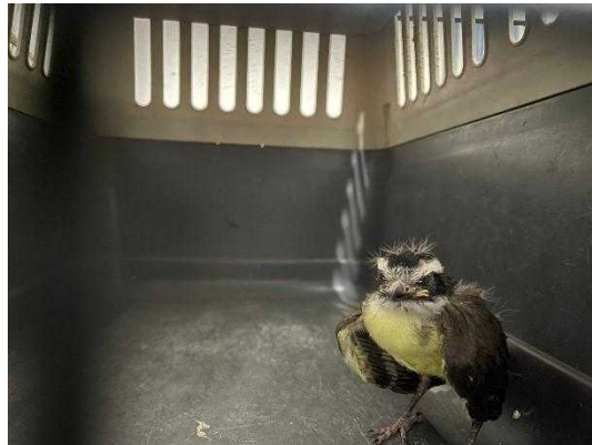
(52049) Bem-te-vi, sem histórico. Proveniente de Bragança Paulista em 01-11-2024