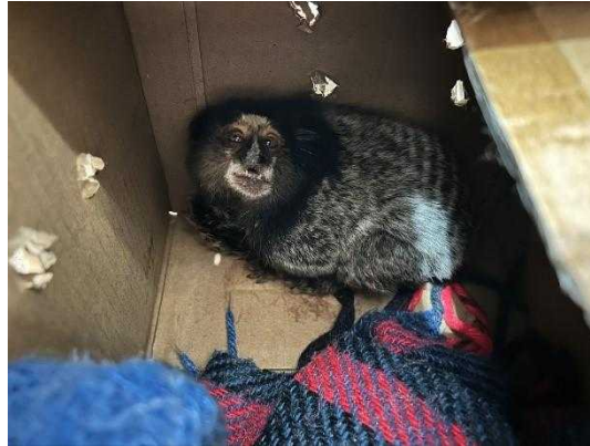
(52568) Sagui de tufo preto, adulto, sem histórico. Proveniente de Bragança Paulista em 23-11-2024