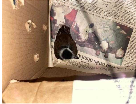
(52264) Bem-te-vi, animal sem histórico. Proveniente de Bragança Paulista em 11-11-2024