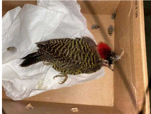
(52122) Pica-pau-verde-barrado. Proveniente de Bragança Paulista em 04-11-2024