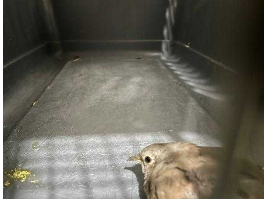
(52048) Rolinha, sem histórico. Proveniente de Bragança Paulista em 01-11-2024