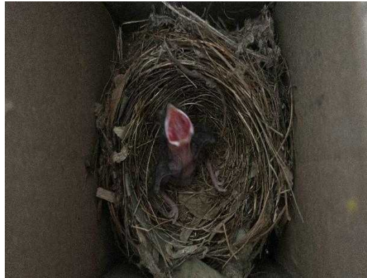
(52289) Passeriforme, sem histórico. Proveniente de Bragança Paulista em 12-11-2024