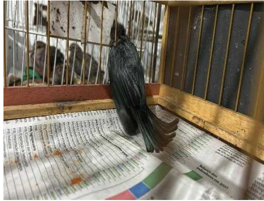
(52291) Sanhaço, sem histórico. Proveniente de Bragança Paulista em 12-11-2024