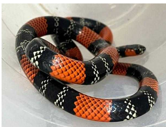
(52263) Coral, animal sem histórico. Proveniente de Bragança Paulista em 11-11-2024