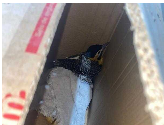
(52519) Pica-pau-do-campo, colidiu com vidraça, proveniente de Bragança Paulista em 22-11-2024