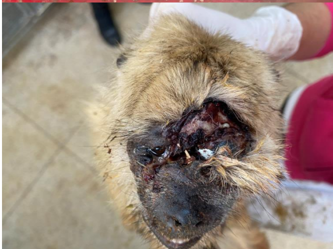
Bugio-preto RG2013. Fêmea idosa entregue após briga intraespecífica no município de Buritama.