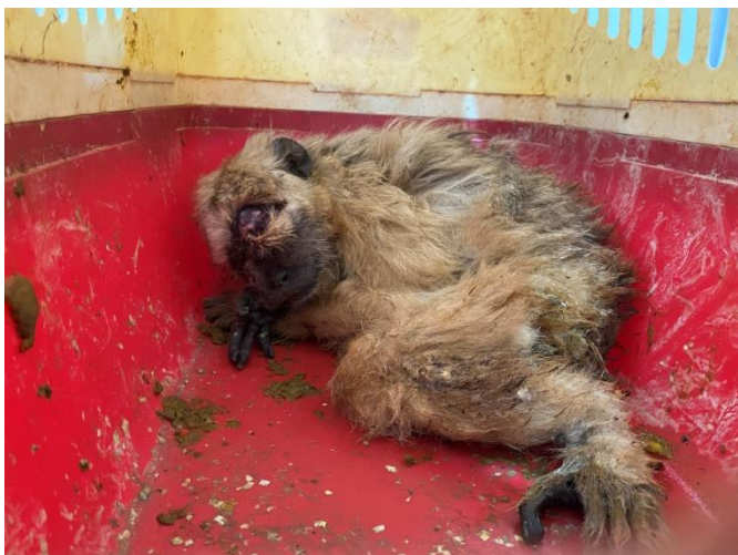
Bugio-preto RG2013. Fêmea idosa entregue após briga intraespecífica no município de Buritama.