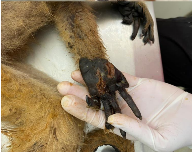
Bugio-preto RG2013. Fêmea idosa entregue após briga intraespecífica no município de Buritama.