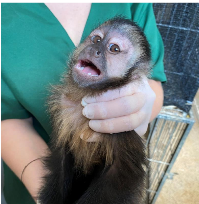
Macaco-prego RG2012. Macho jovem vítima de tráfico em Birigui.