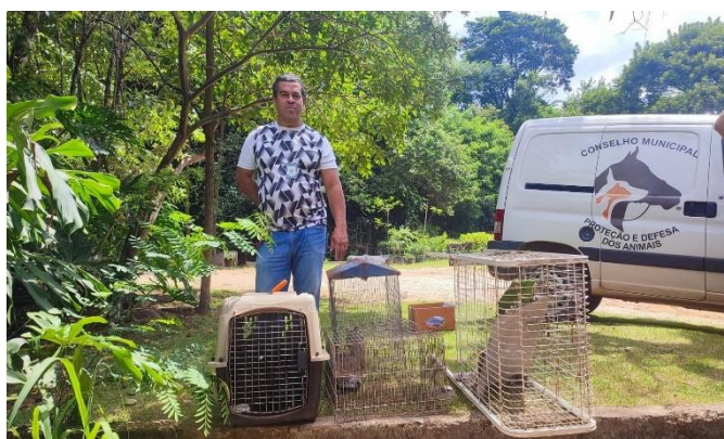
(48537 e 48538) – Maritacas, jovens, sem histórico - (48539) Tigre d'agua, encontrado em via pública, possível atropelamento - (48540) Lebre, adulta, sem histórico - (48541) Passeriforme, jovem, sem histórico. Entregues pela Prefeitura de Indaiatuba no dia 23-02-2024