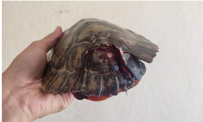
(48539) Tigre d'agua