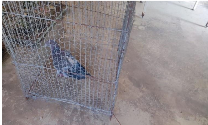
(48541) - Passeriforme