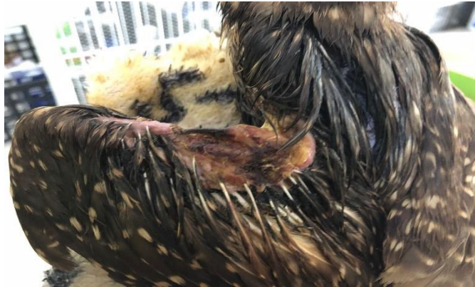
(48310) - Coruja buraqueira