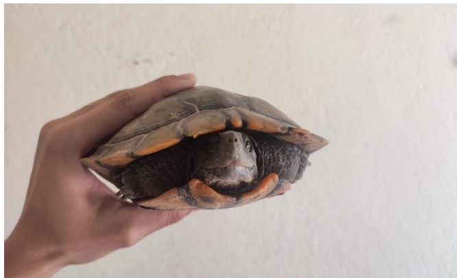
(48539) Tigre d'agua