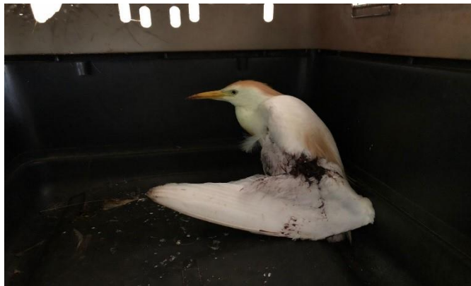
(48609) Garça Vaqueira