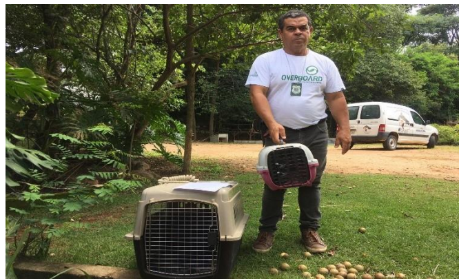
(48255 e 48256) - Maritacas, adultas, enroscadas em linha de pipa - (48257) - Mergulhão, adulto, encontrado em pista de condomínio. Entregues por Prefeitura de Indaiatuba no dia 05-02-2024