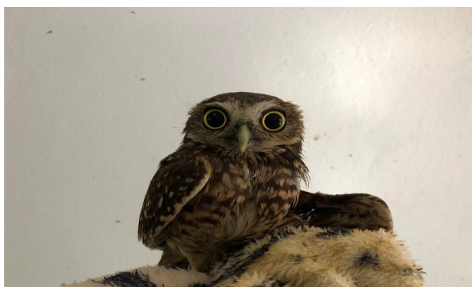
(48310) - Coruja buraqueira