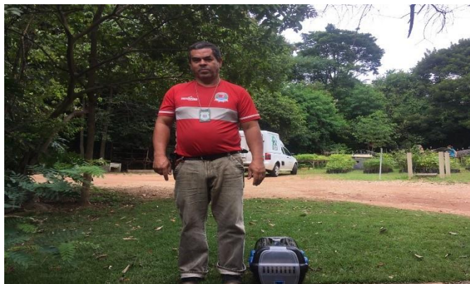
(48439 e 48440) - Maritacas, jovens, encontrados com linha enroscada nas patas - prefeitura de Indaiatuba 17-02-2024