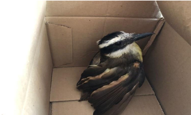
(48608) Bem Te Vi