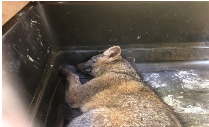
(48311) - Cachorro do mato