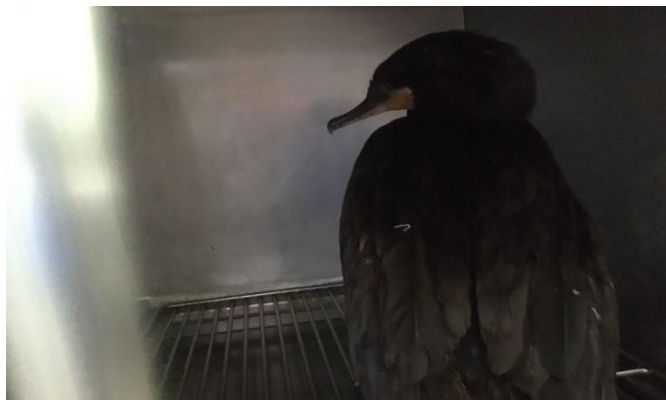
(48257) - Mergulhão