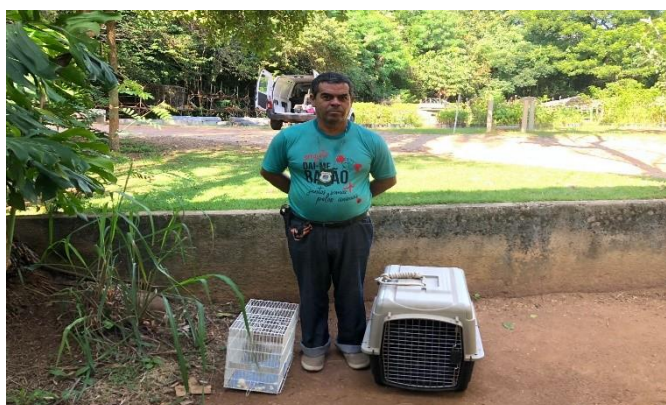
(48310) - Coruja buraqueira, adulta, sem histórico - (48311) - Cachorro do mato, adulto, encontrado atropelado. Entregue por Prefeitura de Indaiatuba no dia 08-02-2024