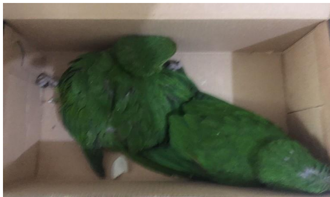
(48439 e 48440) – Maritacas