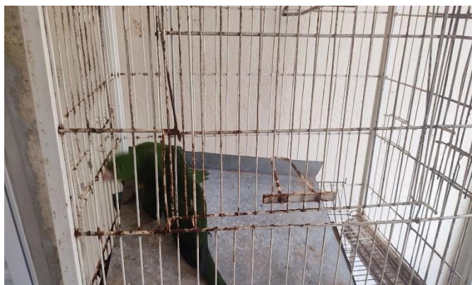
(48537 e 48538) – Maritacas