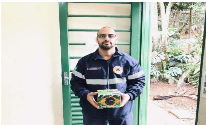
(49021) -Beija flor, animal encontrado caindo em quintal. Entregue pela defesa civil de campo limpo paulista no dia 23-03-2024