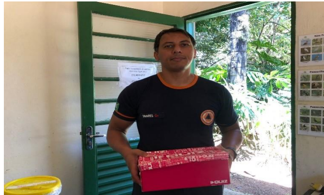
(48859) -Urutau, adulto, encontrado em quintal de residência. Entregue pela defesa civil de Campo Limpo Paulista no dia 11-03-2024