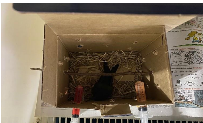
(49021) -Beija flor