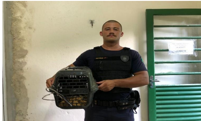
(48770) -Ouriço cacheiro, jovem, machucado em quintal de residência, recebeu cuidados, apresenta laceração no dorso. Entregue pela GM de Campo Limpo Paulista no dia 06-03-2024