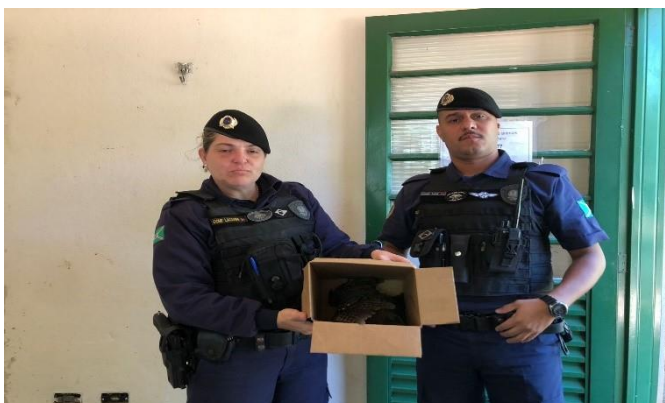
(49077) -Corujinha do mato, adulta, animal encontrado caído em rodovia. Entregue pela GM de Campo Limpo Paulista no dia 31-03-2024