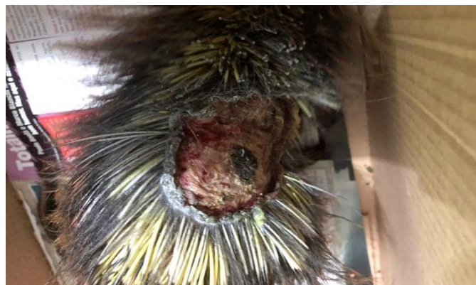
(48770) -Ouriço cacheiro