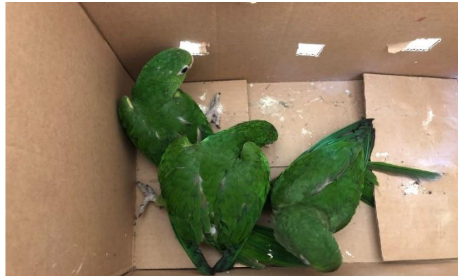
(48710 ao 48712) -Maritacas