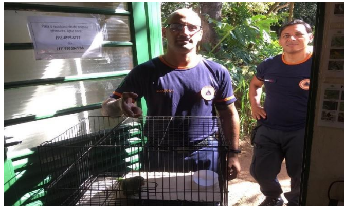
(48695) -Maritaca, jovem, caída em quintal. Entregue pela Defesa Civil de Campo Limpo Paulista no dia 03-03-2024