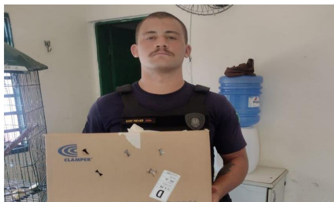
(48925) -Gavião Carijó, adulto, animal encontrado caído em via pública. Entregue pela GM de Campo Limpo Paulista no dia 16-03-2024