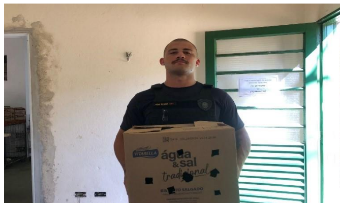
(48710 ao 48712) -Maritacas, jovem, encontrado em residência, enroscado com linha. Entregue pela GM de Campo Limpo Paulista no dia 04-03-2024