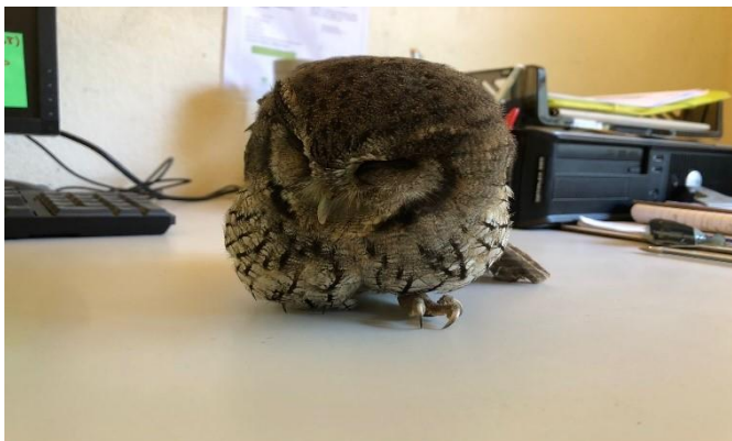
(49077) -Corujinha do mato