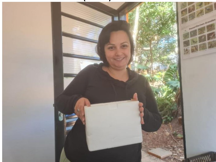
(49446) - Rolinha, filhote, animal encontrado em via pública, trazido por município de Itupeva no dia 31-05-24