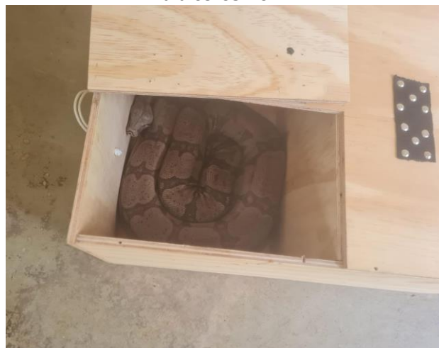
(49331) - Jiboia, adulta