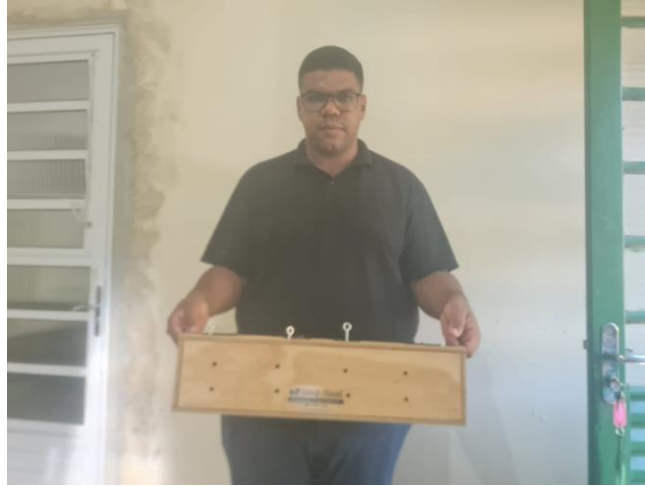
(49316) - Cascavel, adulta, encontrada em condomínio, entregue por munícipe de Itupeva no dia 06-05-2024