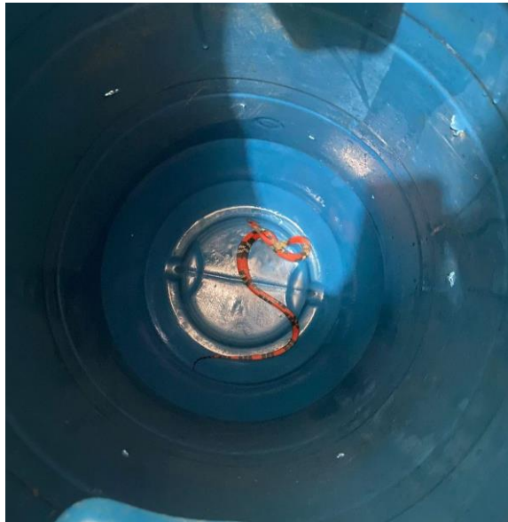
(49438) - Coral