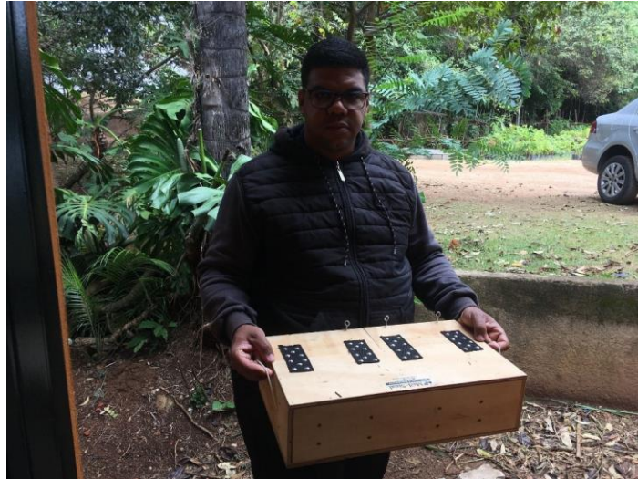
(49438) - Coral, encontrada em condomínio e entregue por município de Itupeva no dia 28-05-24