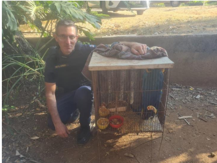
(49409) - Arara-canindé, adulta, município alegou que apareceu hoje pela manhã, em sua fazenda, entregue por GCM de Itupeva no dia 21-05-24