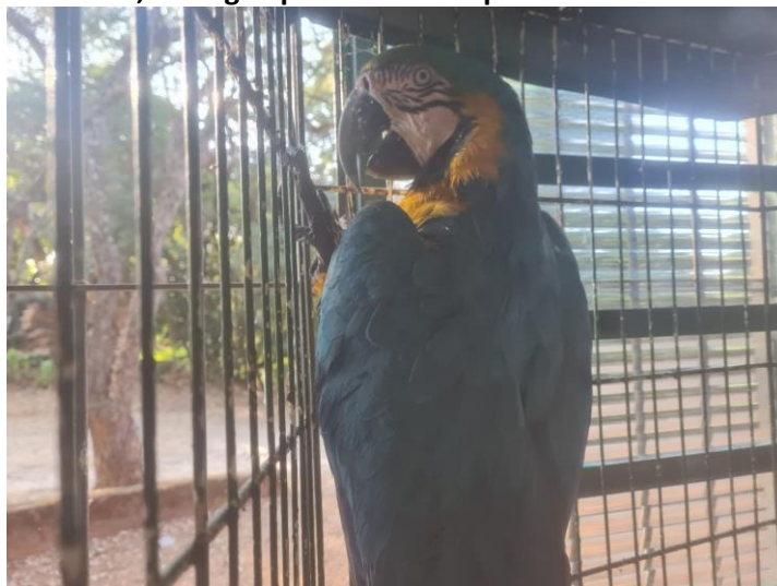
(49409) - Arara-canindé