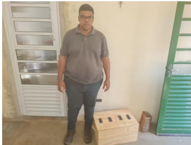
(49331) - Jiboia, adulta, encontrada em condomínio, entregue por munícipe de Itupeva no dia 09-05-2024