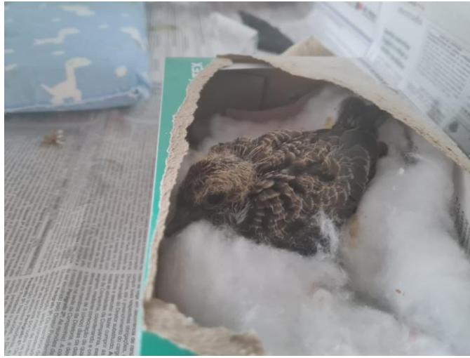
(49446) - Rolinha, filhote