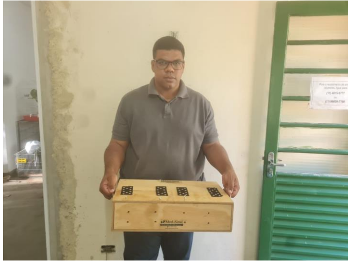
(49340) - Cascavel, adulta, encontrada em condomínio, entregue por município de Itupeva no dia 10-05-2024