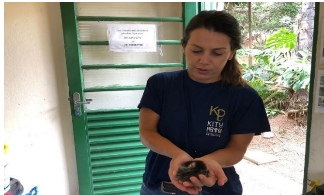
(48821) -Gambá de orelha branca, filhote, encontrado em estacionamento. Entregue por município de Itupeva no dia 08-03-2024