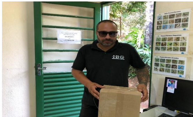
(48996) -Quiriquiri, adulto, animal encontrado dentro de construção, onde colidiu com vidro. Entregue por município de Itupeva no dia 21-03-2024