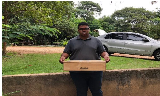
(49038) -Cascavel, adulta, encontrado em condômino, animal com escoriações pelo corpo. Entregue pela reserva Santa Mônica de Itupeva no dia 26-03-2024