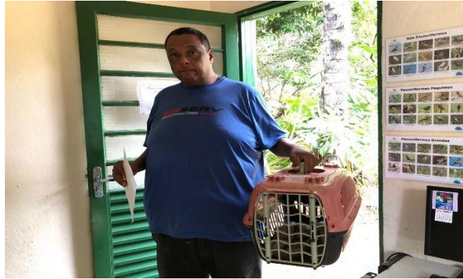
(48996) -Quiri-quiri, adulto, animal encontrado dentro de construção, onde colidiu com vidro. Entregue por município de Itupeva no dia 21-03-2024