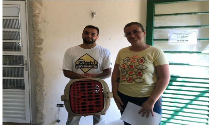
(48736) -Maritaca, jovem, encontrado em residência. Entregue pela prefeitura de Itupeva no dia 05-03-2024