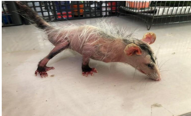
(48264) - Gambá de Orelha Branca