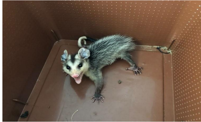
(48322) - Gambá de Orelha Branca, jovem, encontrado em residência. Entregue por município Itupeva no dia 08-02-2024