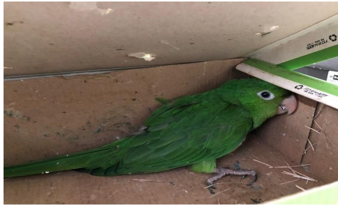
(48523) - Maritaca