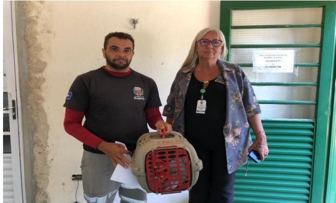
(48264) - Gambá de Orelha Branca, fêmea, adulta, caiu em recipiente de cloro. Entregue por Prefeitura de Itupeva no dia 06-02-2024