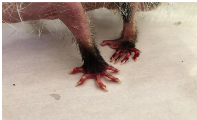
(48264) - Gambá de Orelha Branca