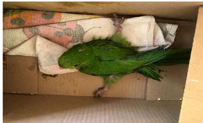
(48368) - Maritaca