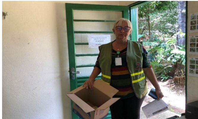
(48534 e 48535) - Gambás, filhotes, mãe morta por ataque de cão. Entregue por Prefeitura de Itupeva no dia 23-02-2024