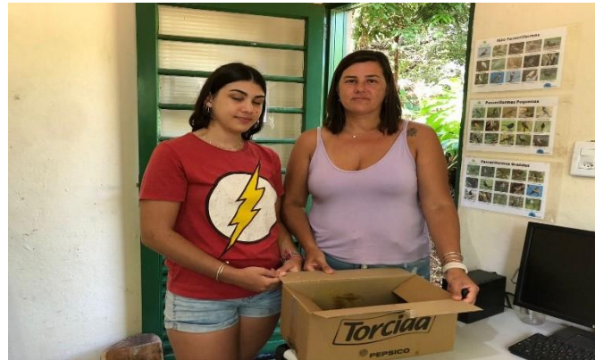
(48368) - Maritaca, jovem, encontrado machucado em quintal. Entregue por município Itupeva no dia no dia 12-02-2024