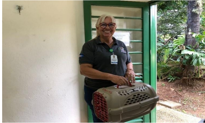
(48523) - Maritaca, jovem, encontrado em via pública, ausência de penas e asa. Entregue por prefeitura de Itupeva no dia 22-02-2024