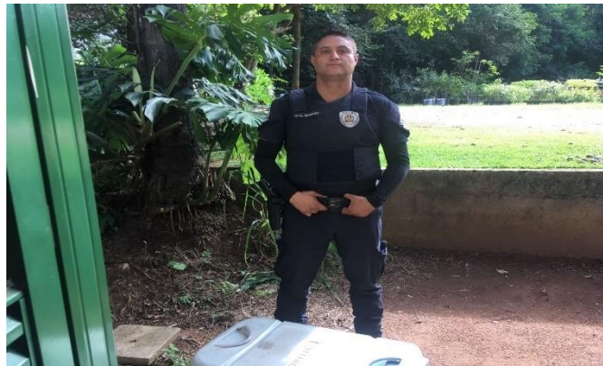
(48144) - Jacu, encontrado caído em piscina. Entrega por GM Itatiba no dia 28-01-2024