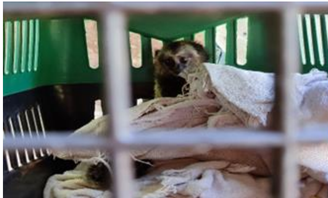
(48074) - Sagui