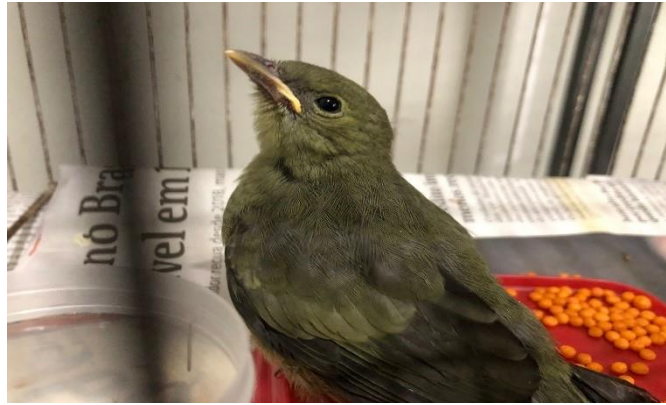
(48125) - Sanhaço do coqueiro