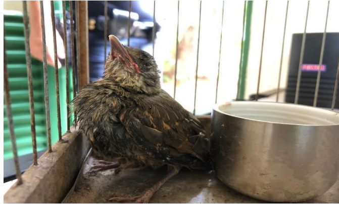
(47949) – Sabiá