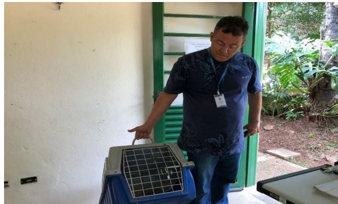
(47975) - Jacu, adulto, encontrado em quintal de residência. Entregue por GM Itatiba no dia 19-01-2024