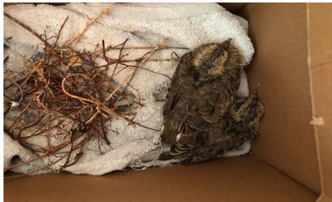
(47732 e 47733) - Columbiformes