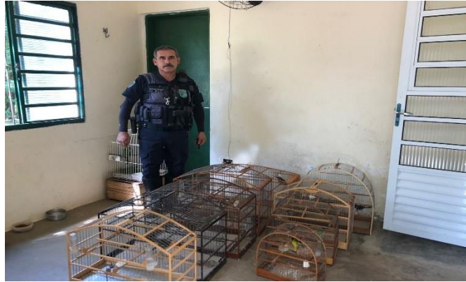
(48155 até 48162) Bigodinho, coleirinho, pintassilgo, azulão e trinca ferro, animais adultos. Apreensão e entrega por GM Itatiba no dia 29-01-2024