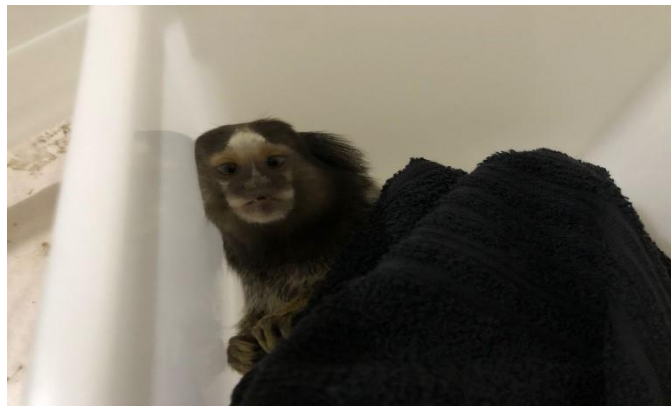
(47997) – Saguí