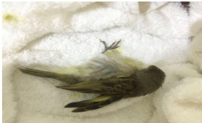
(48135) - Canário