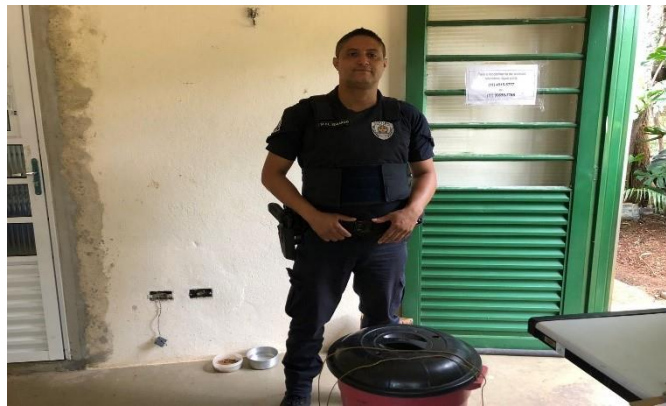
(48043) – Gambá de orelha preta, adulto, fêmea, atropelado. Entregue por GM Itatiba no dia 22-01-2024