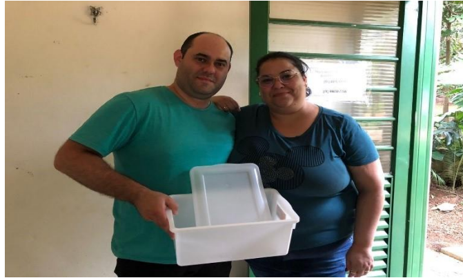
(47997) - Saguí, adulto, atropelado. Entregue por munícipe de Itatiba no dia 19-01-2024