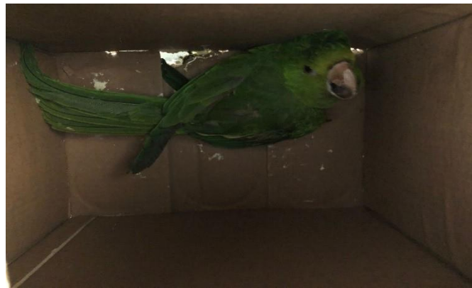
(48057) - Maritaca