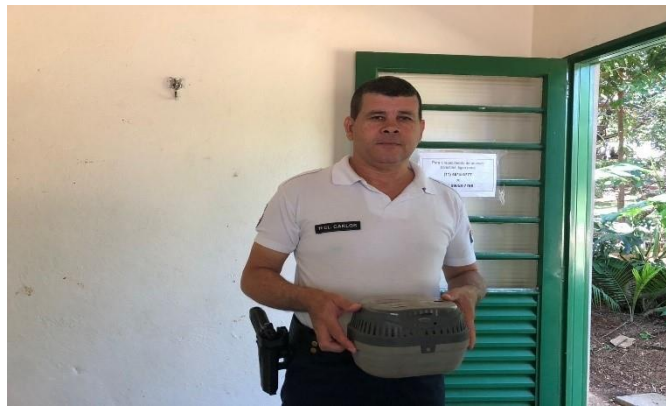
(48150) - Rolinha, jovem, sem histórico. Entregue por GM Itatiba no dia 29-01-2024