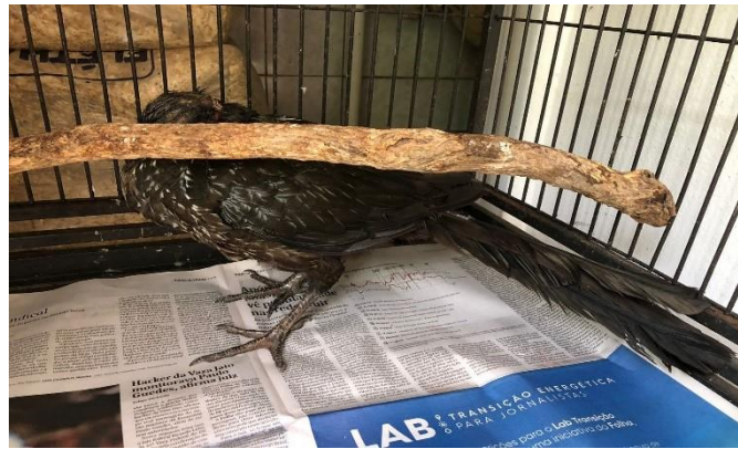
(47975) – Jacu