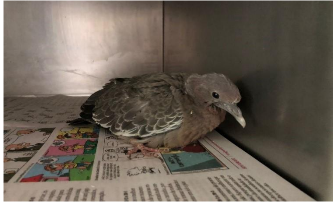
(47610) - Asa branca