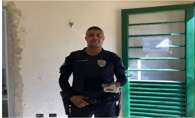
(47926) - Gambá, neonato, mãe morta por atropelamento. Entregue por GM Itatiba no dia 16-01-2024