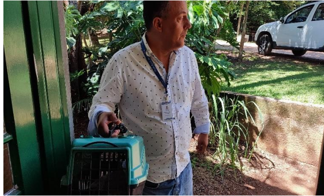
(48074) - Sagui, jovem, encontrado em casa sem conseguir se locomover. Entregue por prefeitura de Itatiba no dia 24-01-2024