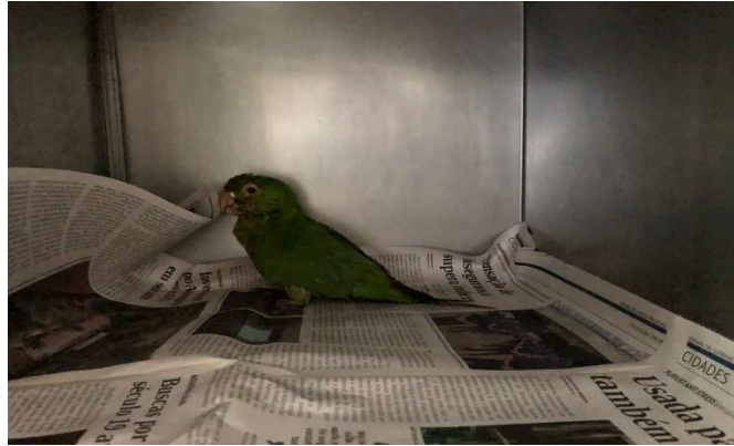
(48084) – Maritaca