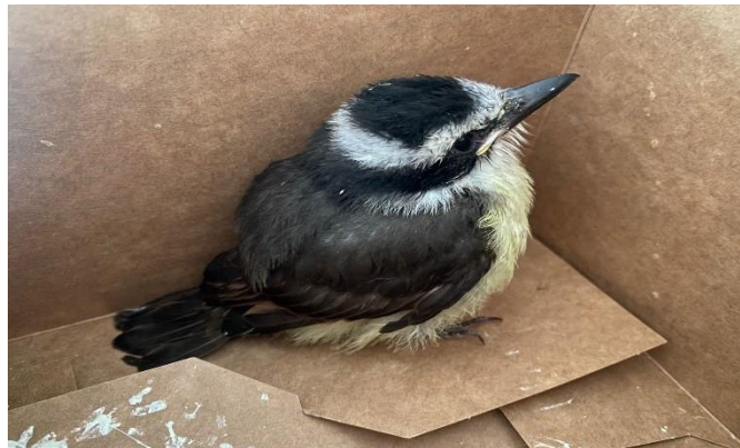
(47839) - Bem-te-vi