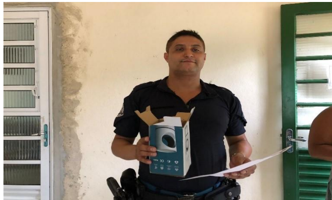
(48020) - Rolinha, filhote, caiu do ninho em chácara. Entregue por GM Itatiba no dia 20-01-2024