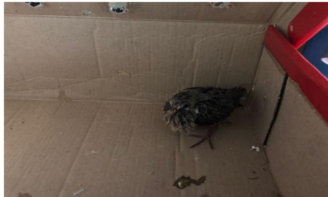
(48058) - Rolinha