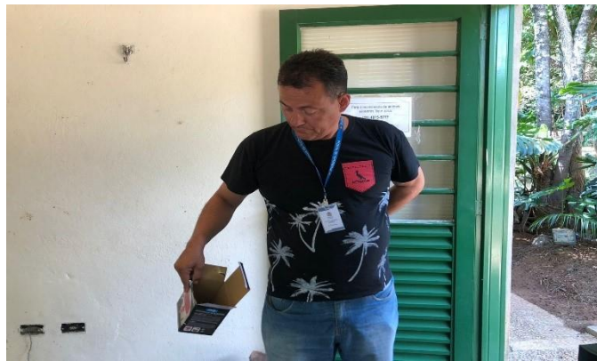
(47951) - Maritaca, filhote, encontrado em quintal de residência. Entregue por GM Itatiba no dia 18-01-2024