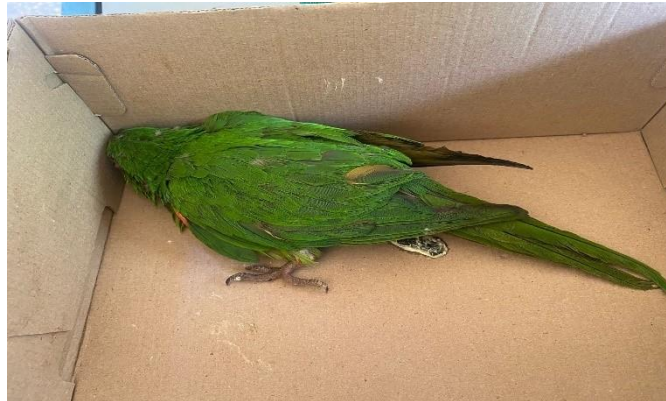
(48040) – Maritaca