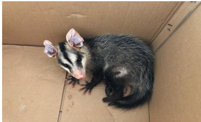
(48110) – Gambá de orelha branca