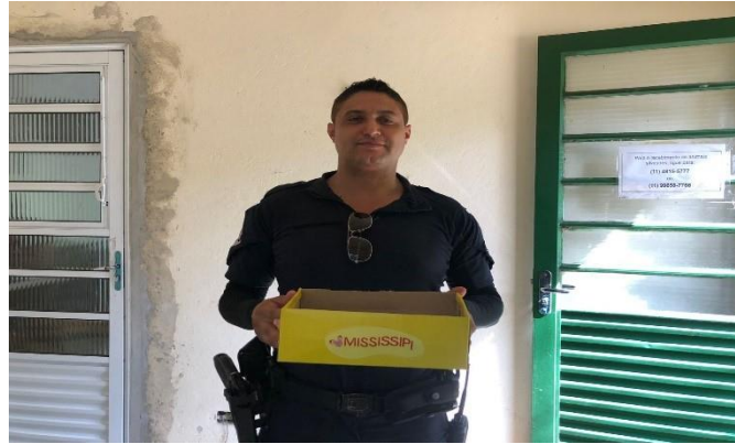
(47967 e 47968) - Maritacas, filhotes, animais caíram do ninho em laje de residência. Entregue por GM Itatiba no dia 18-01-2024