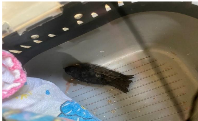
(47680) - Andorinha