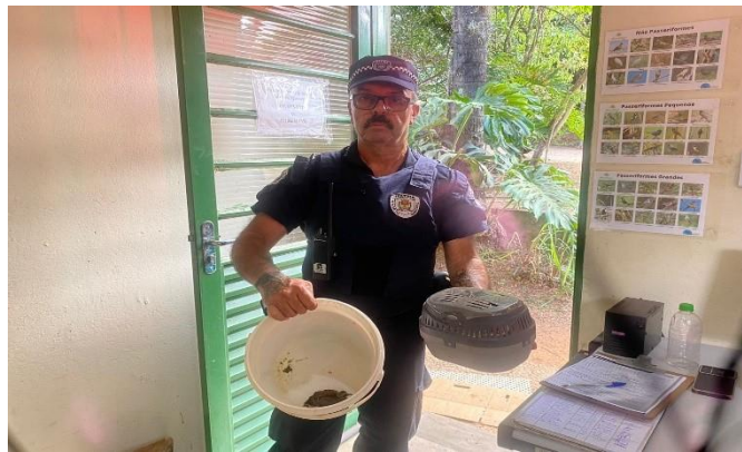
(47679) - Columbiforme, filhote, caiu do ninho. Entregue pela GM Itatiba no dia 06-01-2024