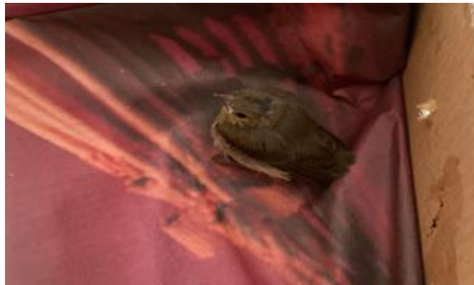
(47682) - Passeriforme, filhote caiu do ninho. Entregue pela GM Itatiba no dia 07-01-2024