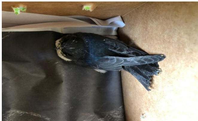
(47601) – Andorinha