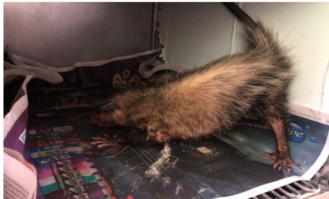
(48043) – Gambá de orelha preta