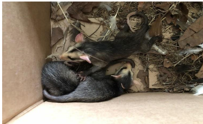
(48085 ao 48088) - gambás