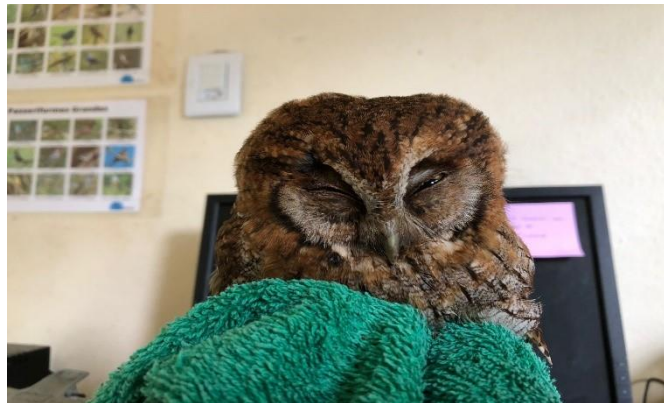
(47620) - Corujinha do mato