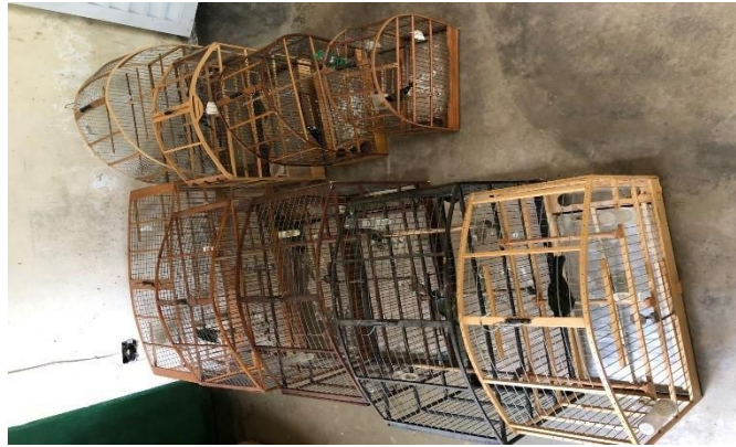
(48155 até 48162) Bigodinho, coleirinho, pintassilgo, azulão e trinca ferro