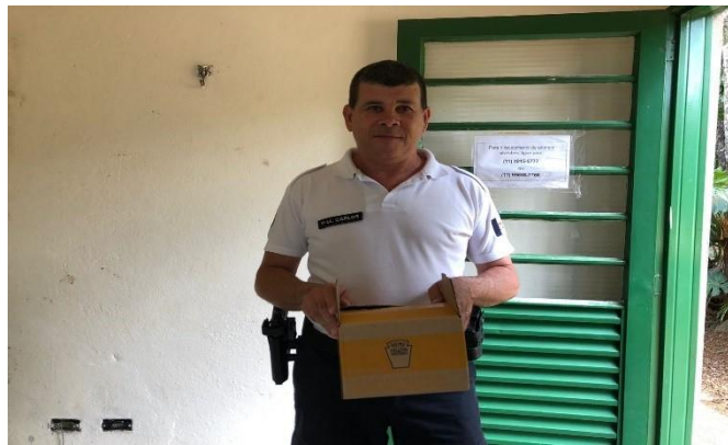
(47620) - Corujinha do mato, adulta, encontrado em chácara. Entregue pela GMA Itatiba no dia 03-01-2024