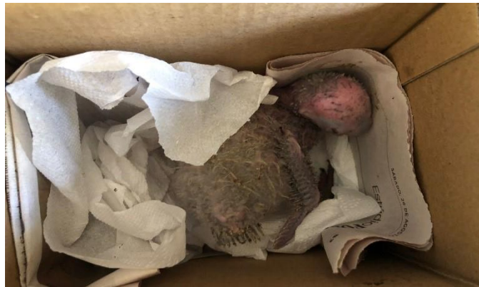
(47951) – Maritaca