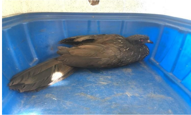
(48144) - Jacu