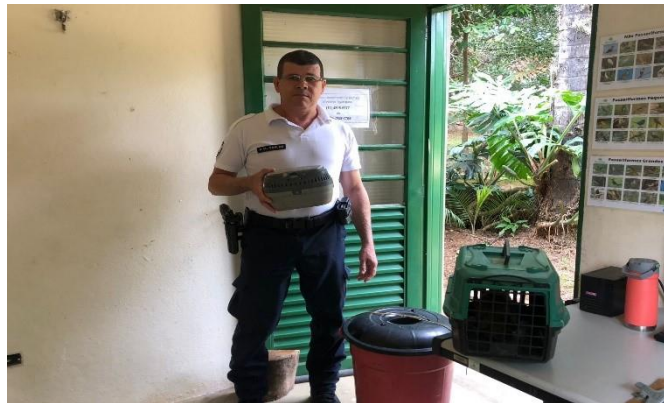
(48108) - Corujinha do mato, adulta, encontrada em pátio de loja; (48109) - Maritaca, adulta, sem histórico; (48110) – Gambá de orelha branca, adulto, atacado por cachorro. Entregue por GMA Itatiba no dia 26-01-2024