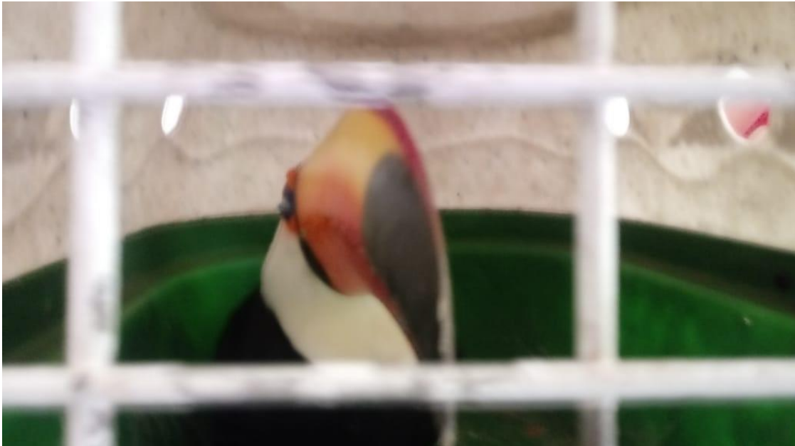
(47647) - Tucano-toco