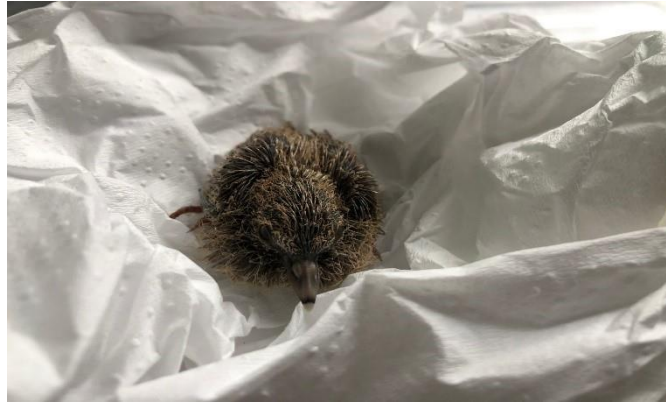
(48020) – Rolinha