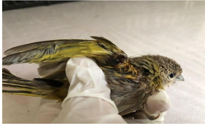
(47820) - Canário da terra