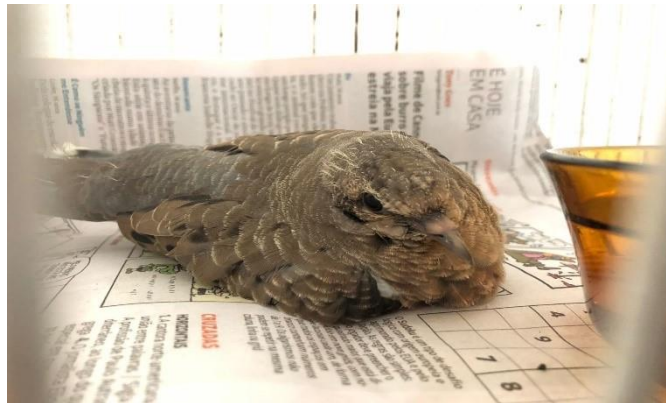
(48150) - Rolinha