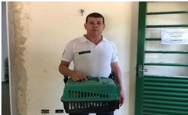
(47610) - Asa branca, jovem, encontrado em via pública. Entregue pela GMA Itatiba no dia 03-01-2024