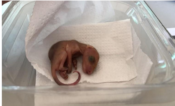
(47926) – Gambá