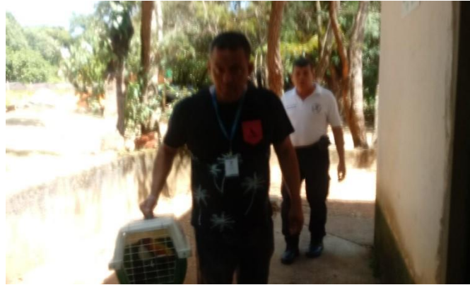
(47647) - Tucano-toco, encontrado caído em quintal de residência. Entregue pela prefeitura de Itatiba no dia 05-01-2024