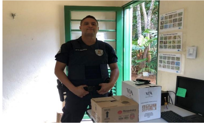
(48057) - Maritaca, adulta, encontrada na rua sem conseguir voar; (48058) - Rolinha, jovem, encontrada em prédio comercial. Entrega por GM Itatiba no dia 22-01-2024