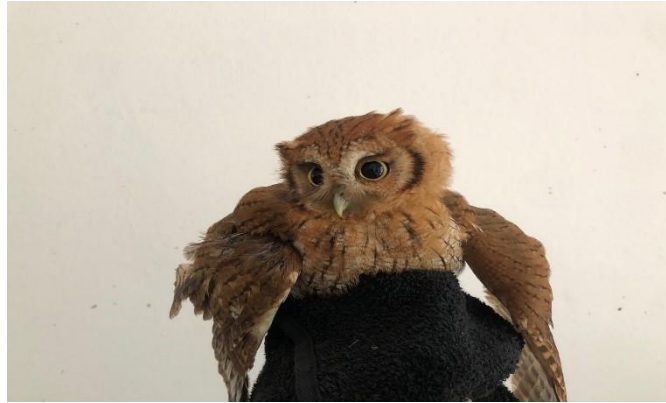
(48108) - Corujinha do mato