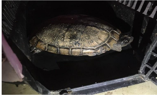
(48134) – Cagado