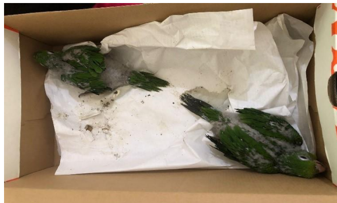
(47993 e 47994) – Maritaca