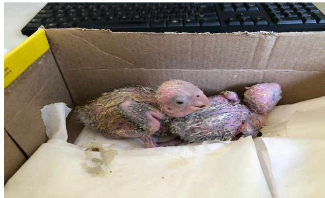
(47967 e 47968) – Maritacas