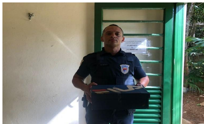
(47993 e 47994) - Maritaca, filhotes, encontrados em parque. Entrega por GM Itatiba no dia 19-01-2024