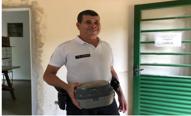
(47601) - Andorinha, jovem, encontrada em churrasqueira. Entregue pela GMA Itatiba no dia 02-01-2024