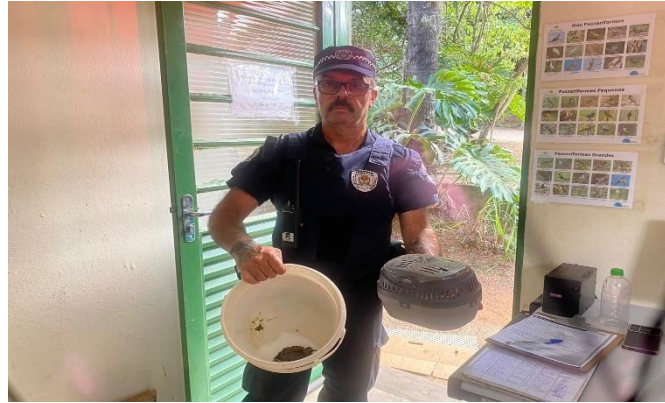
(47680) - Andorinha, caiu do ninho encontrado em quintal de casa. Entregue pela GM Itatiba no dia 06-01-2024