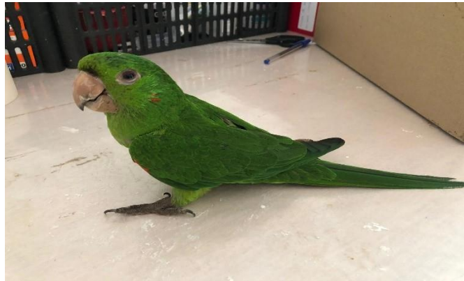
(47711) – Maritaca

(47711) - Maritaca, adulta, encontrada em quintal de residência e entregue na base e (47712) - GOP, adulto, macho, encontrado machucado em quintal de residência. Entregue pela GM Itatiba no dia 08-01-2024