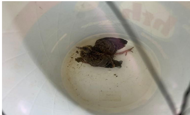
(47679) - Columbiforme