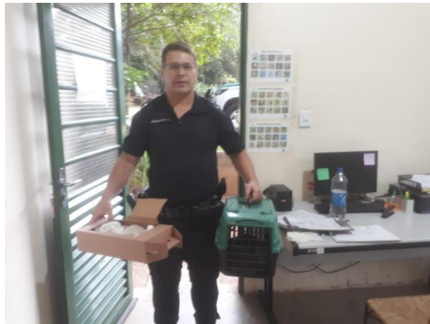
(48134) - Cagado, adulto, entrega voluntaria e (48135) - Canário, adulto, colisão com vidro Entregue por GM Itatiba no dia 27-01-2024