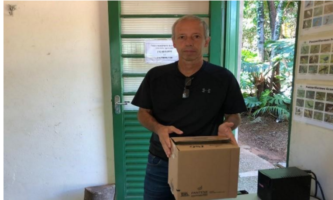
(47732 e 47733) - Columbiformes, filhotes, caíram do ninho durante a chuva. Entregue por município de Itatiba no dia 09-01-2024