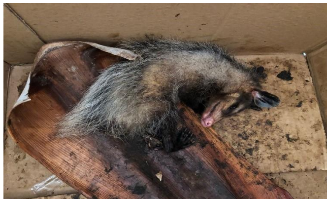
(47712) - GOP