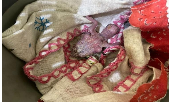
(47671) - Maritaca