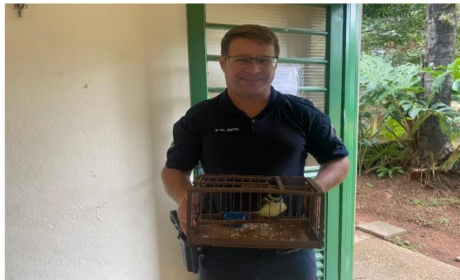
(47839) - Bem-te-vi, filhote, encontrado na rua. Entregue pela GM Itatiba no dia 13-01-2024