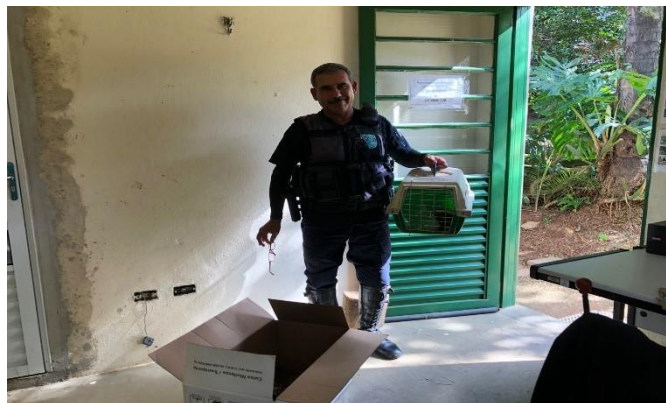
(48084) - Maritaca, adulta, encontrada em via pública sem conseguir voar e (48085 ao 48088) - gambás, filhotes, caíram de forro em escola. Entregue por GM Itatiba no dia 24-01-2024