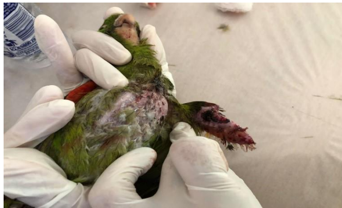
(48109) – Maritaca