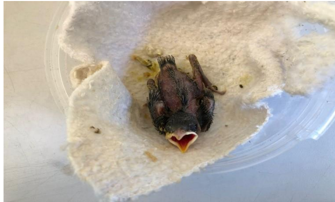
(47634) - Andorinha

(47634) - Andorinha, filhote, encontrado caído em quintal de residência e (47635) - Rolinha, encontrado caído em quintal de residência. Entrega pela GMA Itatiba no dia 04-01-2024