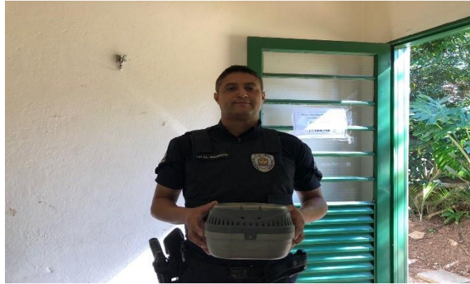
(48125) - Sanhaço do coqueiro, jovem, encontrado em via pública. Entregue por GM Itatiba no dia 26-01-2024