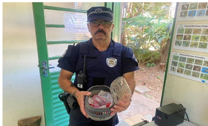
(47671) - Maritaca, animal neonato, encontrado no forro de município. Entregue pela GM Itatiba no dia 06-01-2024