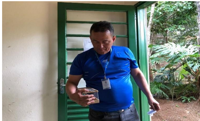
(47820) - Canário da terra, encontrado em via pública. Entregue por GM Itatiba no dia 12-01-2024