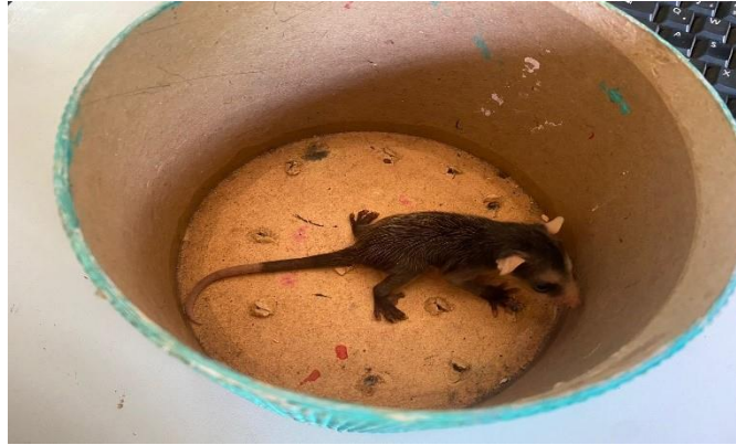
(48041) - Gambá