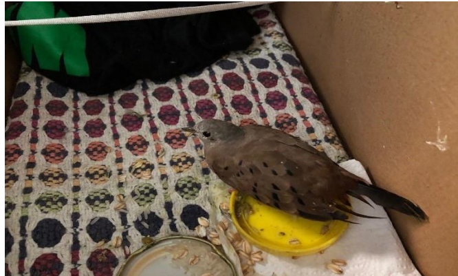
(47635) – Rolinha