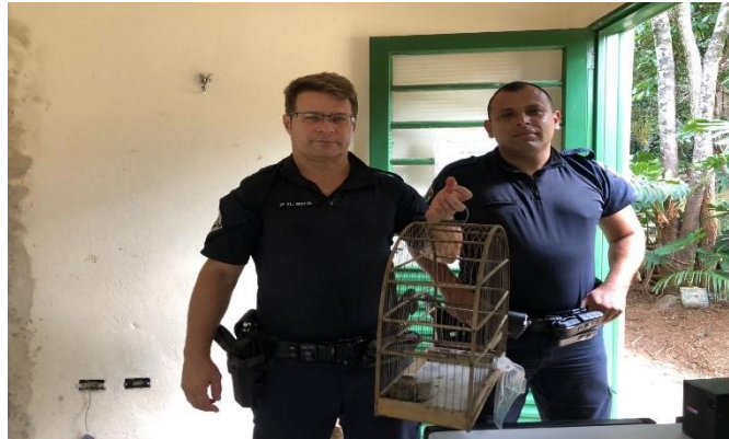
(47949) - Sabiá, jovem, encontrado em quintal. Entregue por GM Itatiba no dia 17-01-2024