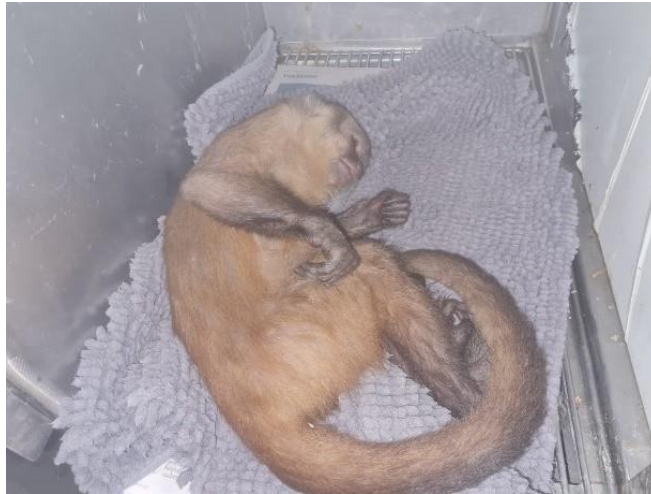
(49536) Macaco prego jovem.