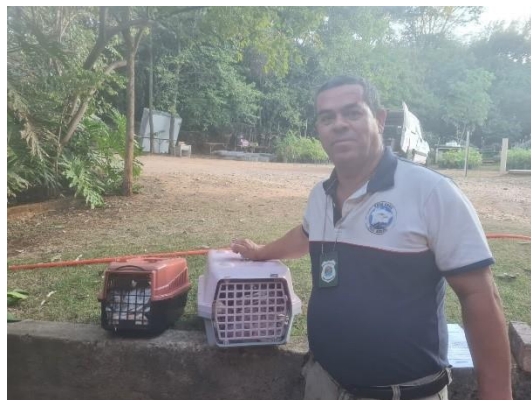
(49536) Macaco-prego, jovem, animal encontrado em pesqueiro, entregue por Prefeitura de Indaiatuba, no dia 17/06/2024.