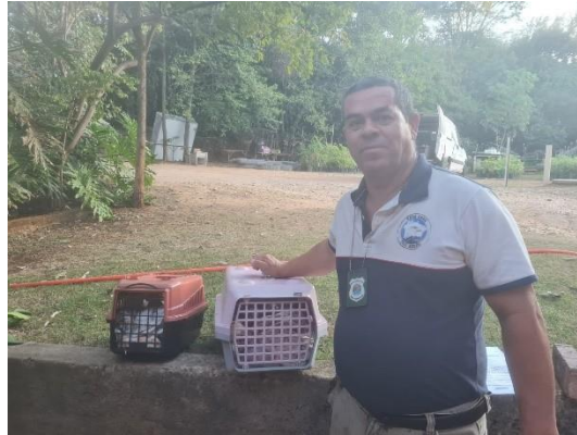
(49535) Coruja-orelhuda, adulta, animal encontrado sem voar, entregue por Prefeitura de Indaiatuba, no dia 17/06/2024.