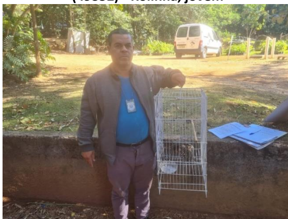
(49440) - Falcão de coleira, animal encontrado em via pública, trazido por secretaria do Meio Ambiente de Indaiatuba no dia 29-05-2024