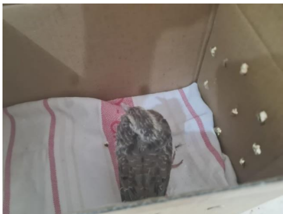
(49352) - Rolinha, jovem