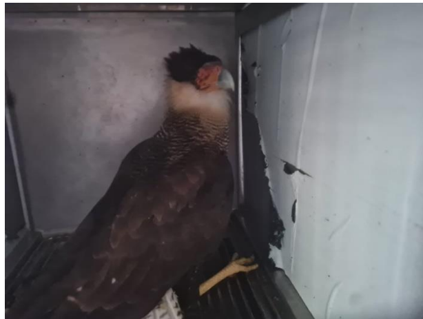
(49344) - Carcará, adulto