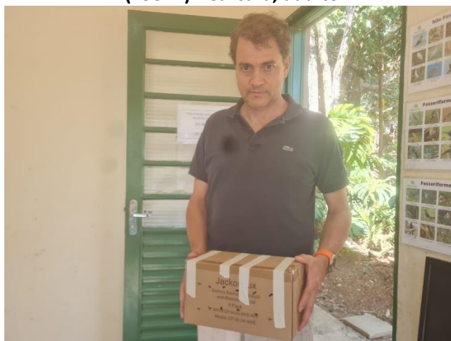
(49352) - Rolinha, jovem, animal encontrado em residência, entregue por munícipe de Indaiatuba no dia 13-05-2024