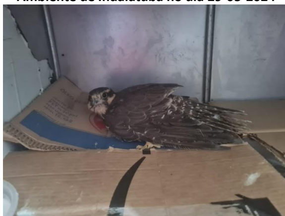
(49440) - Falcão de coleira