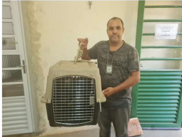
(49344) - Carcará, adulto, sem histórico, entregue pela Secretaria de Indaiatuba no dia 11-05-2024