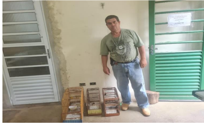
(49184 e 49185) Canário da terra, macho e fêmea, (49186) Pintassilgo, (49187) Coleirinho entrega legalizada, trazido por CRA, Indaiatuba, 12-04-2024