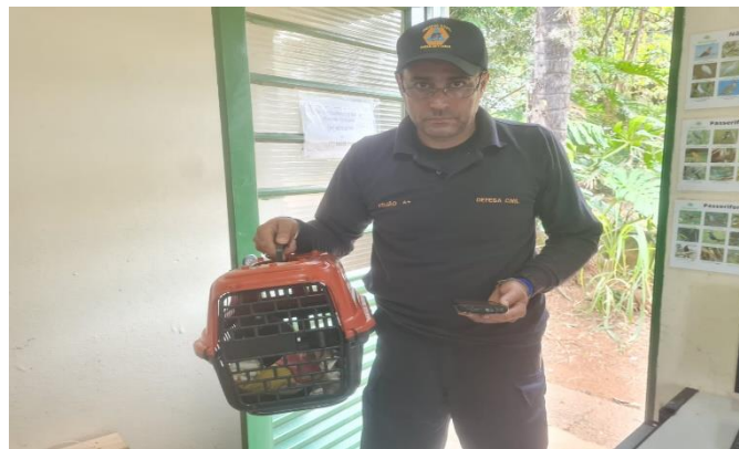
(49194) Sagui, adulto, caiu de árvore e foi atacado por gato, trazido pela Defesa Civil, Indaiatuba, 14-04-2024