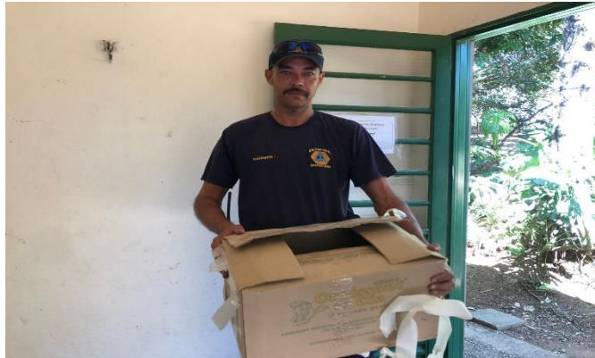
(49231)-Cachorro-do-mato, adulto, encontrado em trilha, ferido e com dificuldade de locomoção, entregue pela Defesa Civil, Indaiatuba, 21-04-2024