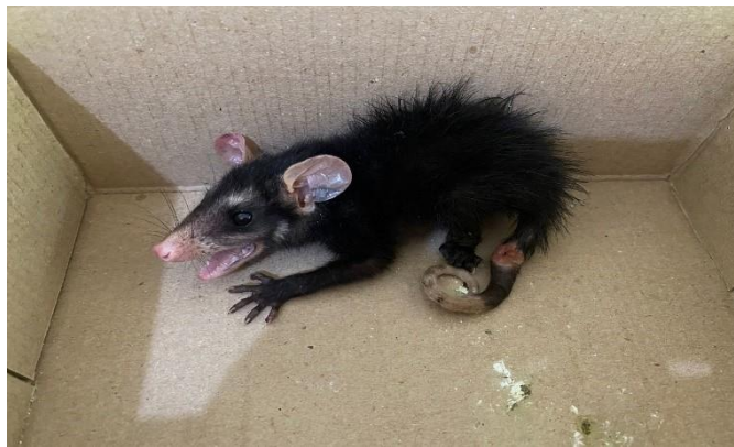
(48343) – GOP