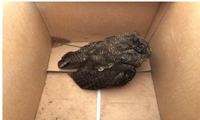
(48533) - Corujinha do mato