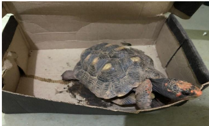
(48566) – jabuti