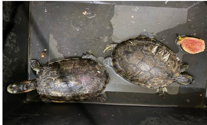
(48526 e 48527) - Tigres d'agua, encontrados na rua. Entregue por GM Campo Limpo Paulista no dia 22-02-2024