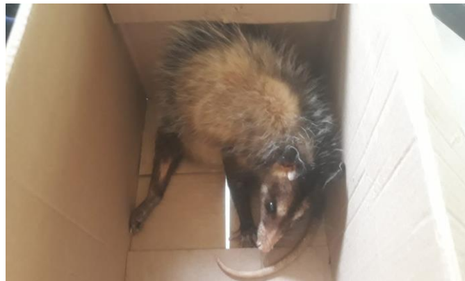
(48211) – GOP