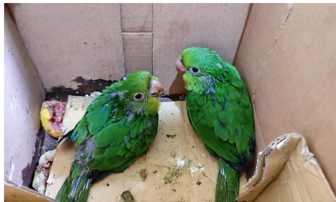
(48244 e 48245) - Maritaca, filhotes órfãos em situação de tráfico. Entregue por GCM Campo Limpo Paulista no dia 04-02-2024