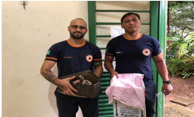
(48566) - jabuti, jovem, encontrado em quintal de residência. Entregue por defesa civil de campo limpo paulista no dia 24-02-2024