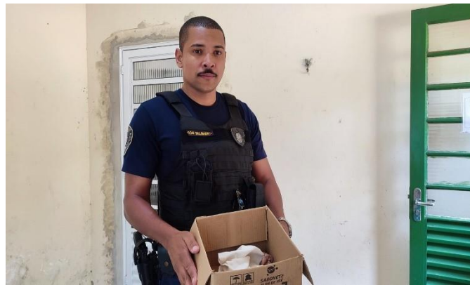
(48457 à 48459) - Gambas, neonato, encontrado durante patrulha, mãe em obito. Entregue por GCM Campo Limpo Paulista no dia 19-02-2024