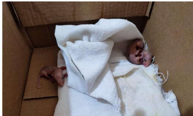
(48457 à 48459) – Gambas