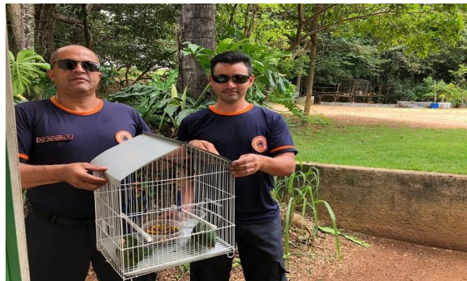
(48198 e 48199) - Maritacas, jovens, encontradas em quintal de residência. Entrega por defesa civil de campo limpo paulista no dia 01-02-2024