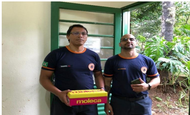
(48403) - Andorinha, jovem, gato de munícipe pegou animal na boca. Entregue por defesa civil de campo limpo paulista no dia 14-02-2024