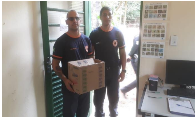
(48211) - GOP, adulto, ataque de cachorro. Entregue por defesa civil de campo limpo paulista no dia 02-02-2024