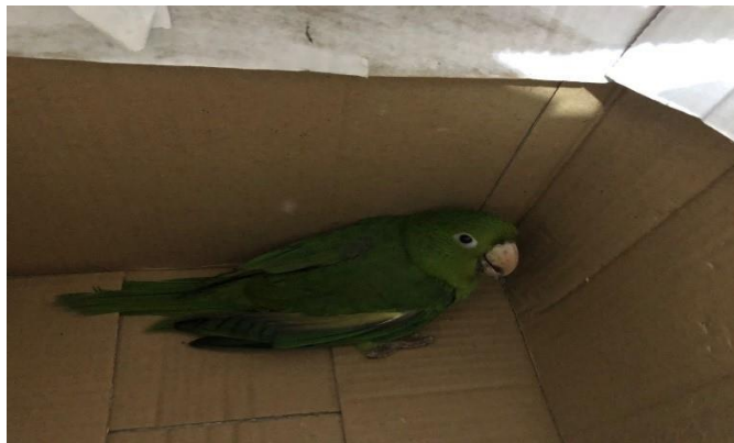
(48567) - Maritaca, jovem, encontrada caída em quintal de residência. Entregue por defesa civil de campo limpo paulista no dia 24-02-2024