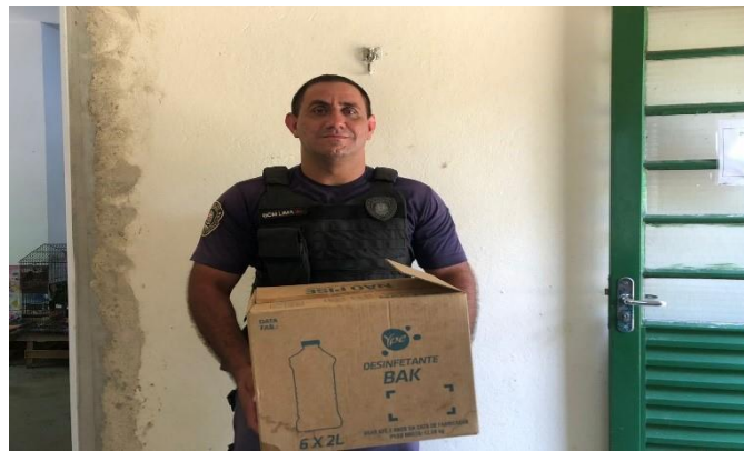
(48533) - Corujinha do mato, adulto, encontrado em quintal com fratura. Entregue por GM Campo Limpo Paulista no dia 23-02-2024