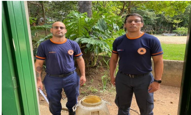
(48343) - GOP, filhote, com lesão. Entregue por defesa civil de campo limpo paulista no dia 10-02-2024