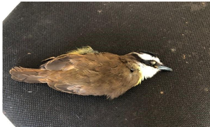
(48579) - Bem te vi