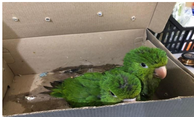
(48198 e 48199) – Maritacas