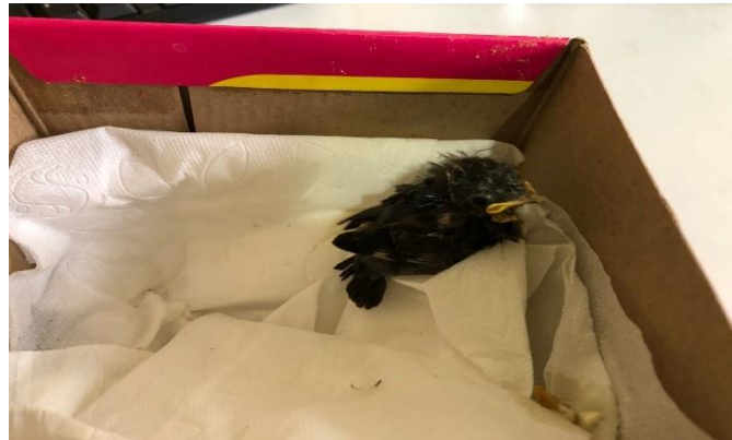
(48403) – Andorinha