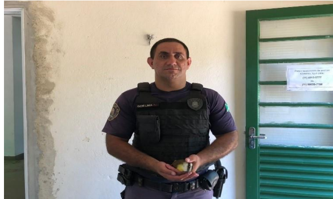
(48579) - Bem te vi, jovem, entregue em obito. Entregue por GM Campo Limpo Paulista no dia 25-02-2024