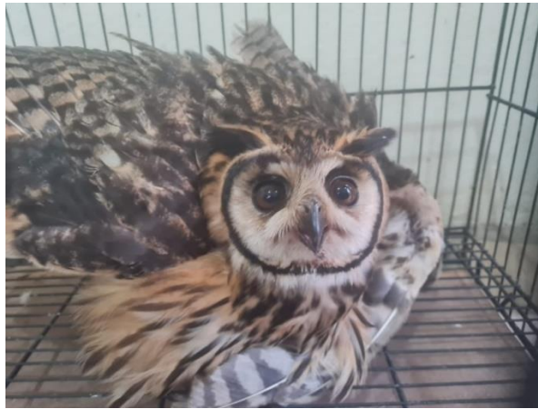
(49424) - Coruja-orelhuda, adulta