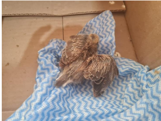
(49418) - Rolinha, filhote