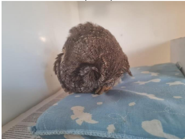
(49442) - Corujinha do mato, adulta