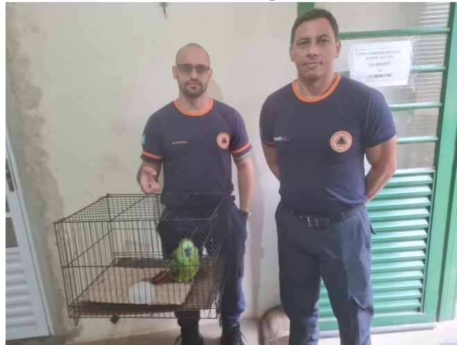
(49355) - Papagaio-verdadeiro, adulto, encontrado em residência, foi atacado por cachorro, possivelmente fugiu de outra residência, entregue por Defesa Civil de Campo Limpo Paulista no dia 14-05-2024