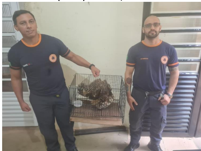
(49424) - Coruja-orelhuda, adulta, apresenta lesão em asa, entregue por Defesa Civil de Campo Limpo Paulista no dia 24-05-2024