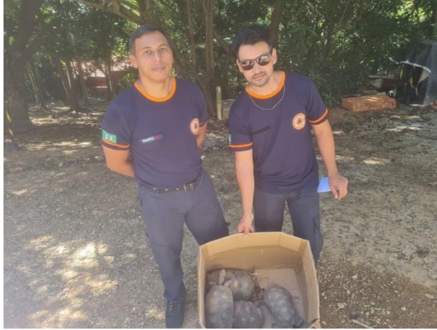
(49322, 49323, 49324 e 49325) - Jabutis, adultos, encontrados em rodovia, entregue pela Defesa Civil de Campo Limpo Paulista no dia 08-05-2024