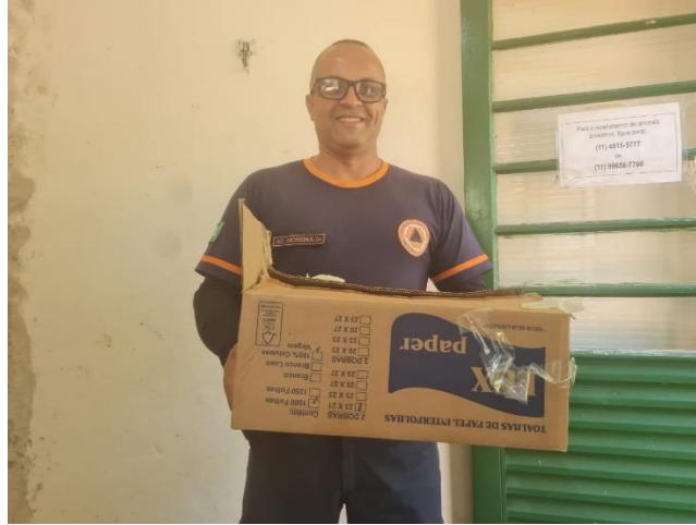
(49418) - Rolinha, filhote, encontrado em via pública, entregue por Defesa Civil de Campo Limpo Paulista no dia 23-05-2024