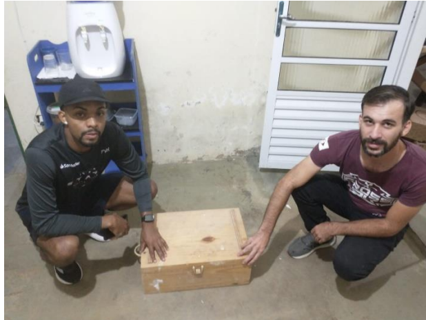
(49348) - Tatu-galinha, animal atropelado com lesão na carapaça, entregue por munícipes de Campo Limpo Paulista no dia 12-05-24