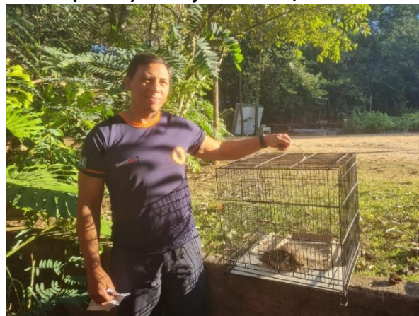
(49442) - Corujinha do mato, adulta, animal encontrado em residência, possível colisão, trazido por Defesa Civil de Campo Limpo Paulista no dia 29-05-2024