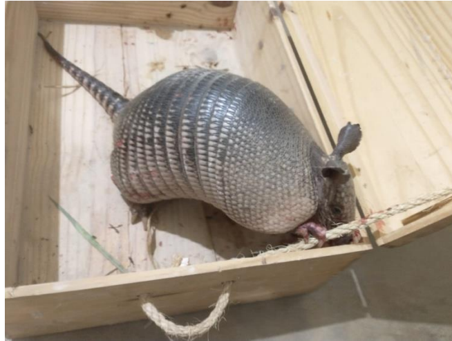
(49348) - Tatu-galinha