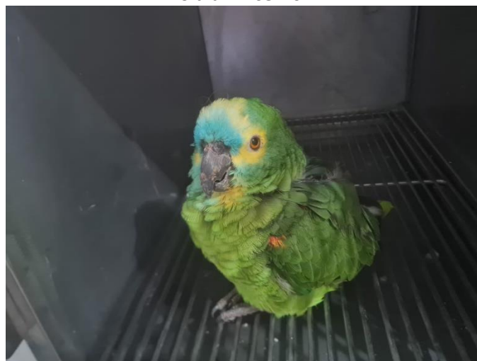
(49355) - Papagaio-verdadeiro, adulto