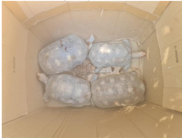
(49322, 49323, 49324 e 49325) - Jabutis, adultos