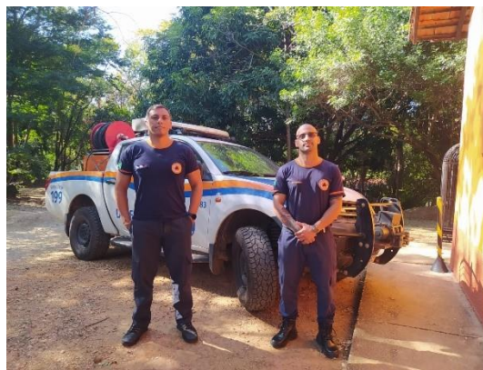
(49503) Maritaca, adulto, encontrado no quintal de residência, entregue por Defesa de Campo Limpo Paulista, no dia 11/06/2024.