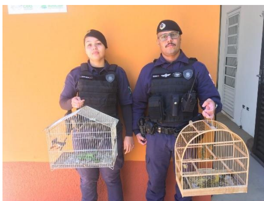
(49567) Canário-da-terra, adulto, denuncia de maus tratos, ambiente insalubre, entregue por GCM de Campo Limpo Paulista, no dia 23/06/2024.