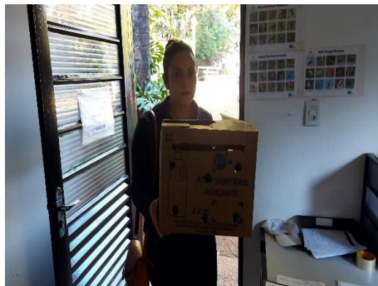
(49501) Asa-branca, jovem, animal resgatado após cair do ninho, mantido por cuidados humanos por 3 meses, entregue por munícipe de Campo Limpo Paulista, no dia 11/06/2024.