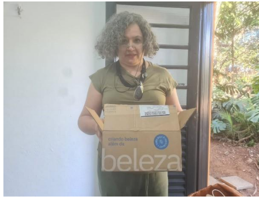
(49573) Esquilo, filhote, encontrado em residência, entregue por munícipe de Campo Limpo Paulista, no dia 24-06-24.