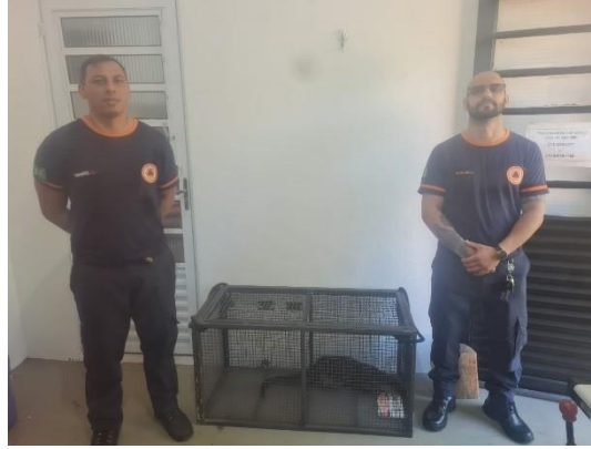
(49469) Lontra, adulta, animal encontrado em via pública, entregue por Defesa Civil de Campo Limpo Paulista, no dia 05/06/2024.