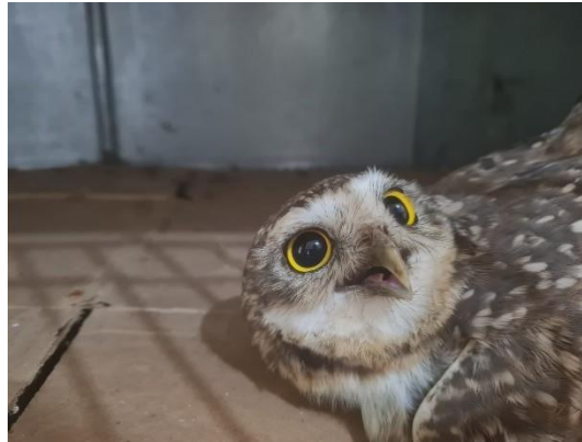
(49591) Coruja- buraqueira.