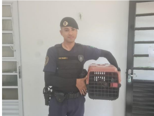
(49591) Coruja-buraqueira, jovem, animal encontrado em residência, entregue por GM de Campo Limpo Paulista, no dia 27/06/2024.