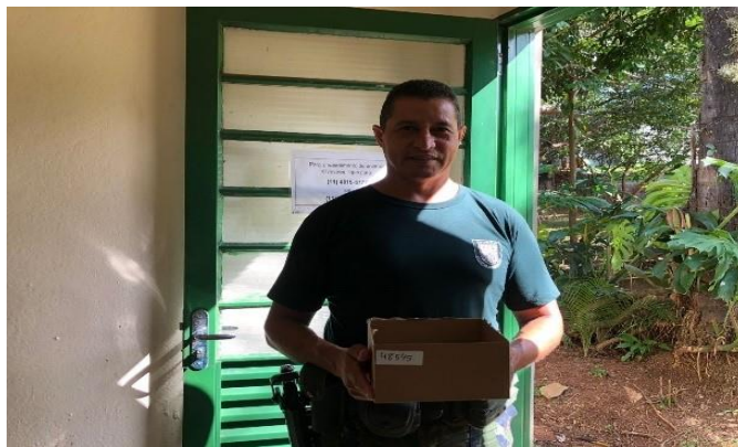
(48545) - Maritaca, jovem, encontrado em via pública. Entregue por GM Cajamar no dia 23-02-2024