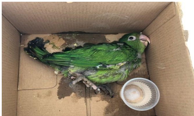
(48545) – Maritaca