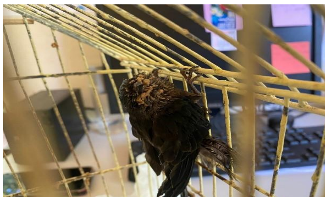
(48337) - Andorinhão do temporal

(48337) - Andorinhão do temporal, jovem, cuidados humanos por 3 meses. Entregue por município Cajamar no dia 10-02-2024