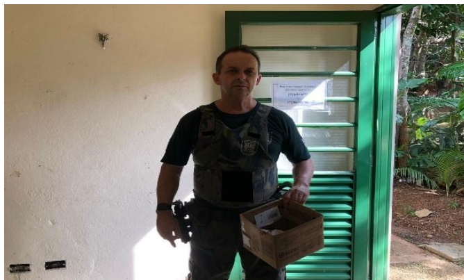
(48481) - Pardal, filhote, encontrado caído em via pública. Entregue por GM Cajamar no dia 20-02-2024