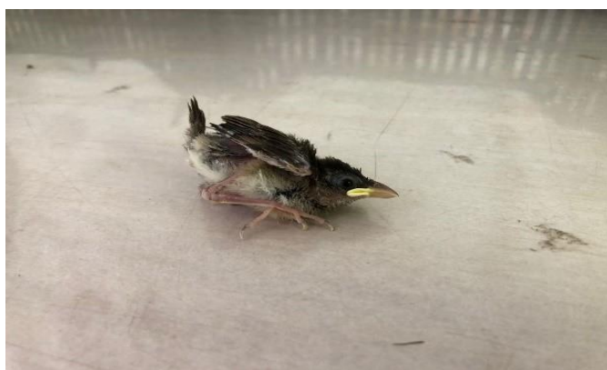
(48481) – Pardal