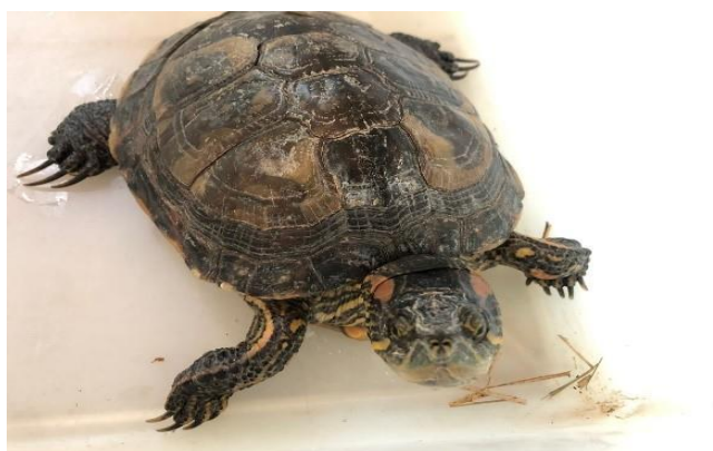
(48261) - Tigre d'agua