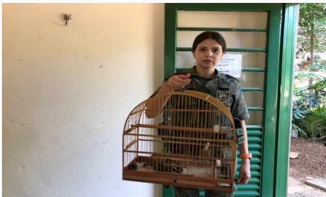
(48610) Bem Te Vi, adulto, encontrado caído. Entregue por GM de Cajamar no dia 27-02-2024