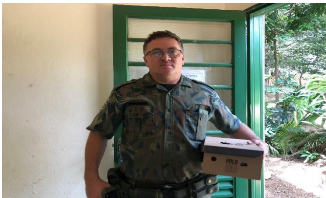
(48631) Maritaca, filhote, encontrado dentro de residência. Entregue por GM de Cajamar no dia 28-02-2024