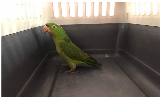
(48321) – Maritaca

(48321) - Maritaca, adulta, encontrado em quintal de residência, possível PET. Entregue por GM Cajamar no dia 08-02-2024