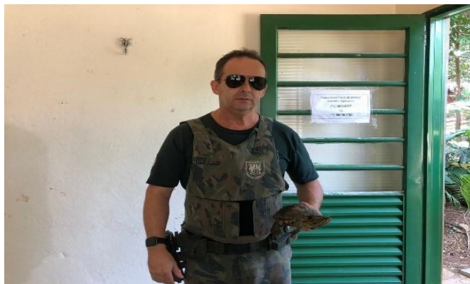
(48261) - Tigre d'agua, encontrado em via pública. Entregue por GCMA Cajamar no dia 06-02-2024