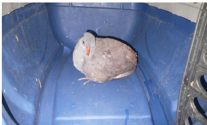
(48586) – Inhambu