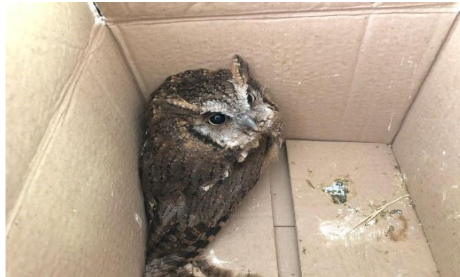
(48521) - corujinha do mato