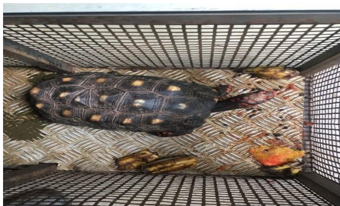
(48438) – Jabuti