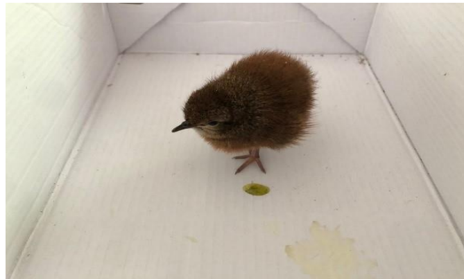
(48522) – Tururim