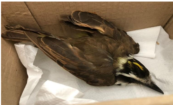
(48610) Bem Te Vi