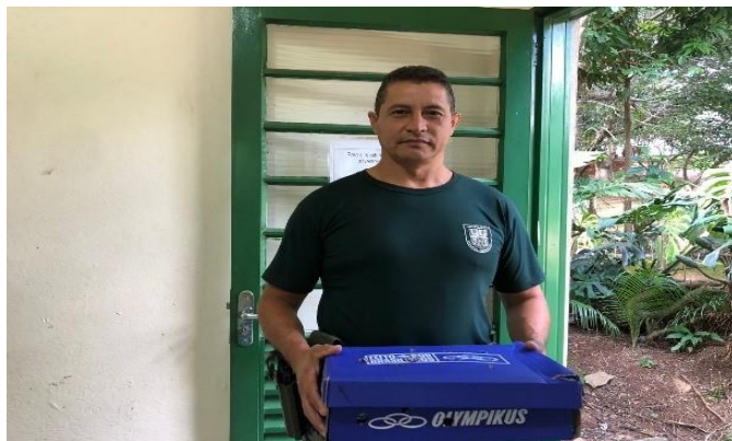
(48531) - Pardal, jovem, encontrado caído em via pública. Entregue por GM Cajamar no dia 23-02-2024