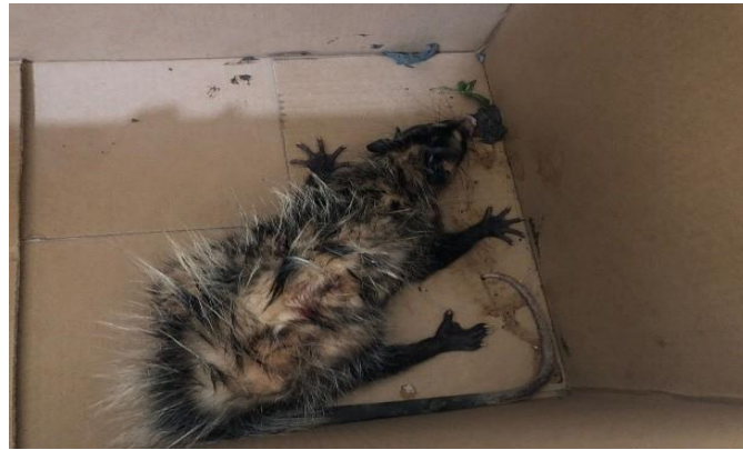
(48472) – Gambá de Orelha Preta