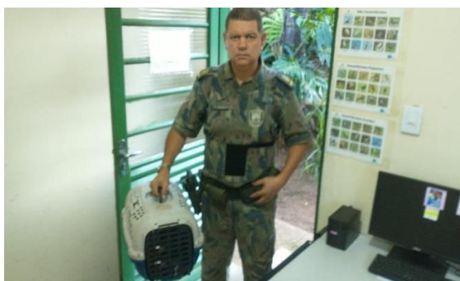
(48586) - Inhambu, encontrado em via pública. Entregue por GM Cajamar no dia 25-02-2024