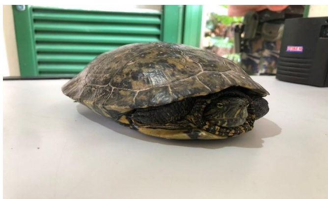
(48648) Tigre d'água