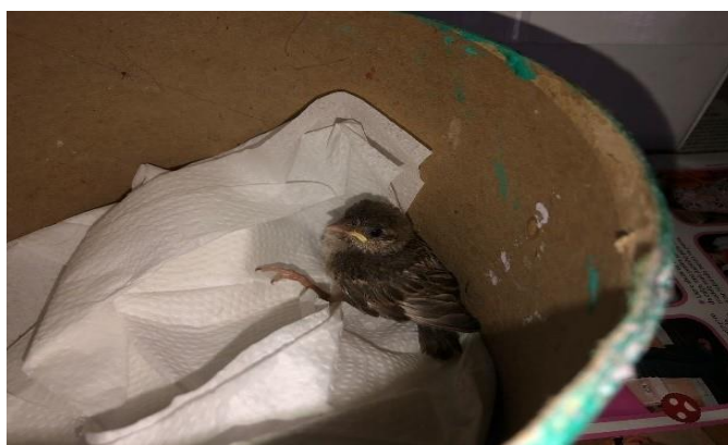
(48531) – Pardal