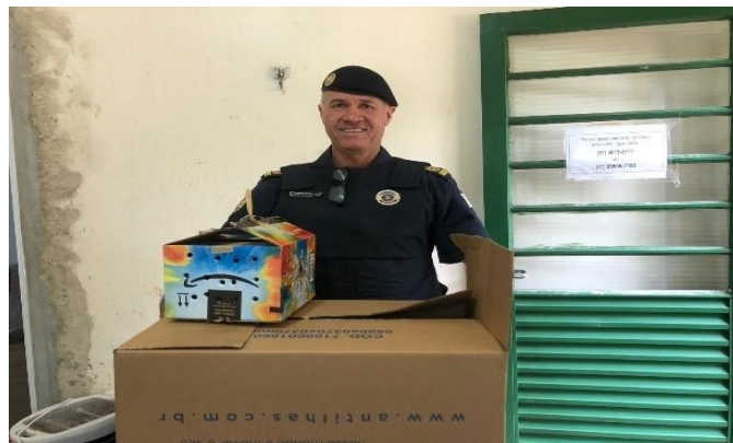
(48473) - Maritaca, adulta, encontrada enrolada em linha de pipa em via pública. Entregue por GM Cajamar no dia 20-02-2024