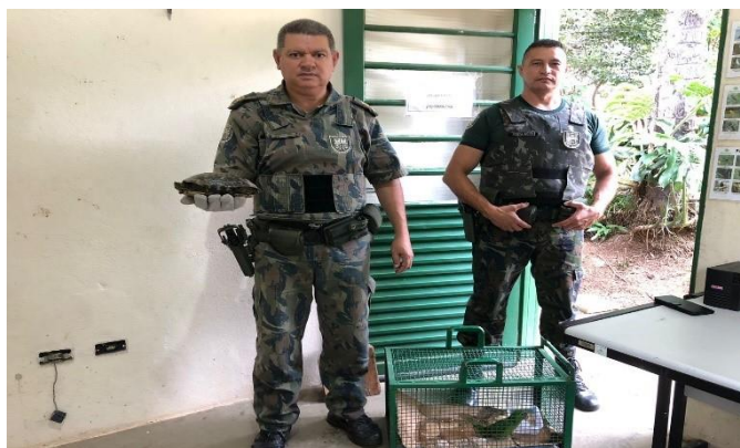
(48648) Tigre d'água, adulto, encontrado em avenida. Entregue por GM de Cajamar no dia 29-02-2024