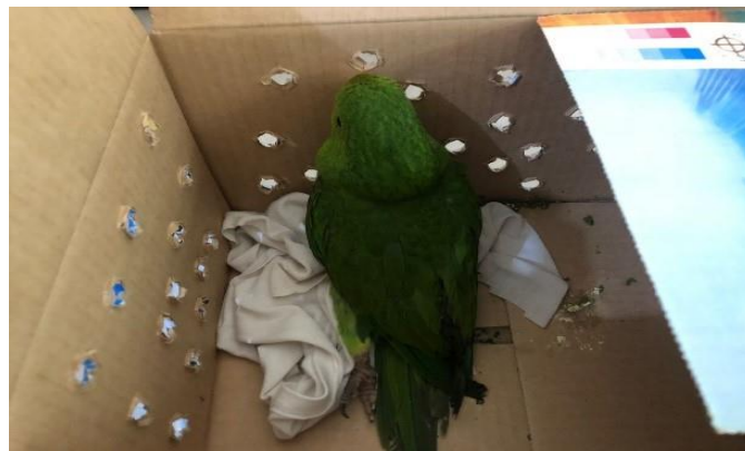
(48473) – Maritaca