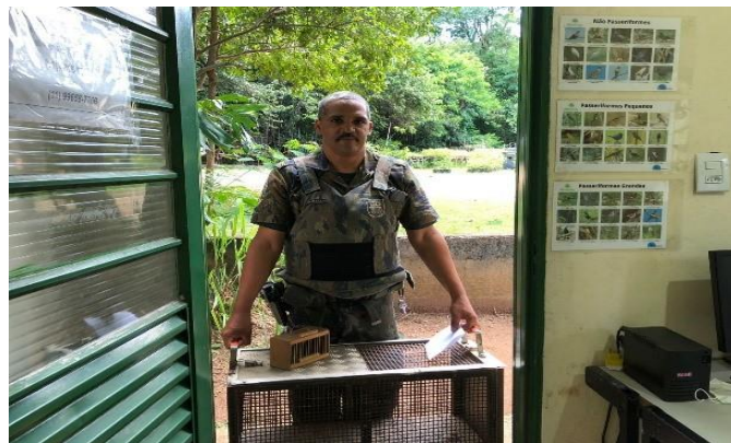
(48522) - Tururim, filhote encontrado em via pública. Entregue por GM Cajamar no dia 22-02-2024