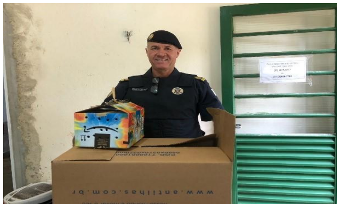
(48472) – Gambá de Orelha Preta, adulto, encontrado em quintal de residência, possível ataque de cão. Entregue por GM Cajamar no dia 20-02-2024