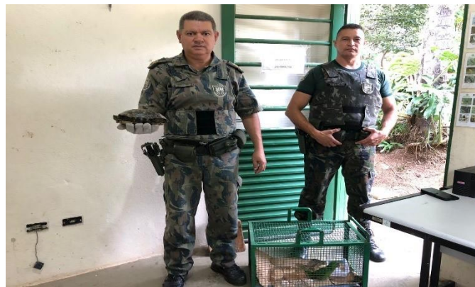
(48647) Maritaca, jovem, sem histórico. Entregue por GM de Cajamar no dia 29-02-2024