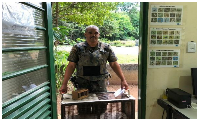
(48521) - Corujinha do mato, adulta, encontrada ainda filhote e cuidada por 3 meses. Entregue por GM Cajamar no dia 22-02-2024