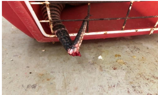
(48878) -Tatu galinha