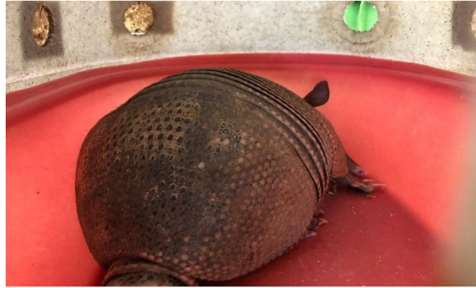
(48878) -Tatu galinha

(48878) -Tatu galinha, adulto, encontrado frente loja, com fratura em cauda e secreção saindo das narinas, animal reativo ao manejo. Entregue pela defesa civil de Cabreúva no dia 12-03-2024