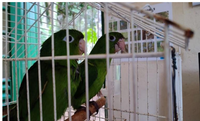
(48836 e 48837) -Maritacas