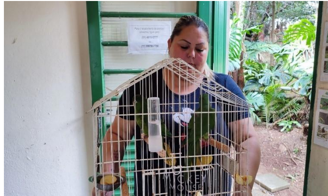
(48836 e 48837) -Maritacas, adultas, encontradas em escola, uma apresenta a asa cortada e a outra tem pata em necrose. Entregue por munícipe de Cabreúva no dia 09-03-2024