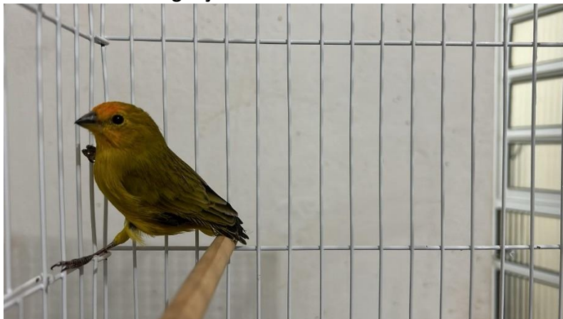
(49329) - Canário-da-terra, adulto, macho, entrega voluntária de Bragança Paulista no dia 08-05-2024