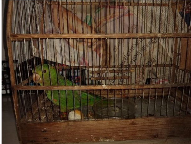
(49431) - Maritaca, resgate de Bragança Paulista no dia 25-05-2024