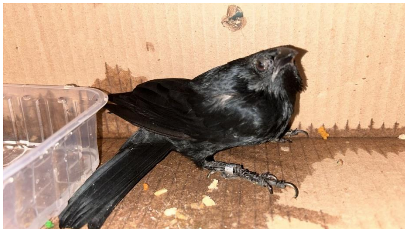
(49337) - Graúna, animal sem histórico, resgate de Bragança Paulista no dia 09-05-2024