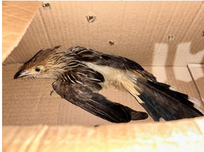
(49385) - Anú-branco, animal sem histórico, resgate de Bragança Paulista no dia 16-05-2024