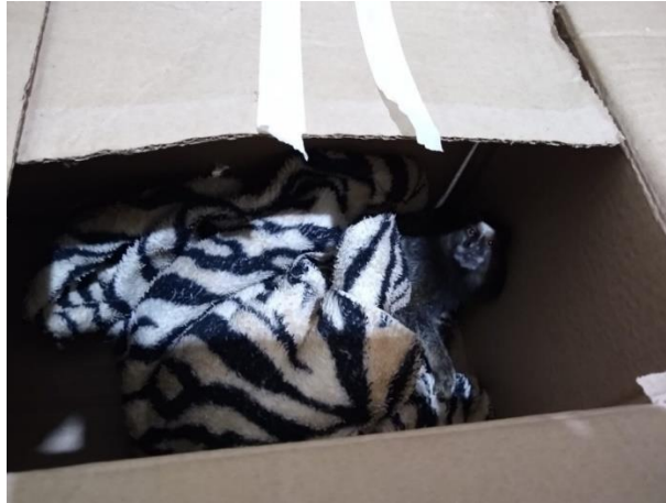
(49432) - Sagui, resgate de Bragança Paulista, 25-05-2024