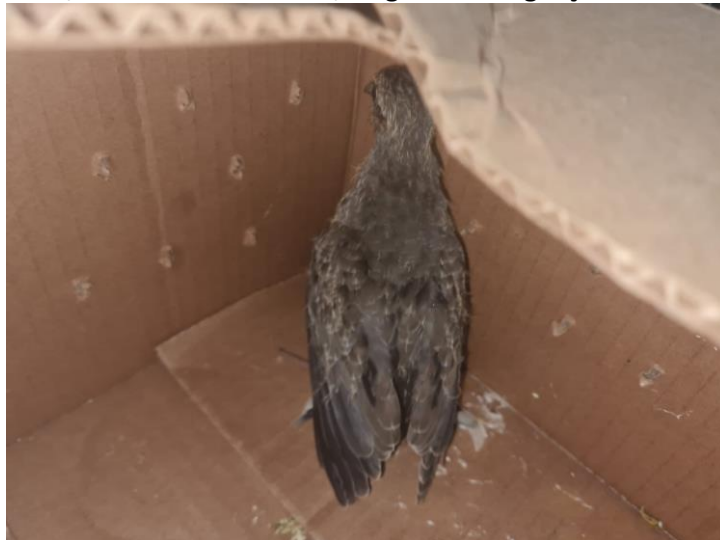
(49400) - Avoante, jovem, sem histórico, resgate de Bragança Paulista no dia 20-05-2024