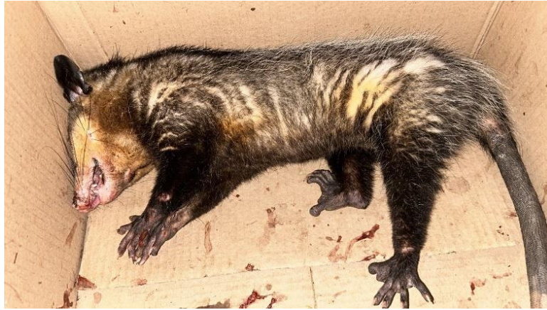
(49338) - Gambá-de-orelha-preta, animal sem histórico, resgate de Bragança Paulista no dia 09-05-2024