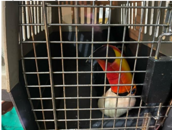
(49439) - Tucano-toco, animal encontrado embaixo de carro, resgate de Bragança Paulista no dia 28-05-24