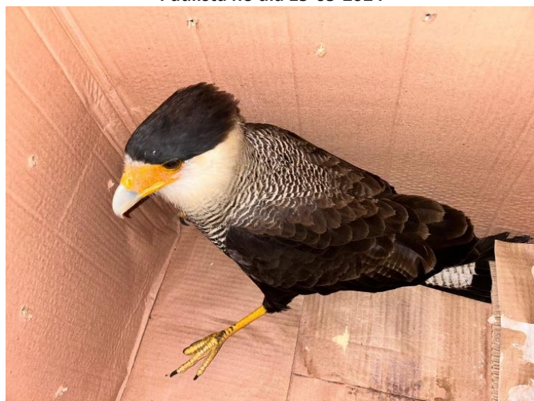
(49384) - Carcará, adulto, animal sem histórico, resgate de Bragança Paulista no dia 16-05-2024