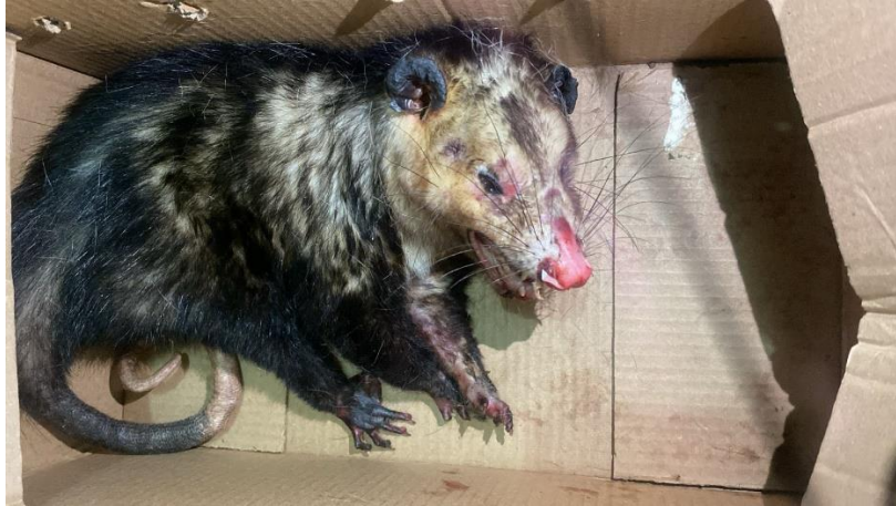
(49318) - Gambá-de-orelha-preta, adulto, animal com lesões no corpo, entregue por SEMA de Bragança Paulista no dia 06-05-2024