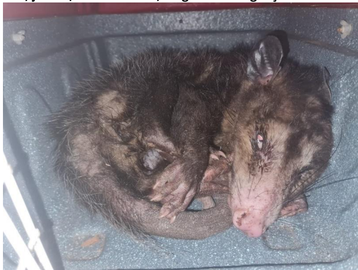
(49423) - Gambá-de-orelha-preta, adulto, sem histórico, resgate de Bragança Paulista no dia 24-05-2024