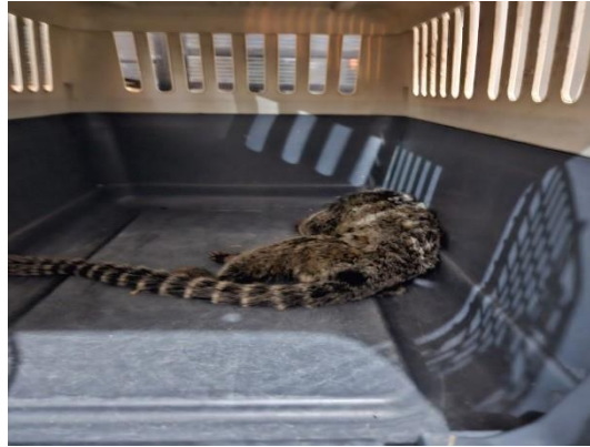
(49542) Sagui-de-tufo-preto, macho, adulto, sugestivo de eletrocussão, proveniente de Bragança Paulista, entregue pela AMC, no dia 18/06/2024.