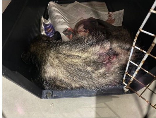
(49577) Gambá-de-orelha-preta, adulto, prostrado, apresenta laceração em região dorso-caudal, proveniente de Bragança Paulista, entregue pela AMC, no dia 24/06/2024.