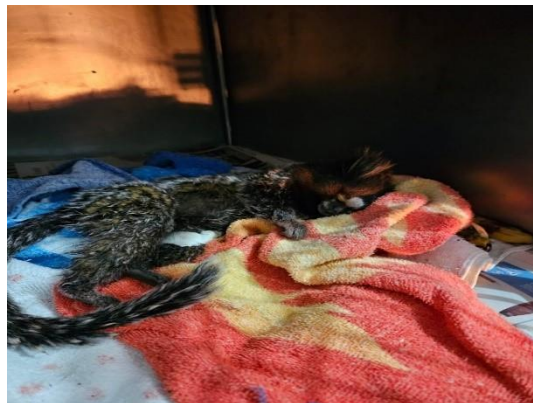
(49541) Sagui adulto, fêmea gestante, realizou aborto espontâneo ao chegar e evoluiu a óbito, proveniente de Bragança Paulista, entregue pela AMC, no dia 18/06/2024.