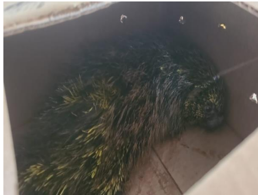
(49598) Ouriço Cacheiro, animal foi vítima de atropelamento, entregue por Secretaria do Meio Ambiente de Bragança Paulista a AMC, no dia 28/06/2024.