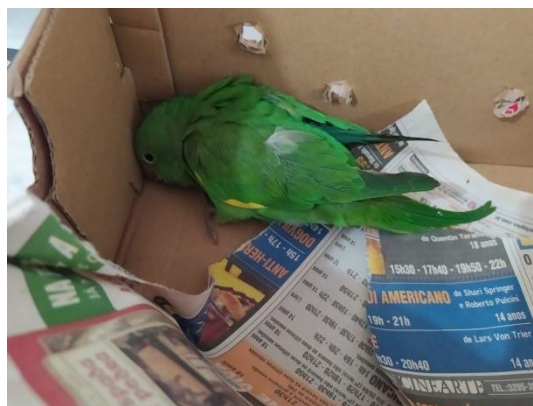
(49630) Periquito-de-encontro-amarelo, animal sem histórico, proveniente de Bragança Paulista, entregue pela AMC, no dia 29/06/2024.