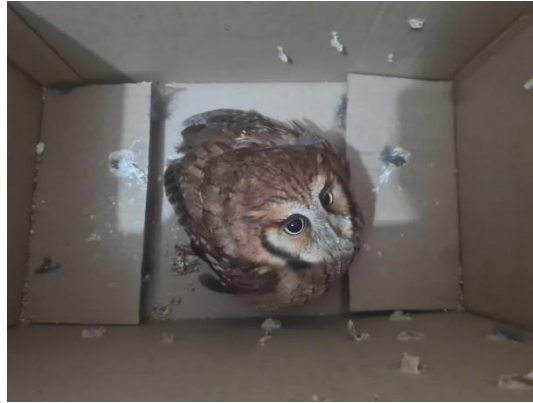
(49497) Corujinha-do-mato, adulta, animal encontrado em via pública sem voar, proveniente de Bragança Paulista, entregue pela AMC, no dia 10/06/2024.