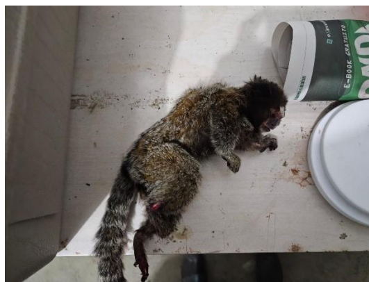
(49544) Sagui-de-tufo-preto, fêmea, adulta, sugestivo de eletrocussão, animal apresenta queimadura de terceiro grau, carbonização em membros pélvicos e hemorragia em cavidade oronasal, proveniente de Bragança Paulista, entregue pela AMC, no dia 18/06/2024.