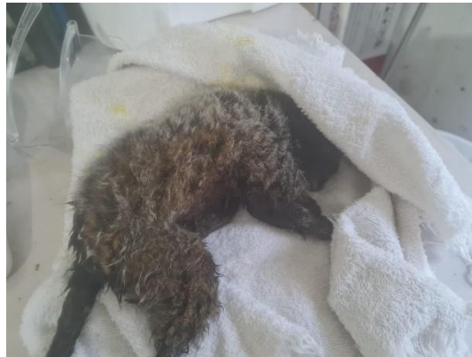
(49537) Sagui-de-tufo-preto, animal sem histórico, proveniente de Bragança Paulista, entregue pela AMC, no dia 17/06/2024.