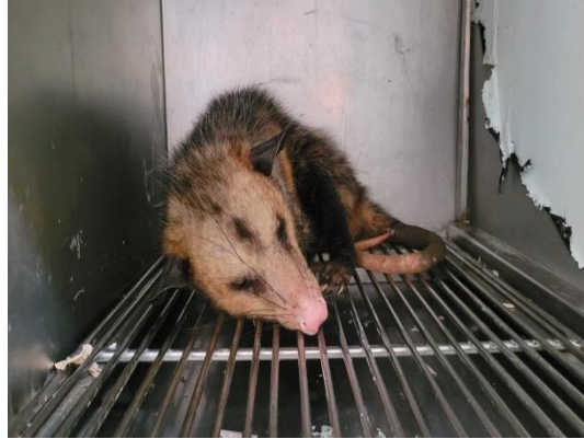
(49454) Gambá-de-orelha-preta, macho, animal sem histórico, proveniente de Bragança Paulista, entregue pela AMC, no dia 01/06/2024.