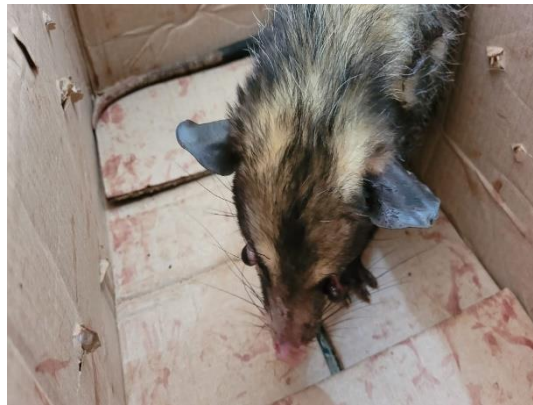
(49455) Gambá-de-orelha-preta, macho, animal chegou com glóbulos oculares para fora, proveniente de Bragança Paulista, entregue pela AMC, no dia 01/06/2024.