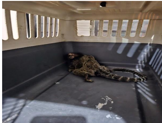
(49543) STP macho, adulto, sugestivo de eletrocussão, proveniente de Bragança Paulista, entregue pela AMC, no dia 18/06/2024.