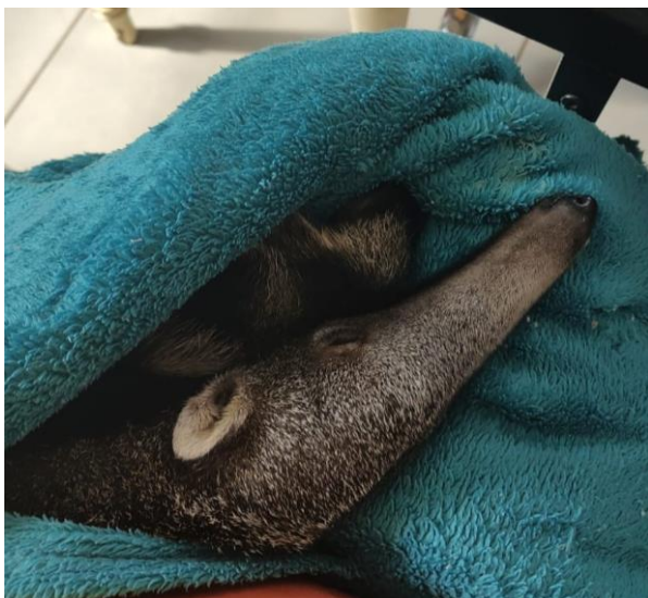
Tamanduá-bandeira RG2007, fêmea filhote encontrada em dorso de mãe morta no município de Lucélia.