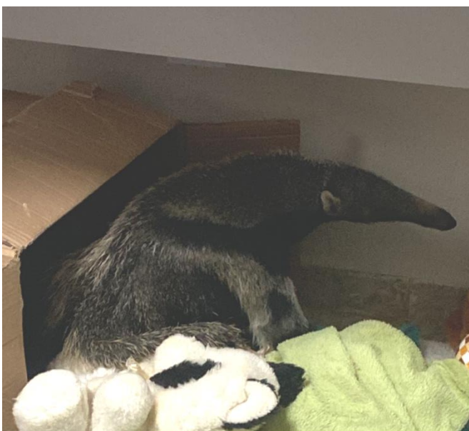
Tamanduá-bandeira RG2007, fêmea filhote encontrada em dorso de mãe morta no município de Lucélia.