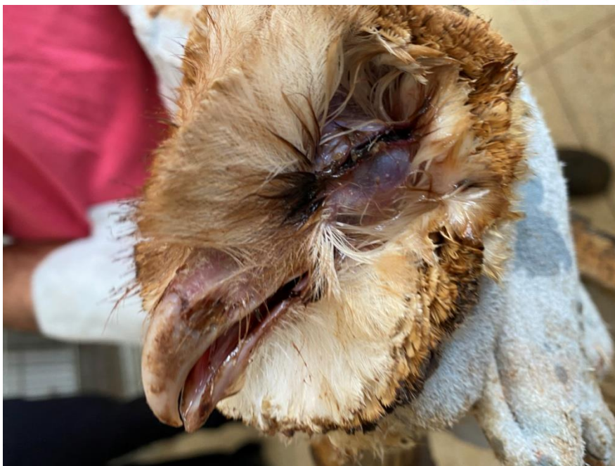
Suindara RG2011, adulto apático com trichomonas e olhos encrostados.