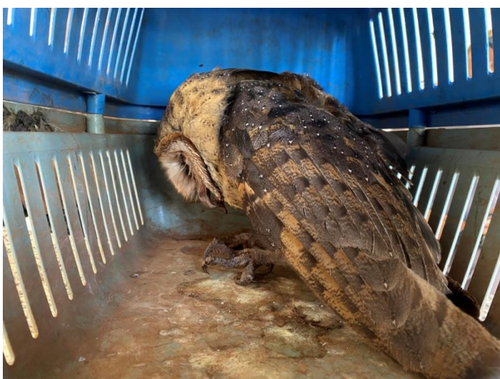
Suindara RG2011, adulto apático com trichomonas e olhos encrostados.