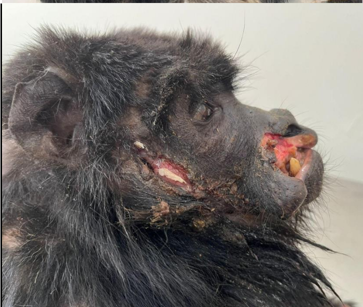
Bugio-preto RG 2010, macho idoso encontrado em Buritama após briga intraespecífica.