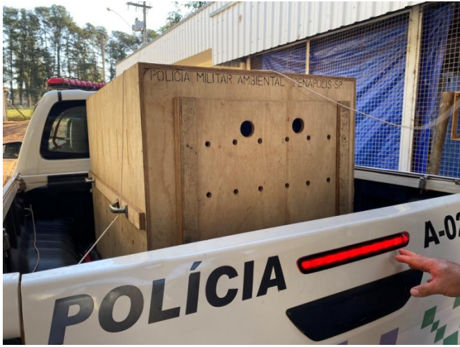
Tamanduá-bandeira RG2009, fêmea jovem atropelada em Barbosa, entregue por Polícia Ambiental de Penapolis.