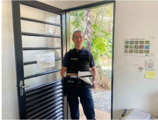
(50674; 50675-50681) – Gambás de orelha branca encontrados em avenida - Guarda Civil de Itupeva em 24/09/24