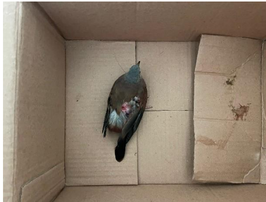
(50507) – Rolinha