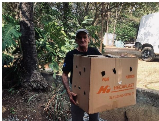
(50516) - Seriema, encontrado por munícipe - SMA Itupeva em 20/09/24