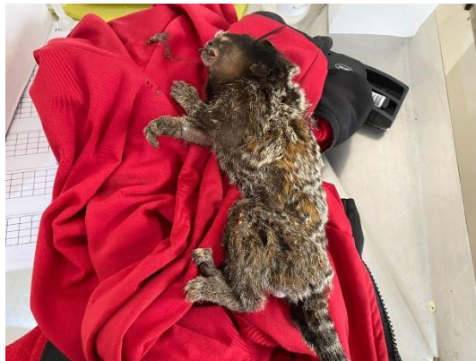
(50276) Sagui de tufo preto