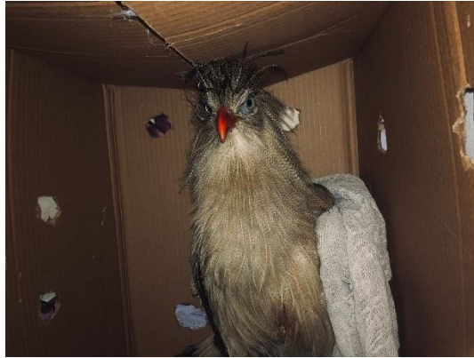
(50516) – Seriema