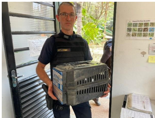
(50700) - Maritaca, encontrado em residência após colidir com parede - GCM de Itupeva em 24/09/24