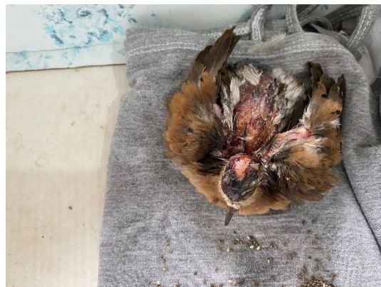
(50428) - Rolinha