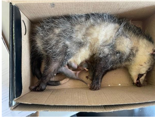
(50674; 50675-50681) – Gambás de orelha branca