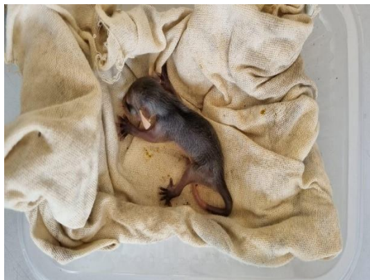
(50760)- gambá de orelha preta