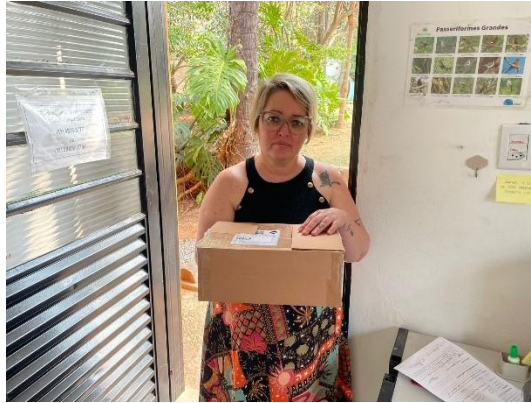
(50507) - Rolinha, ataque de cão - Município de Itupeva em 19/09/24