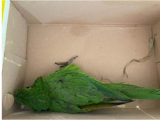
(50700) – Maritaca