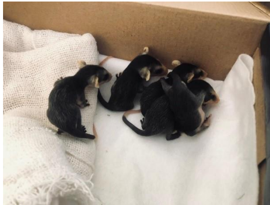
(50856-50861) – Gambás de orelha branca