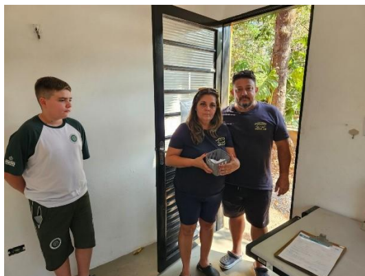
(50349) Gambá, neonato, entregue por munícipe de Itupeva em 12/09/2024