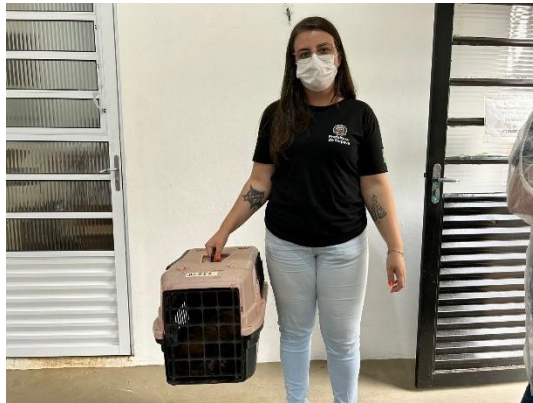
(50533) - Macaco-prego, eletrochoque - Prefeitura de Itupeva em 20/09/24