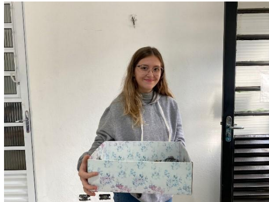
(50428) - Rolinha atacada por gato, trazida por munícipe de Itupeva em 16/09/24