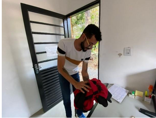
(50276) Sagui de tufo preto, encontrado caído em via pública se contorcendo. Trazido por munícipe de Itupeva em 09/09/2024