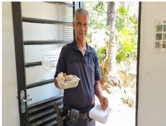
(50760) – Gambá de orelha preta, encontrado em sítio - GCM de Itupeva em 26/09/24