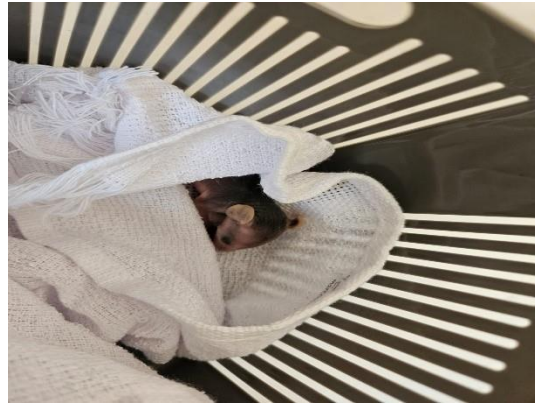
(50349) Gambá, neonato.