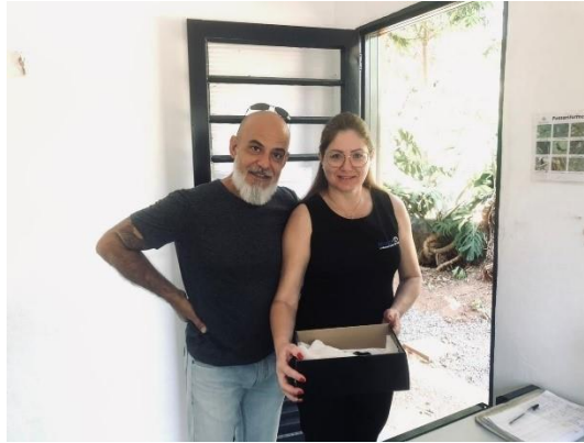
(50856-50861) – Gambás de orelha branca, mãe atacada por cão - Município de Itupeva 30/09/24