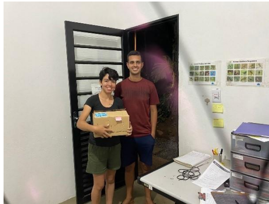
(51401) - Cuíca, adulta, fêmea com filhotes no marsúpio. Entregue por munícipe de Campo Limpo Paulista no dia 12-10-2024