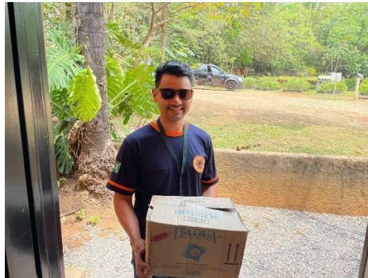
(51566) Gambá de orelha branca, mãe em óbito e filhotes (51567 até 51572) encontrados em avenida e entregues pela Defesa Civil de Campo Limpo Paulista no dia 16-10-2024