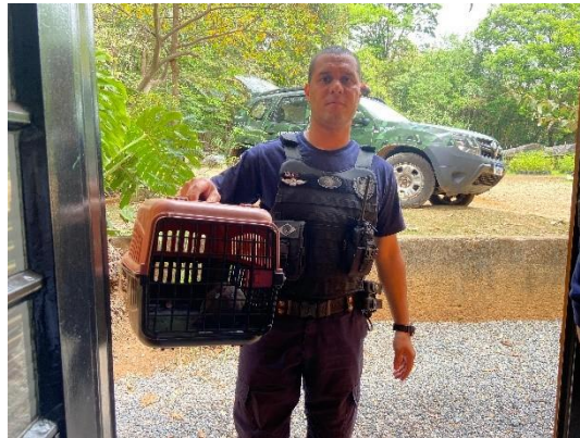
(51782) Asa branca, animal em via pública. Entregue pela GCM de Campo Limpo Paulista no dia 23-10-2024