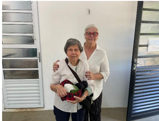
(51948-51949) Periquitos, caíram de tronco de árvore. Entregue por munícipe de campo limpo paulista no dia 29-10-2024