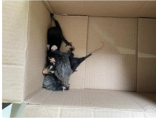
(51623 - 51626) filhotes de gambá de orelha preta