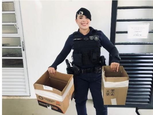
(51449) Periquito rico, caiu do ninho em empresa e (51450 e 51451) - Quero quero, sem histórico. Entregue pela GCM Campo Limpo Paulista no dia 14-10-2024