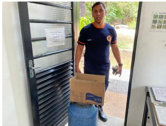
(51622) Gambá de orelha preta, adulta, encontrada em lixeira junto a filhotes (51623 - 51626). Entregue pela Defesa civil de Campo Limpo Paulista no dia 17-10-2024