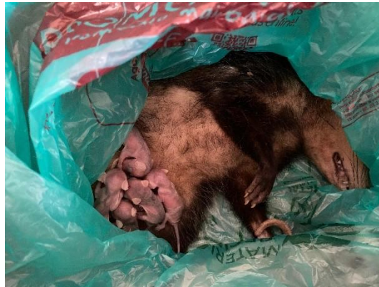
(50901) - Gambá de orelha preta