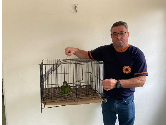
(51759) Maitaca, foi atacada por carcará no ninho, entregue pela Defesa Civil de Campo Limpo Paulista no dia 22-10-2024