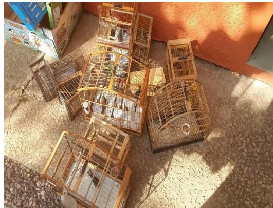
(51893 até 51903) Coleirinhos