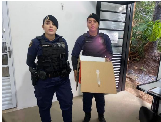
(51843) Gambá-de-orelha-branca, animal encontrado em residência, entregue por GCM de Campo Limpo Paulista, no dia 24-10-2024