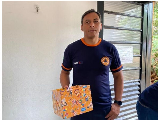
(51719) Gambá-de-orelha-branca, encontrado em residência machucado, entregue pela Defesa Civil de Campo Limpo Paulista no dia 21-10-2024