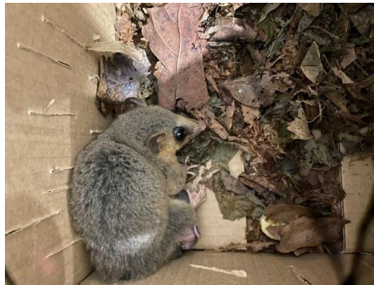
(51401) - Cuíca