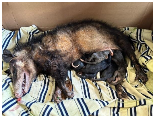
(51361) Gambá de orelha preta

(51361) Gambá de orelha preta, adulta, atacada por cão e recebida em óbito com filhotes (51362 até 51370). Entregue por defesa civil de campo limpo paulista no dia 12-10-2024