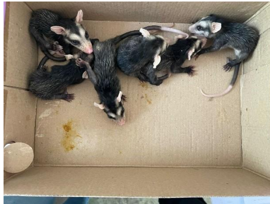
(51567 até 51572) filhotes de gambá de orelha branca