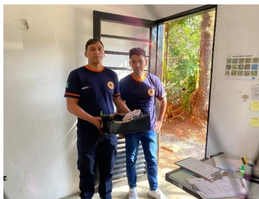
(51413-51415) Gambás, animais encontrados em quintal de residência, mãe morta por ataque de cão. Entregue pela Defesa civil de campo limpo paulista no dia 13-10-2024