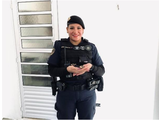
(51122 e 51123) Gambas de orelha branca, encontrados em lixeira. Entregues pela GCM de Campo Limpo Paulista no dia 07-10-2024