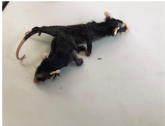
(51122 e 51123) Gambas de orelha branca