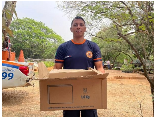
(51213-51219) - Gambás de orelha branca, filhotes órfãos, deixados na base da DF. Entregue por Defesa Civil de Campo Limpo Paulista no dia 09-10-2024