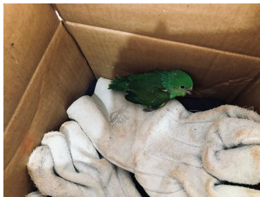
(51449) Periquito rico