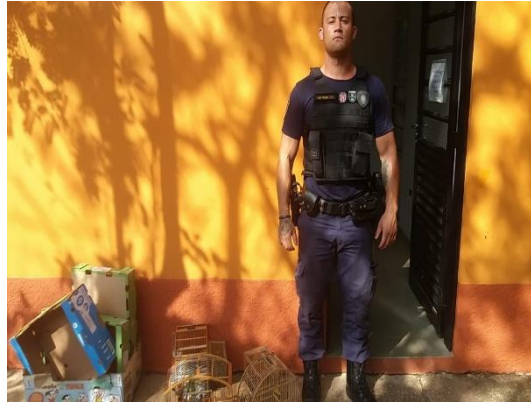
(51893 ate 51903) Coleirinhos, apreensão, flagrante. Entregues pela GCM Campo Limpo Paulista 26-10-2024