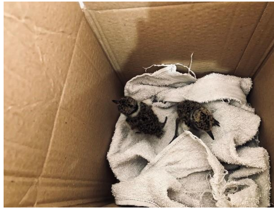
(51450 e 51451) - Quero quero