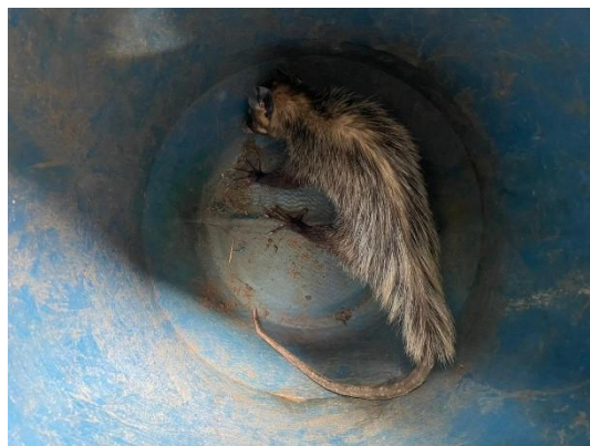
(51622) Gambá de orelha preta