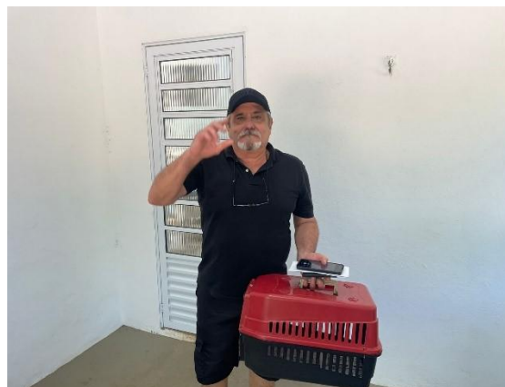
(52002-52004) Sabiá, animais órfãos entregues por munícipe de Campo Limpo Paulista, no dia 31-10-24