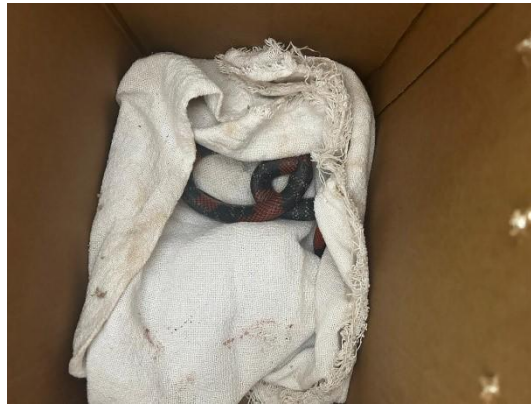
(51158) – Coral