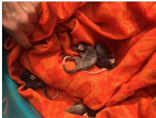
(50986 até 50991) Gambás de orelha branca