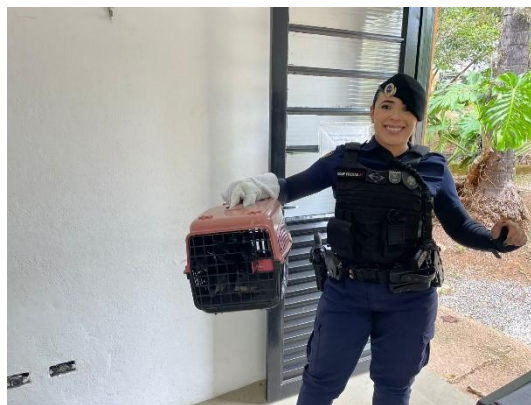
(51928) Urubu, encontrado na rua sem voar. Entregues pela GCM Campo Limpo Paulista no dia 28-10-2024