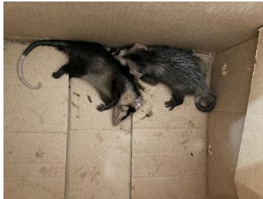
(51763 e 51764) Gambás