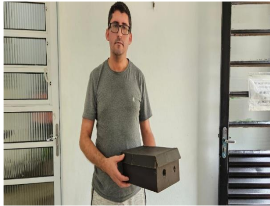
(51862) Beija-flor, animal colidiu com janela e foi entregue por munícipe de Campo Limpo Paulista, no dia 25-10-2024