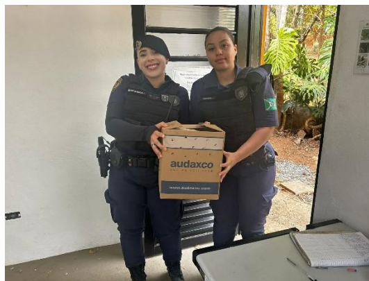
(51158) - Coral, encontrada machucada em via pública. Entregue por GCM de Campo Limpo Paulista no dia 08-10-24