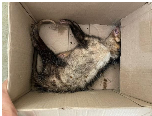
(51566) Gambá de orelha branca em óbito