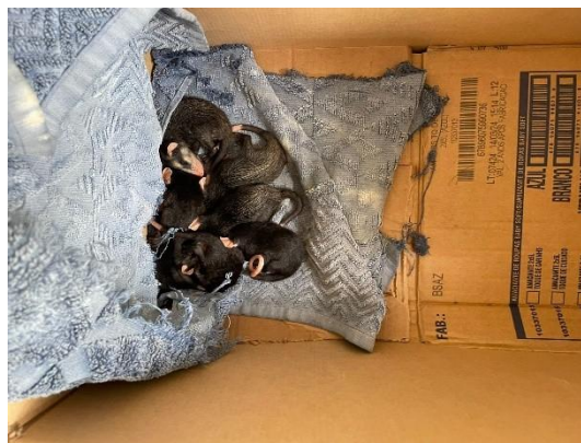
(51213-51219) - Gambás de orelha branca