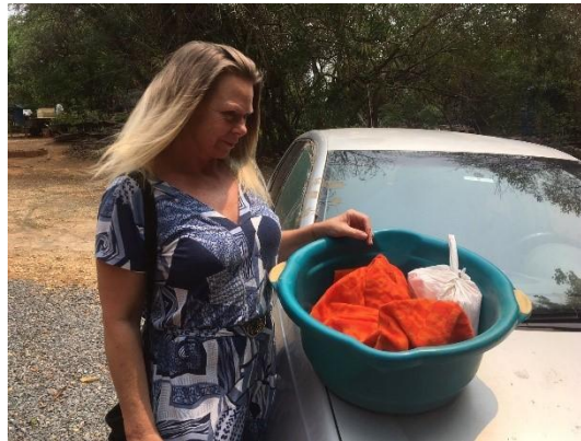
(50986 até 50991) Gambás de orelha branca, encontrados juntos com a mãe em óbito. Entregue por munícipe de campo limpo paulista no dia 03-10-2024