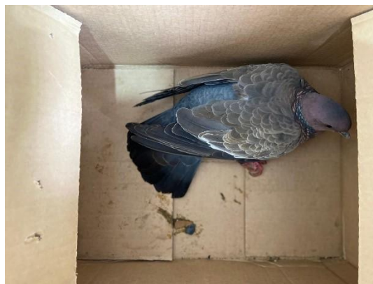
(51782) Asa branca