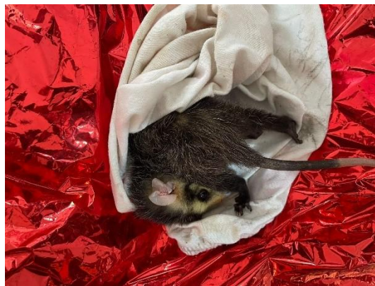
(52310) Gambá de orelha branca