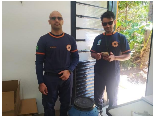
(52247) Ouriço-cacheiro, foi encontrado em quintal de residência, entregue pela Defesa Civil de Campo Limpo Paulista em 11-11-2024