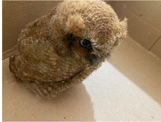
(52567) Corujinha do mato