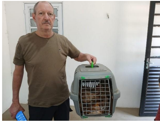
(52642) Gambá de orelha preta, encontrado em residência, entregue por munícipe de campo limpo paulista em 26-11-2024