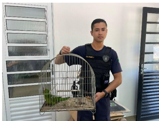
(52270) Maritaca, animal encontrado em chácara, entregue pela GCM Campo Limpo Paulista em 12-11-2024