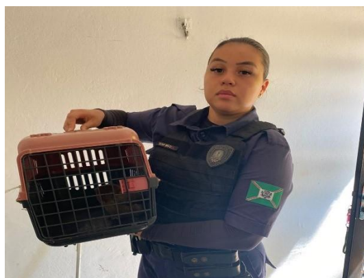
(52567) Corujinha do mato, caiu do ninho e foi entregue para GCM, entregue por GCM Campo Limpo Paulista em 23-11-2024