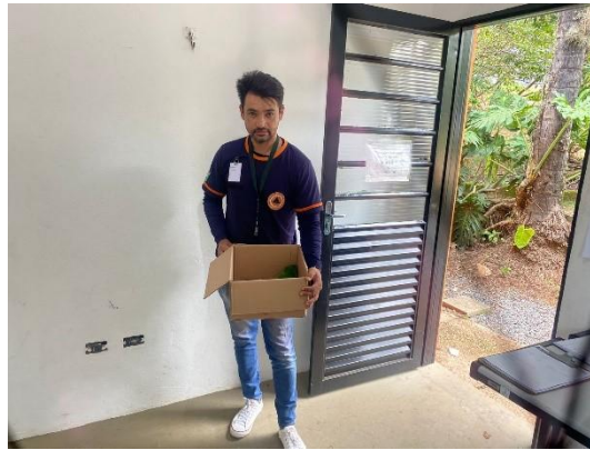
(52380) Maritaca, animal encontrado em quintal, entregue pela Defesa Civil de Campo Limpo Paulista em 17-11-2024