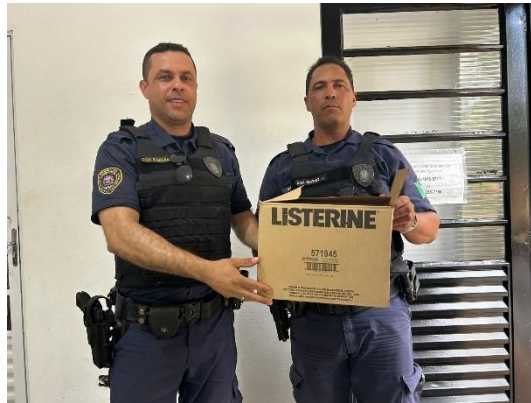
(52610) Andorinha, filhote, encontrada em residência, entregue por GCM Campo Limpo Paulista em 25-11-2024