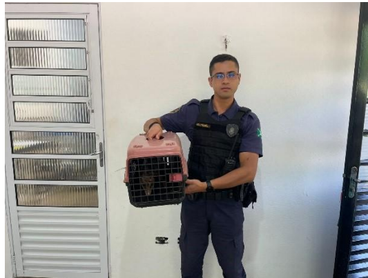
(52156) Gambá de orelha preta, encontrado ferido na rua, entregue pela GM Campo Limpo Paulista em 06-11-2024