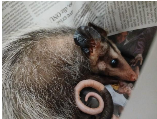
(52642) Gambá de orelha preta