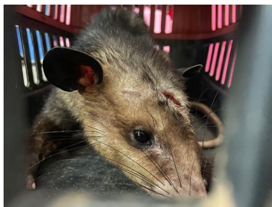
(52156) Gambá de orelha preta