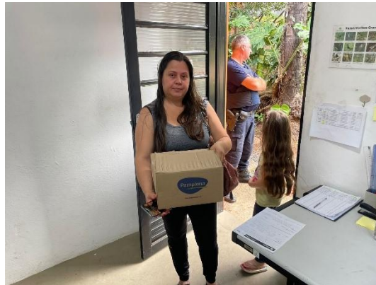
(52472) Coruja do mato, encontrado em chácara, entregue por munícipe de campo limpo paulista em 21-11-2024