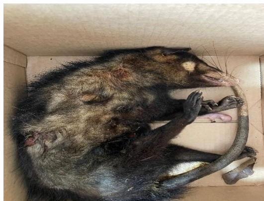
(52455) Gambá de orelha preta