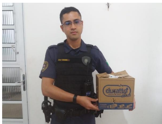
(52113) Saracura, filhote, encontrado caído do ninho, entregue pela GCM Campo Limpo Paulista em 04-11-2024