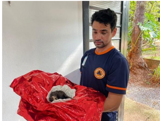
(52310) Gambá de orelha branca, encontrado caído em quintal, entregue pela prefeitura de Campo Limpo Paulista em 13-11-2024