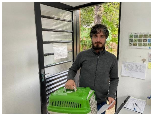
(52318) Avoante, encontrado em residência, entregue por município de Campo Limpo Paulista 13-11-2024