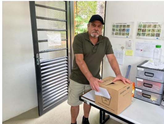
(52455) Gambá de orelha preta, mãe atacada por cachorro em óbito, entregue por município de campo limpo paulista em 21-11-2024