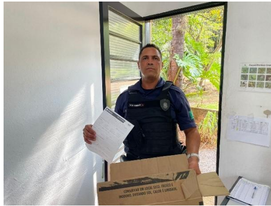
(52308) Gambá de orelha preta, encontrado em residência, entregue pela GCM Campo Limpo Paulista em 13-11-2024