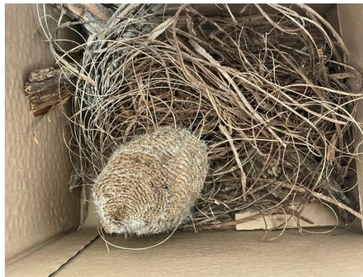
(52472) Coruja do mato