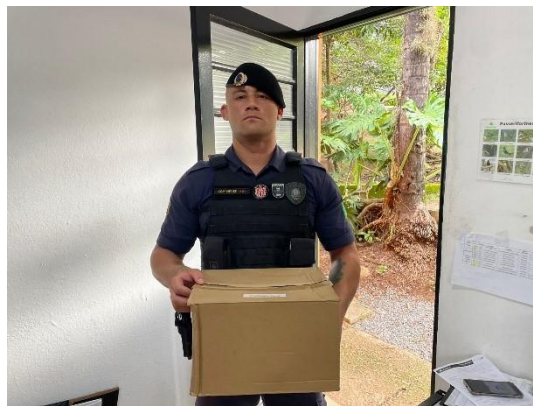
(52320) Pica-pau, colidiu com vidro, entregue pela GCM Campo Limpo Paulista em 13-11-2024