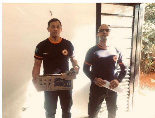
(52407) Maritaca, colidiu com vidro, entregue por defesa civil de campo limpo paulista em 18-11-2024