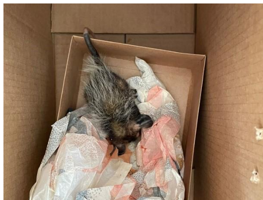
(52308) Gambá de orelha preta