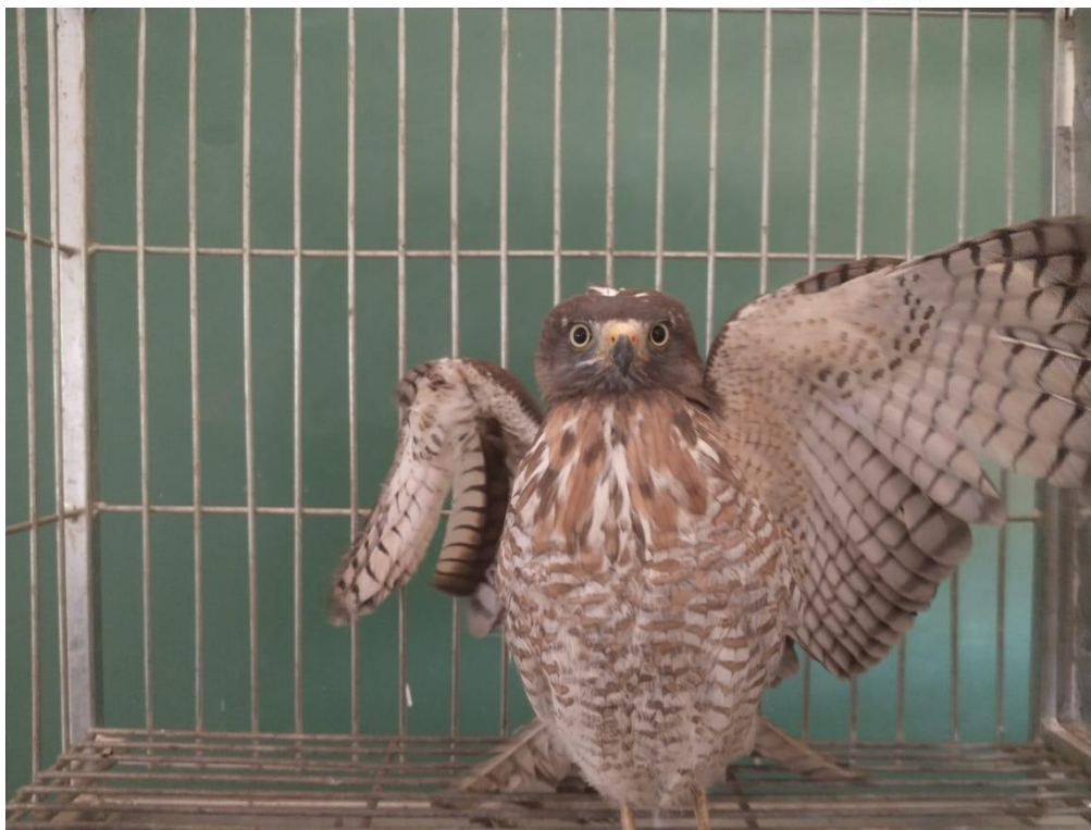
Figura 2 - Gavião carijó RG: 2019 encontrado ferido - Araçatuba