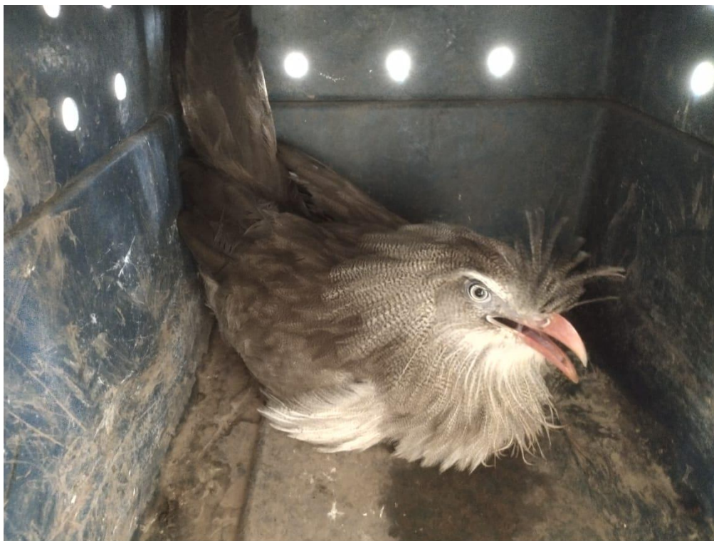
Figura 5 - Seriema RG: 2022 encontrada em quintal - Araçatuba