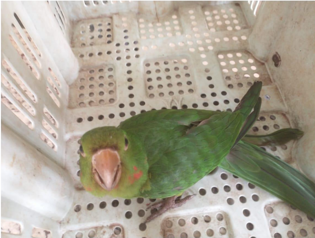
Figura 8 - Maritaca 2025 encontrada ferida - Mirandópolis