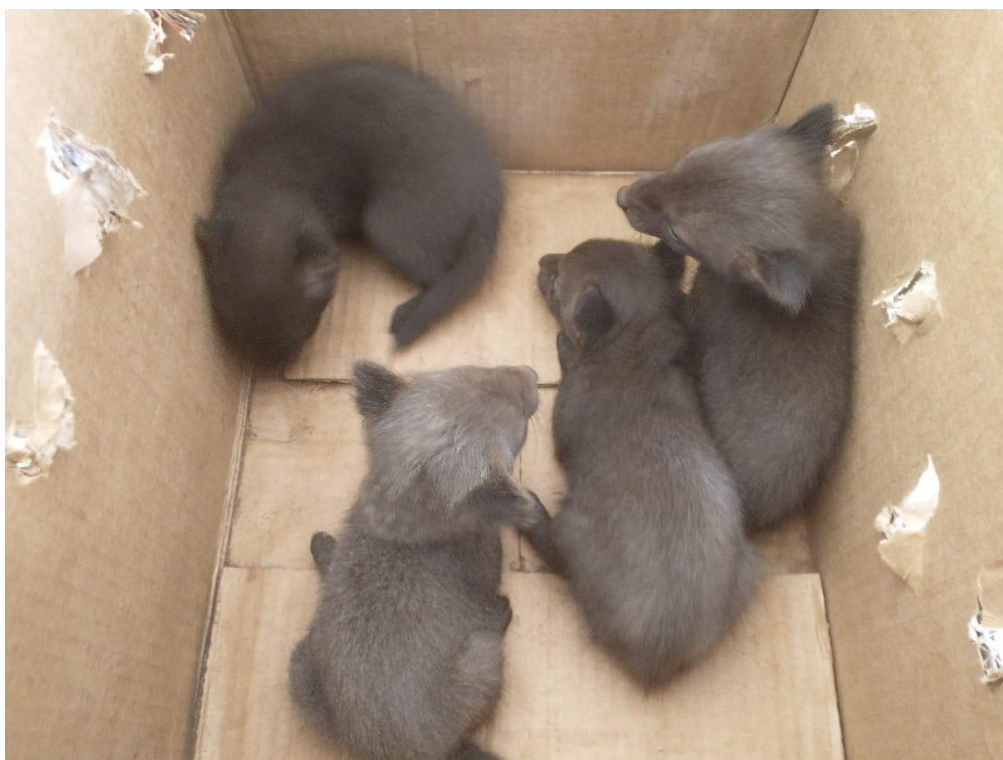
Figura 1 - Cachorros do mato RGs: 2015 ao 2018 órfãos - Araçatuba