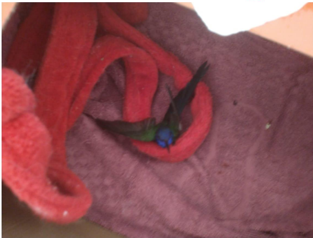
Figura 4 - Beija flor RG: 2021 encontrado ferido - Araçatuba