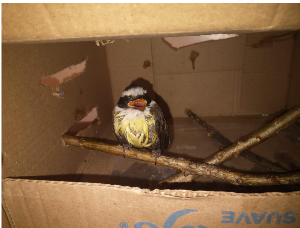
Figura 10 - Bem te vi RG: 2027 órfão - Araçatuba