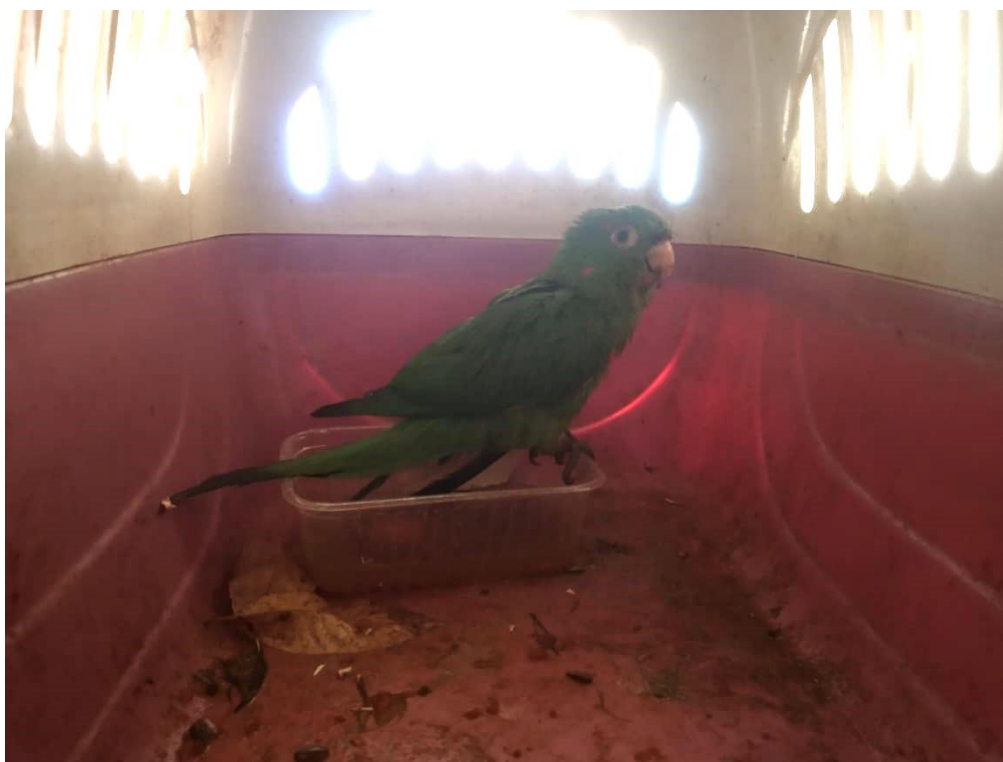
Figura 3 - Maritaca RG: 2020 Encontrada ferida em via pública - Araçatuba