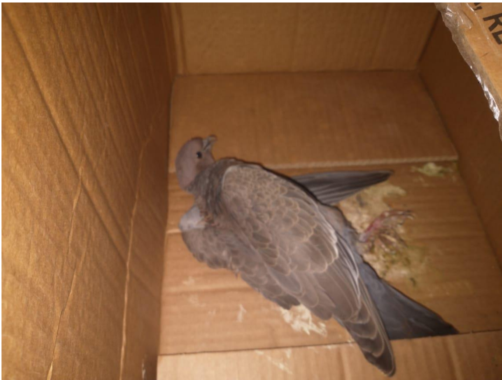
Figura 9 - Asa branca RG: 2026 encontrada ferida - Araçatuba