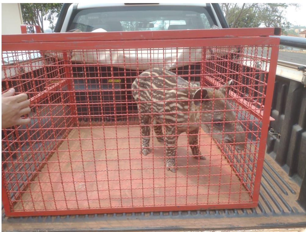
Figura 7 - Anta RG: 2024 órfão vítima de queimada - Mirandópolis