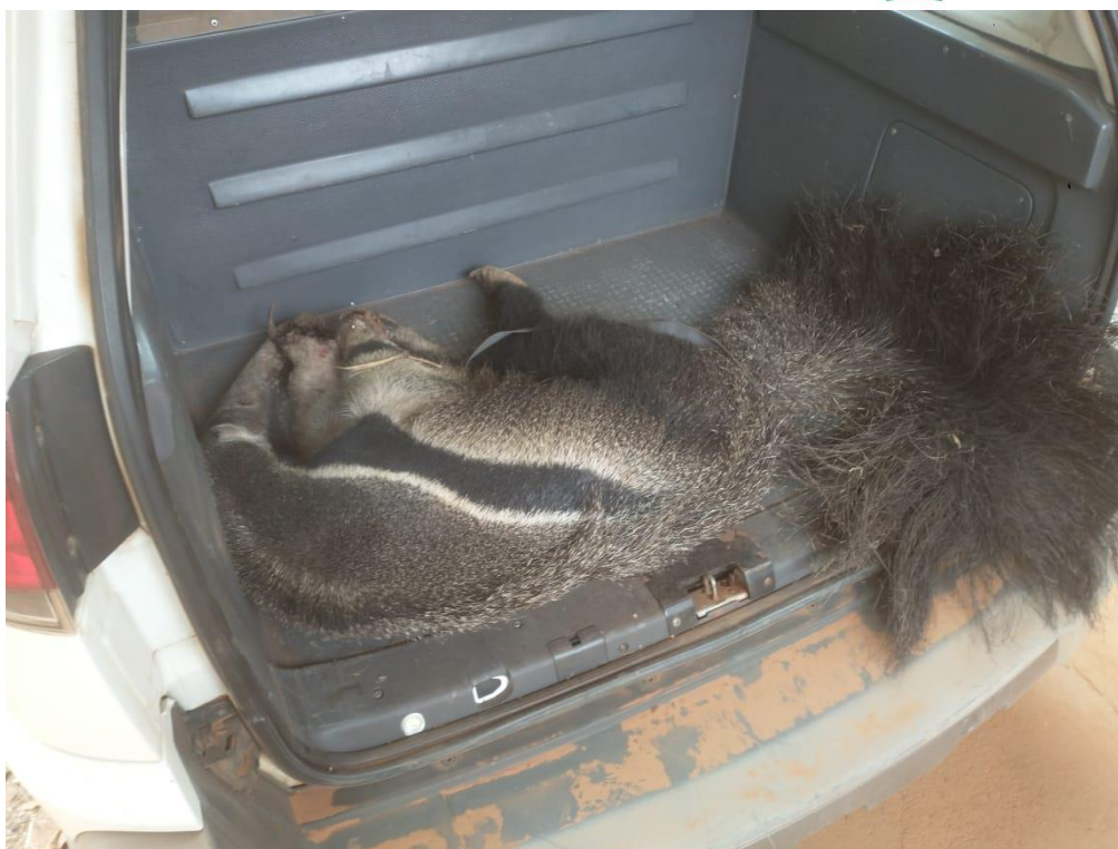
Figura 6 - Tamanduá bandeira RG: 2023 vítima de queimada - Braúna