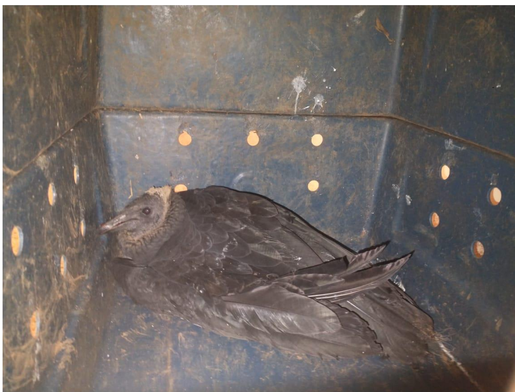
Figura 11 - Urubu RG: 2028 encontrado ferido - Birigui