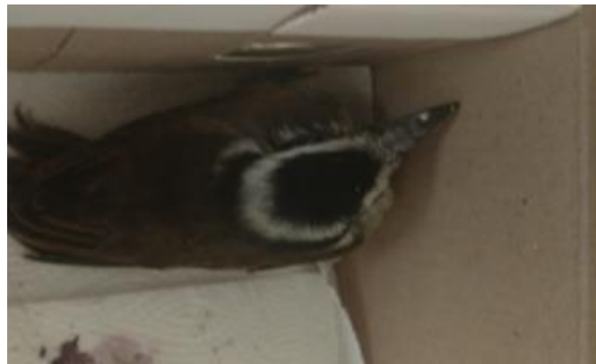
(47607) - Bem-te-vi, sem histórico. Proveniente de Bragança paulista no dia 02-01-2024