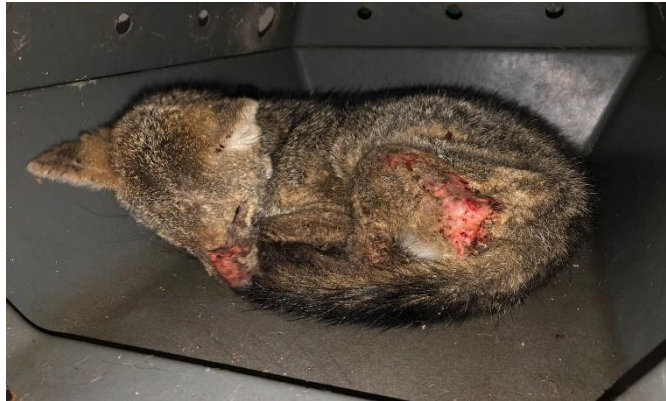
(47996) - Cachorro do mato, adulto, negativo para cinomose - Proveniente de Bragança Paulista no dia 19-01-2024