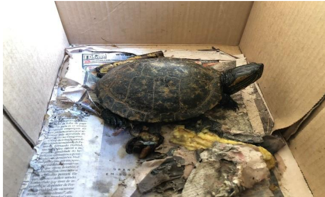
(47970) - Tigre d'agua. Proveniente de Bragança paulista no dia 18-01-2024