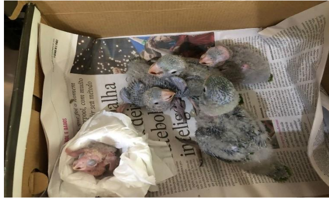
(48025 ao 48029) - Maritacas, filhotes. Provenientes de Bragança Paulista no dia 20-01-2024