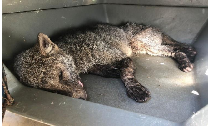
(47969) - Cachorro do mato, adulto. negativo para cinomose Proveniente de Bragança Paulista no dia 18-01-2024