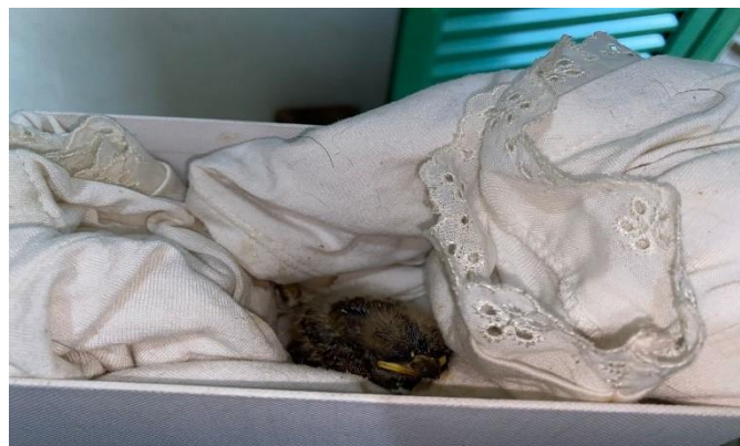
(47667) - Passeriforme, filhote, resgate. Proveniente de Bragança paulista no dia 05-01-2024