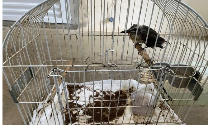
(47668) - Bem-te-vi, jovem, resgate. Proveniente de Bragança paulista no dia 05-01-2024