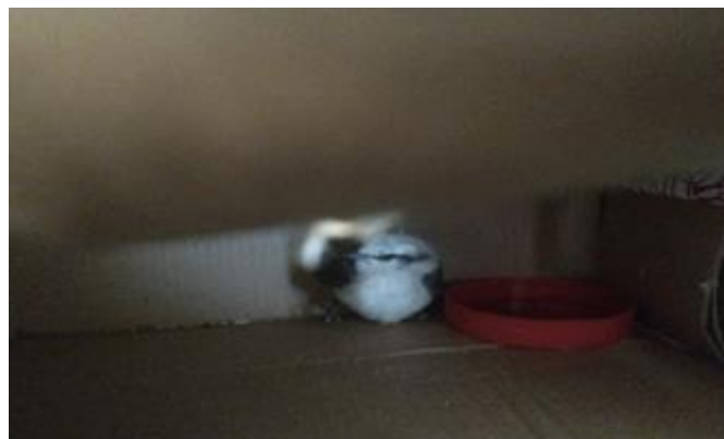
(47608) - Lavadeira mascarada, sem histórico. Proveniente de Bragança paulista no dia 02-01-2024