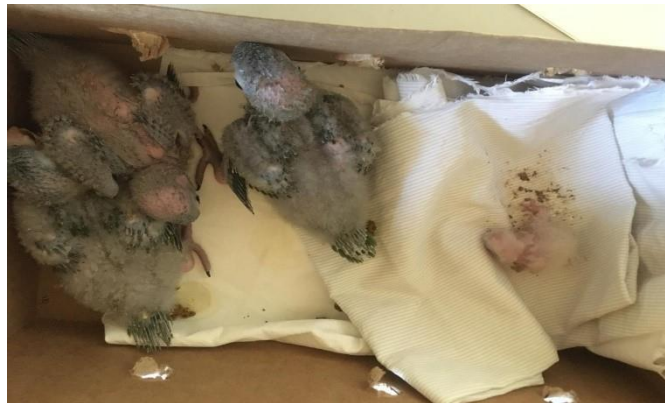
(47748 até 47751) - Maritacas, filhotes - provenientes de Bragança paulista no dia 09-01-2024