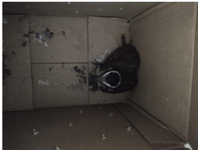
(47734) - Bem-te-vi, jovem, encontrado em via pública no centro da cidade - Provenientes de Bragança Paulista no dia 09-01-2024