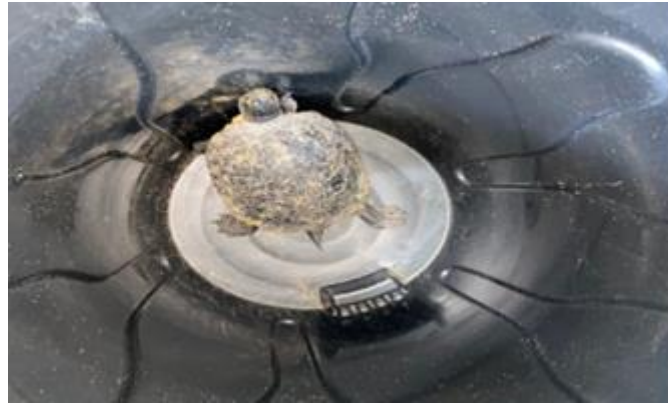
(47669) - Tigre d'agua, adulto, resgate. Proveniente de Bragança paulista no dia 05-01-2024