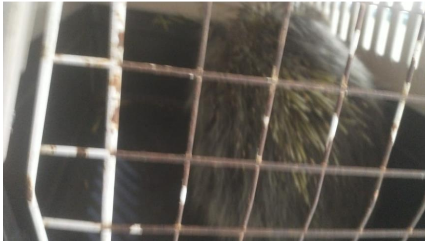
(47606) - Ouriço cacheiro, sem histórico. Proveniente de Bragança paulista no dia 02-01-2024