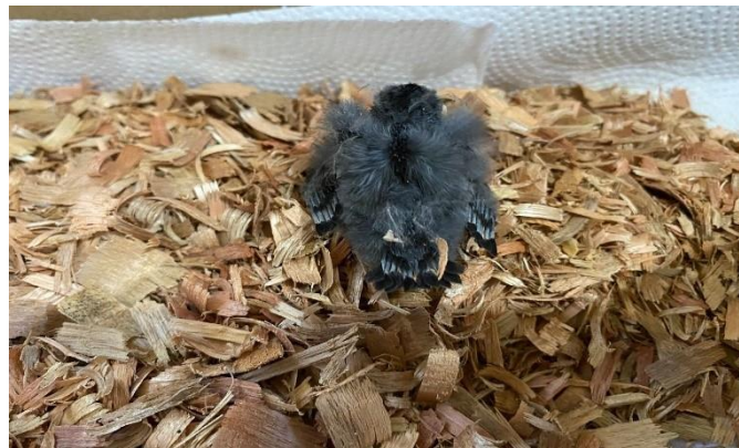
(47666) - Andorinha, filhote, resgate - Proveniente de Bragança paulista no dia 05-01-2024