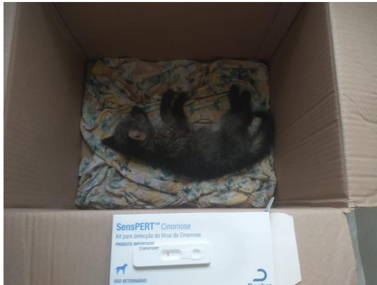
(47661) - Cachorro do mato, filhote, fêmea, visto sendo atacado por cachorros, negativo cinomose - Proveniente de Bragança paulista no dia 05-01-2024