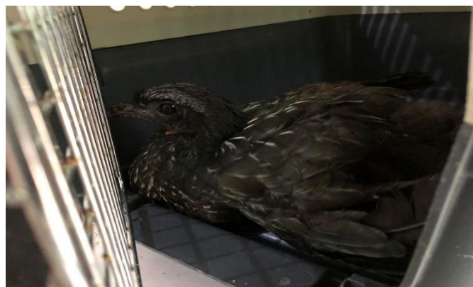
(47796) - Jacu, adulto, encontrado em via pública - Proveniente de Bragança Paulista no dia 11-01 -2024