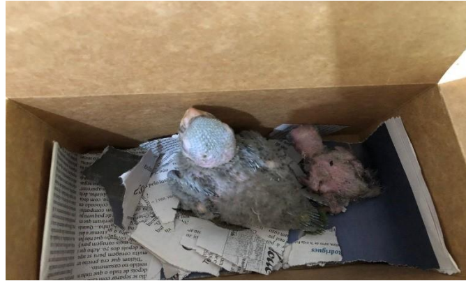
(47797 e 47798) - Maritaca, filhotes, encontradas em chão de condomínio - Proveniente de Bragança Paulista no dia 11-01-2024