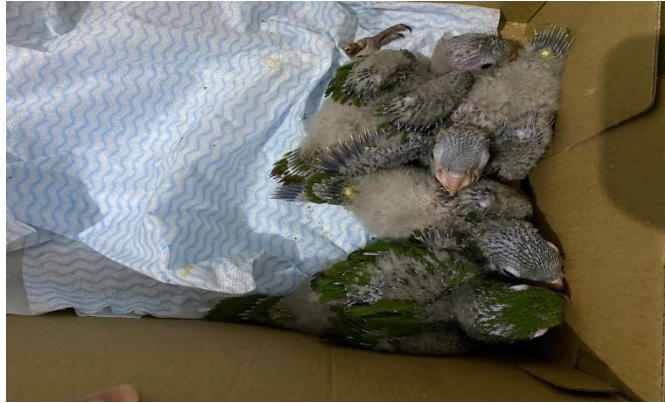
(48091 ao 48094) - Maritacas, resgatados fora do ninho dentro do forro de residência. Proveniente de Bragança Paulista no dia 24-01-2024