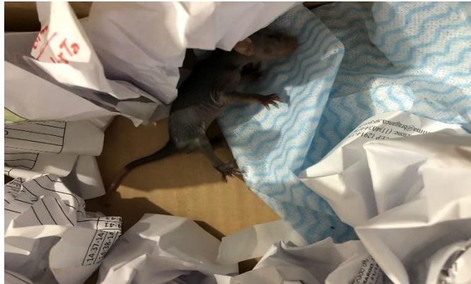
(47950) - gambá de orelha branca, filhote. Proveniente de Bragança Paulista no dia 17-01-2024