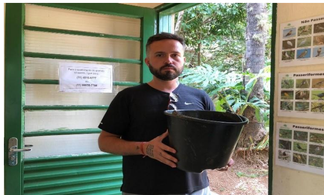
(47813 ao 47819) - Gambás, filhotes, mãe encontrada em obito no local - município Bragança paulista no dia 12-01-2024