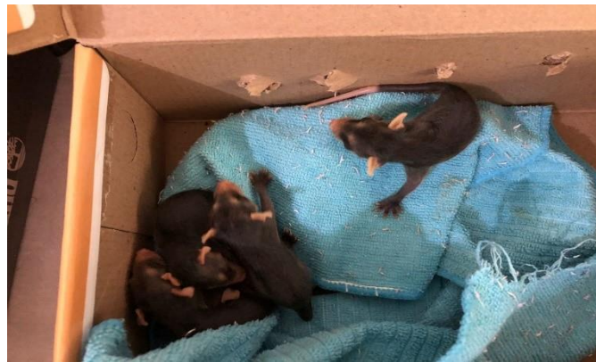
(48030 ao 48038) - Gambás, filhotes. Provenientes de Bragança Paulista no dia 20-01-2024