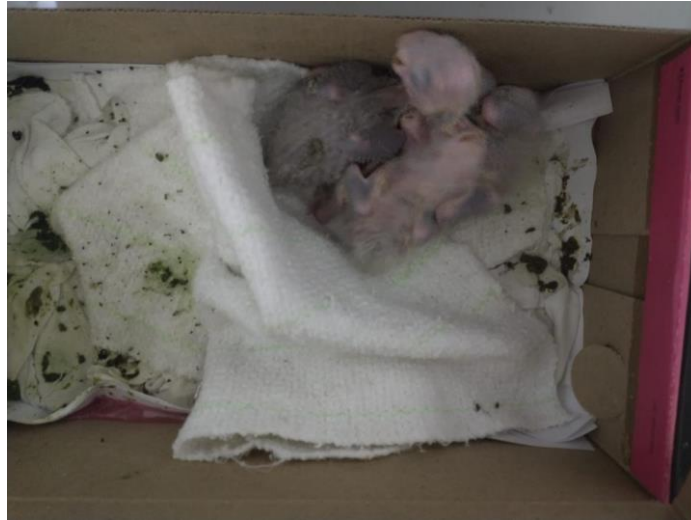
(47735 ao 47738) - Maritacas, filhotes, caíram do telhado - Proveniente de Bragança paulista no dia 09-01-2024