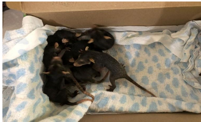
(47799 ao 47806) - Gambás, filhotes, encontrados ao lado do corpo da mãe em obito - Proveniente de Bragança Paulista no dia 11-01-2024