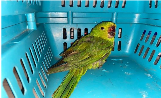
(48167) - Maritaca, sem histórico. Proveniente de Bragança Paulista no dia 29-01-2024