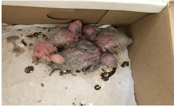
(47928 ao 47931) - Maritacas, filhotes. Provenientes de Bragança Paulista no dia 16-01-2024