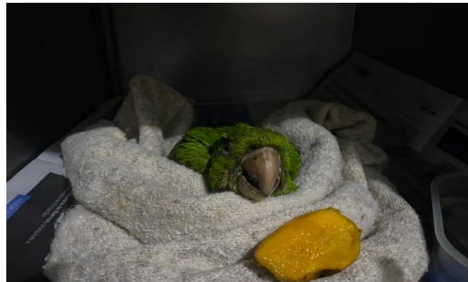
(48042) Maritaca. Provenientes de Bragança Paulista no dia 20-01-2024