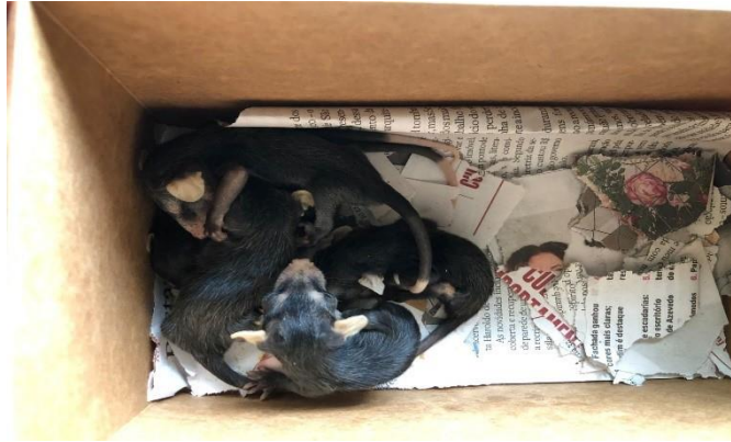
(47813 ao 47819) – Gambás