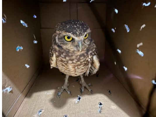
(49784) coruja buraqueira, encontrado em garagem de residência. Proveniente de Bragança paulista no dia 26/07/2024