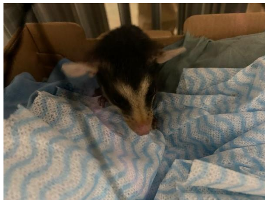
(49707) Gambá filhote, com amputação traumática de cauda, animal sem histórico. Proveniente de Bragança Paulista no dia 15/07/2024