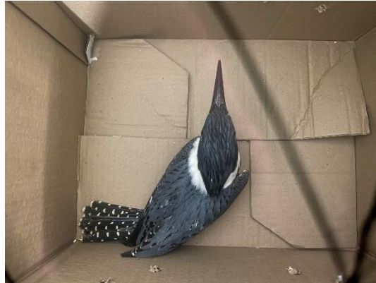
(49699) Martim-pescador, animal sem histórico. Proveniente de Bragança Paulista no dia 12/07/2024