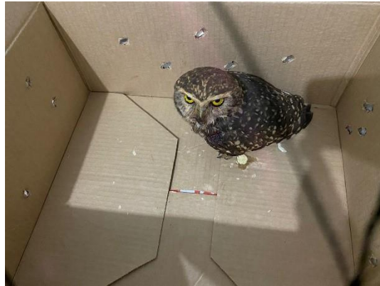
(49785) Coruja-buraqueira. Proveniente de Bragança Paulista no dia 26/07/2024