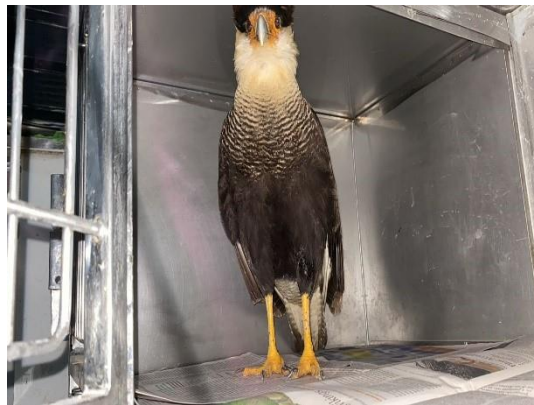
(49786) Carcará. Proveniente de Bragança Paulista no dia 26/07/2024