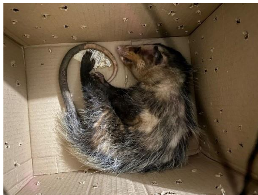
(49751) Gambá de orelha preta, adulto, chegou em decúbito lateral e com nível de consciência alterado. Proveniente de Bragança Paulista no dia 19/07/2024