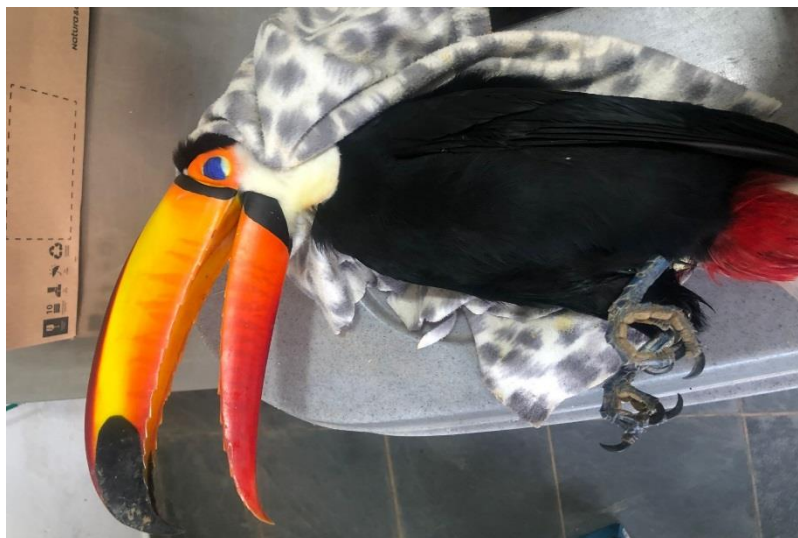
(43696) - Tucano-toco.