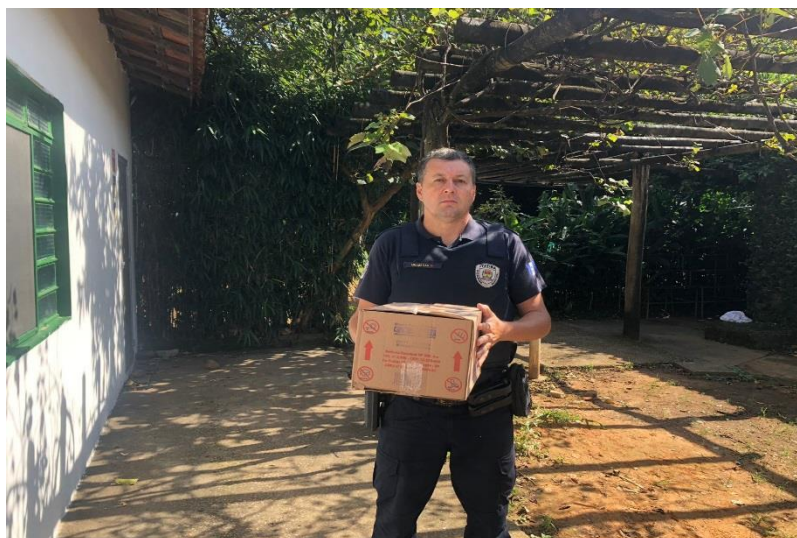
(43493) - Maritaca, encontrado na Santa Casa, apresenta splay leg. Entregue pela Guarda Municipal de Itatiba no dia 02-04-2023.