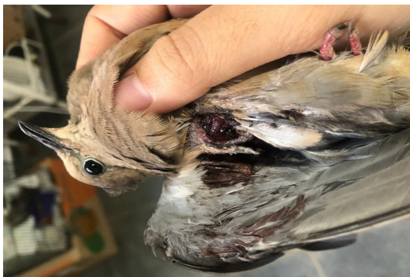
(43697) – Avoante.