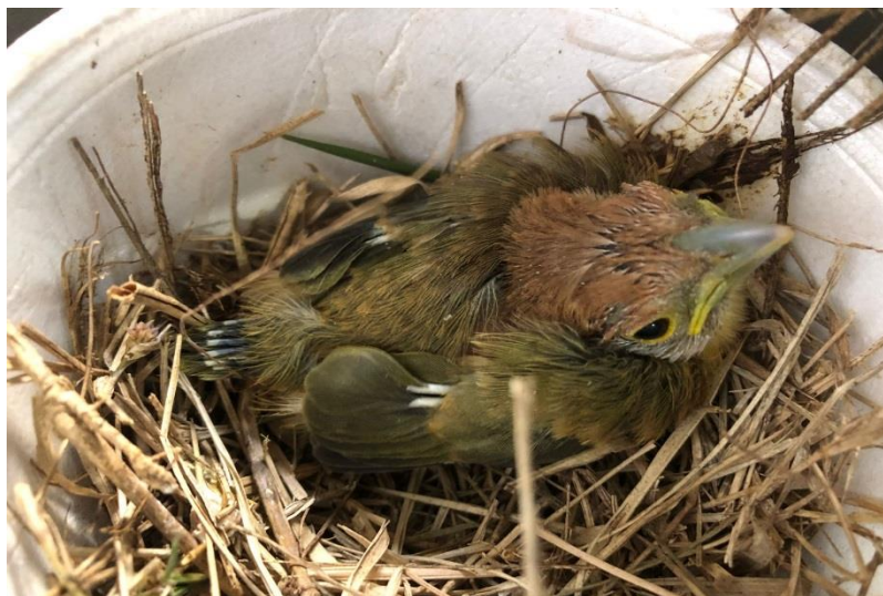
(43495) – Pitiguari.