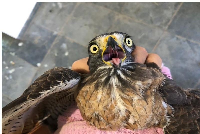
(43688) - Gavião-carijó.