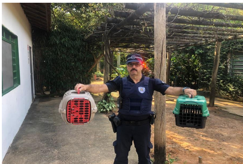
(43696) - Tucano-toco, encontrado em chácara, deprimido, não se mantém em estação; e (43697) - Avoante, atacado por gato, com extensa lesão em região peitoral. Entregue pela Guarda Municipal de Itatiba no dia 23-04-2023.