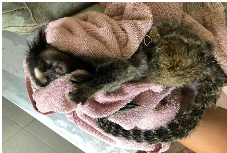
(43532) – Sagui-de-tufo-preto.