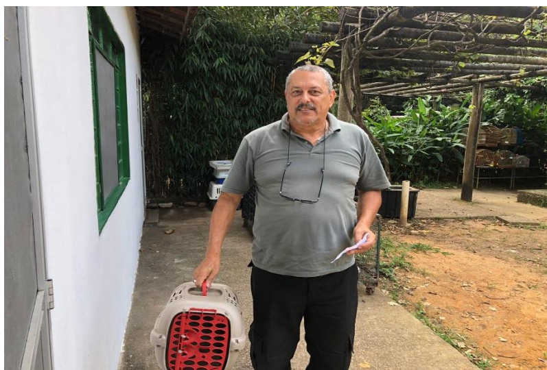
(43532) – Sagui-de-tufo-preto, apresenta edema em membro pélvico esquerdo. Entregue pela Guarda Municipal de Itatiba no dia 05-04-2023.