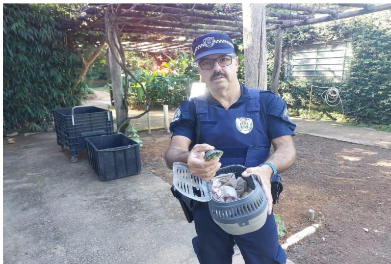
(43656) - Tigre-d'água, filhote. Entrega pela Guarda Municipal de Itatiba no dia 15-04-2023.