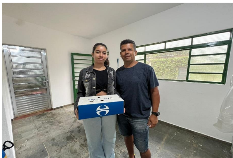
(43561) - Maritaca, encontrada em residência, apresenta splay leg. Entregue por munícipe de Itatiba no dia 07-04-2023.