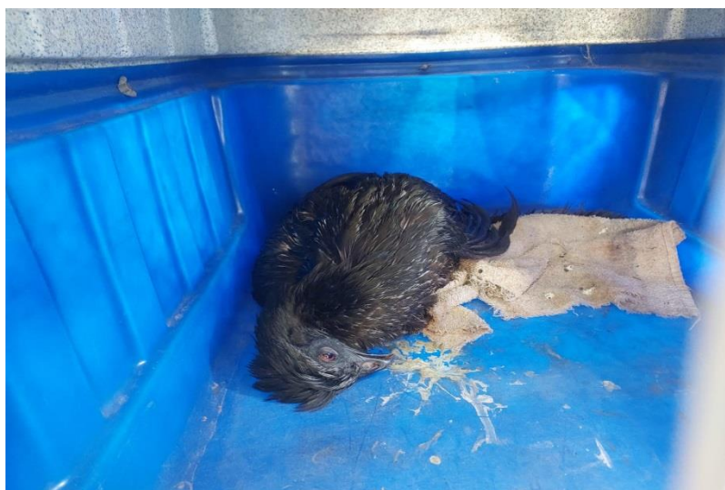
(43642) – Jacu.