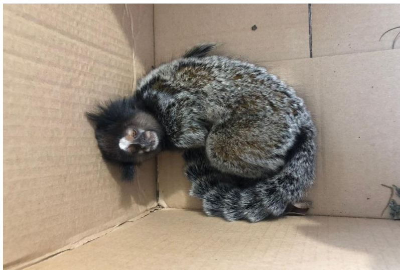
(43592) – Sagui-de-tufo-preto.