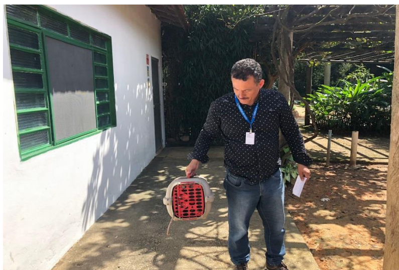
(43681) – Gamá-de-orelha-preta, macho, atacado por cão dentro de residência. Entrega pela Guarda Municipal de Itatiba no dia 20-04-2023.