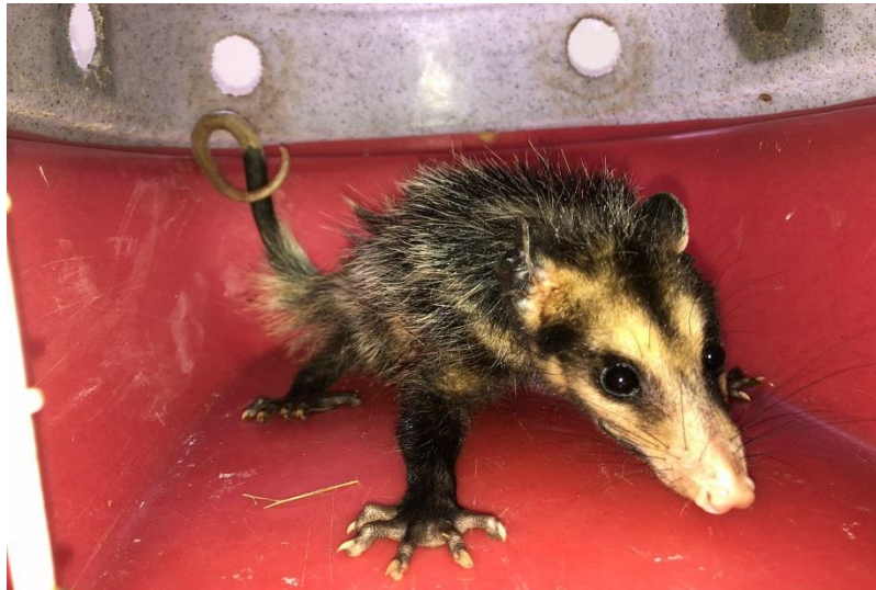
(43681) – Gamá-de-orelha-preta.