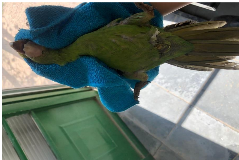
(43493) – Maritaca.