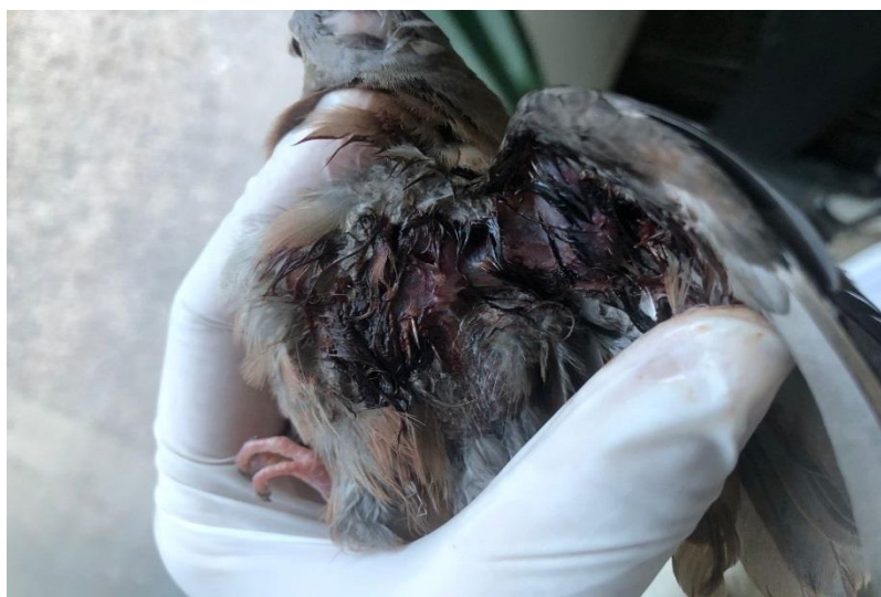
(43593) - Rolinha-roxa.