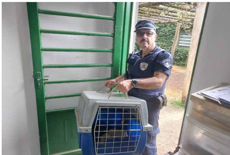
(43642) - Jacu, adulto, provavelmente atacado por cão, chegou em óbito. Entregue pela Guarda Municipal de Itatiba no dia 15-04-2023.