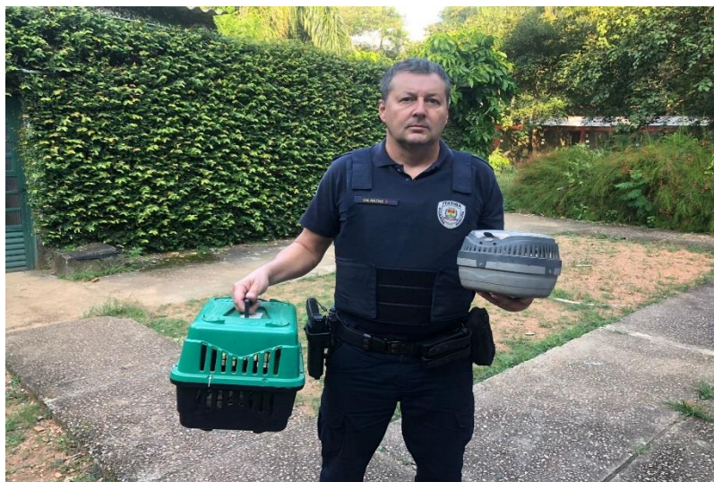
(43495) - Maritaca, com corte de penas de asa e mansidão; e (43495) - Pitiguari, filhote, encontrado caído no chão. Entregues pela Guarda Municipal de Itatiba no dia 02-04-2023.