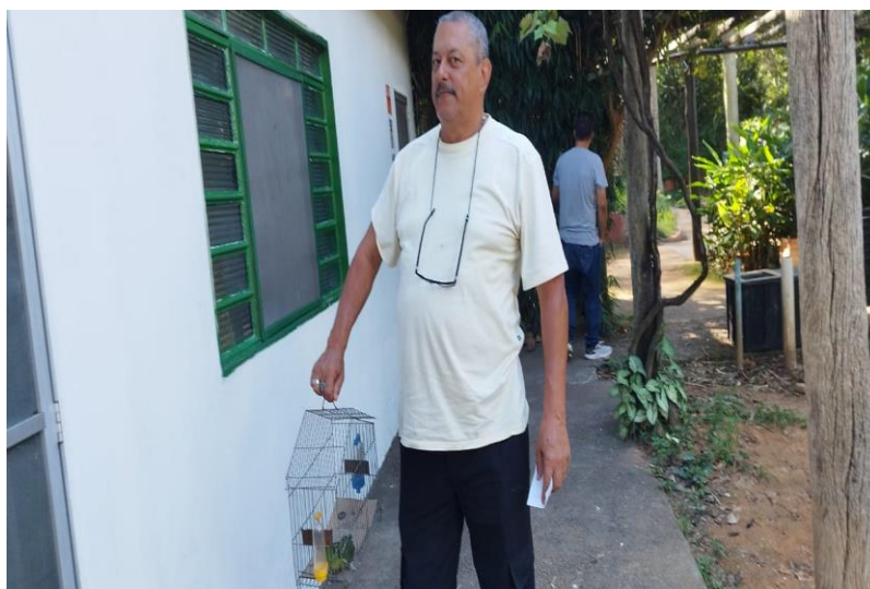
(43520) - Maritaca, filhote, atacado por gato. Entregue pela Guarda Municipal de Itatiba no dia 04-04-2023.