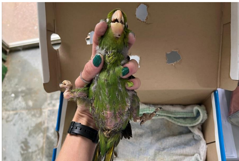
(43561) – Maritaca.