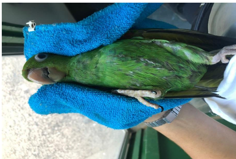
(43495) – Maritaca.