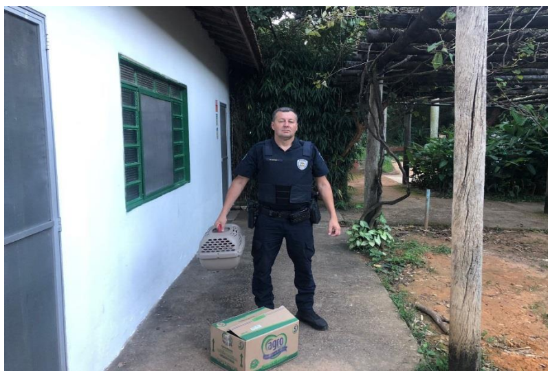
(43592) – Sagui-de-tufo-preto, encontrado caído, sem reflexo pupilar e com mioclonia; e (43593) - Rolinha-roxa, atacada por gato, apresenta lesão em região da asa e exposição de calota craniana. Entregues pela Guarda Municipal de Itatiba no dia 10-04-2023.