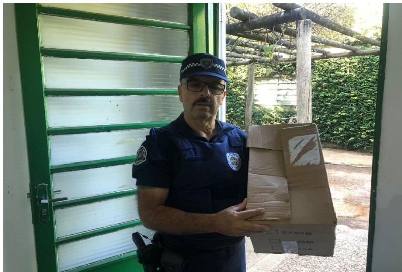
(43688) - Gavião-carijó, encontrado em residência, com fratura em asa esquerda e sangramento ativo. Entregue pela Guarda Municipal de Itatiba no dia 21-04-2023.